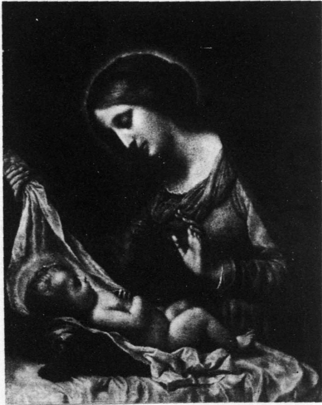
耶 穌 降 生