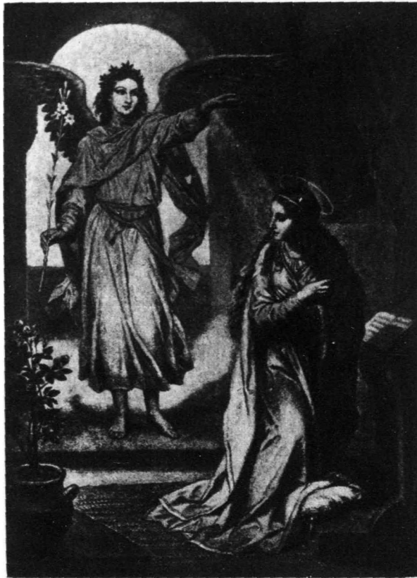
加百列豫言耶穌的生