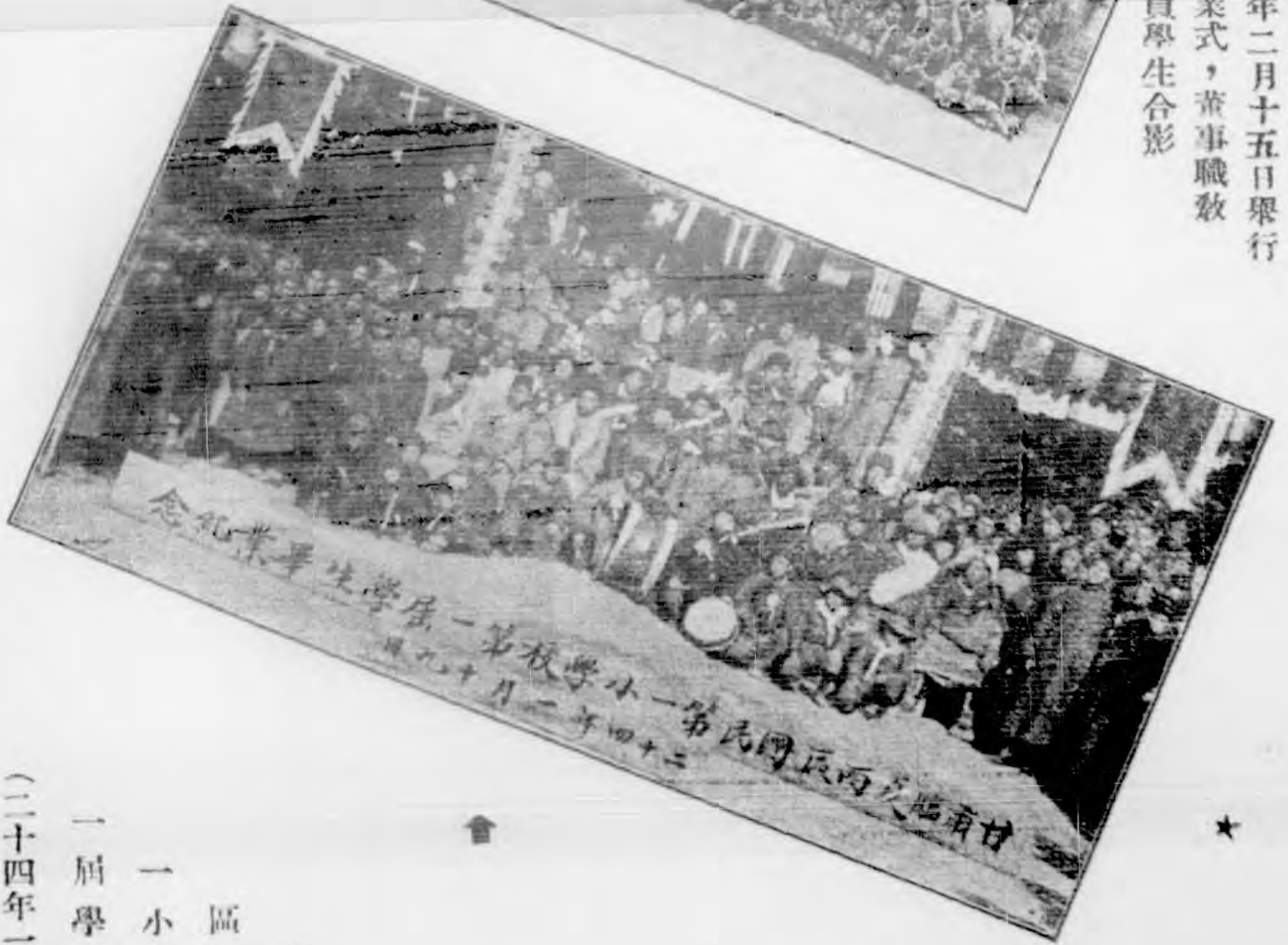
甘肅 臨夏西 區國民第 一小學校第 一屆學生畢業