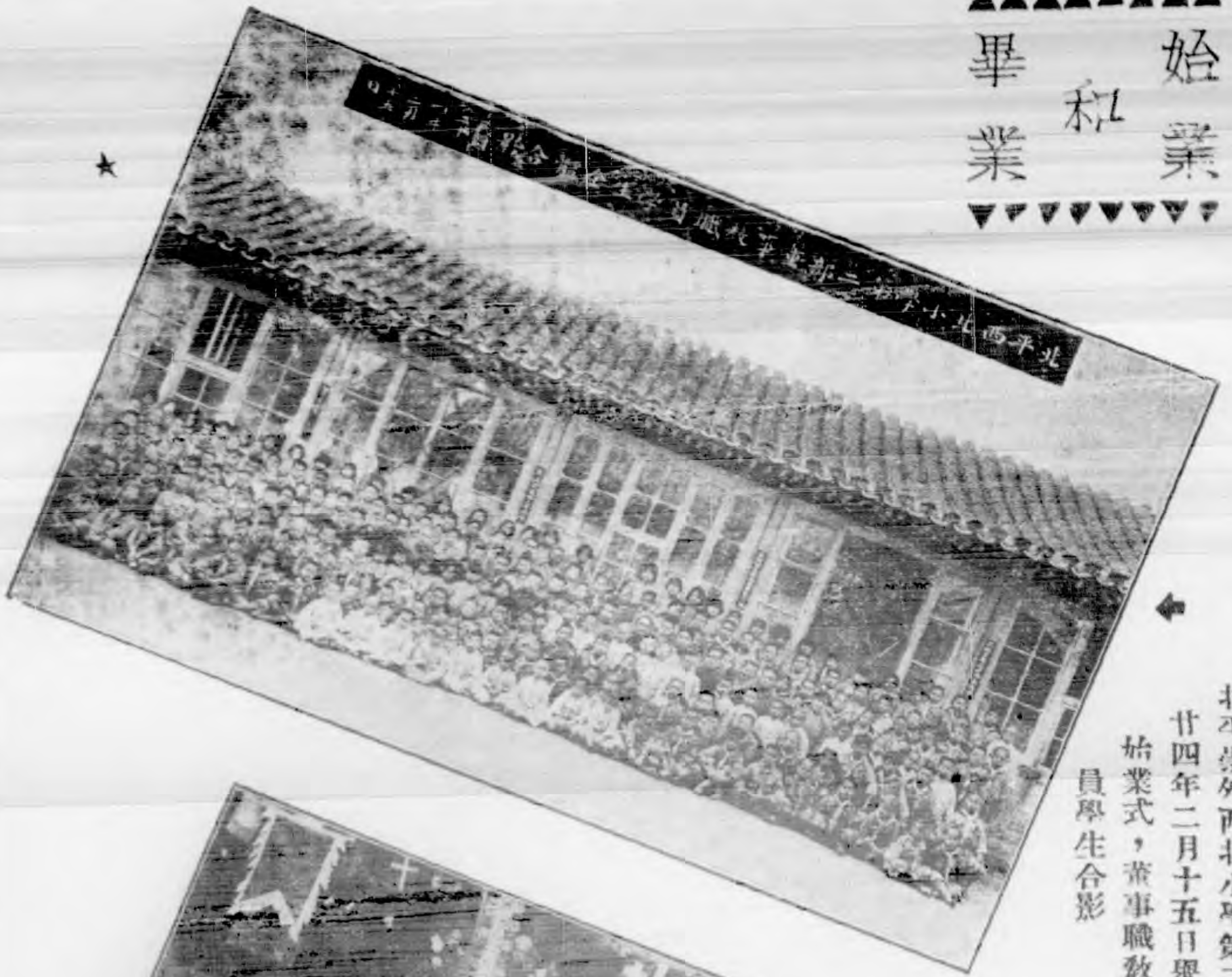
北平崇外西北小學第二部， 廿四年二月十五日舉行 始業式，董事職教 員學生合影