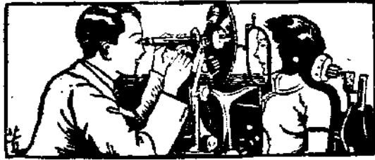
(一之影縮器儀光驗)

目力之健全與否。對於生活之美滿。關係彌切。設因目力不濟。生活即不能愉快。且無形中喪失事業與學業之進展機會。補救之法。唯有配戴合度眼鏡。本公司聘有學驗俱富之眼光學師。採用美國 A O C 廠最新儀器。免費驗光。且全部眼鏡。售價極度低廉。歡迎參觀。