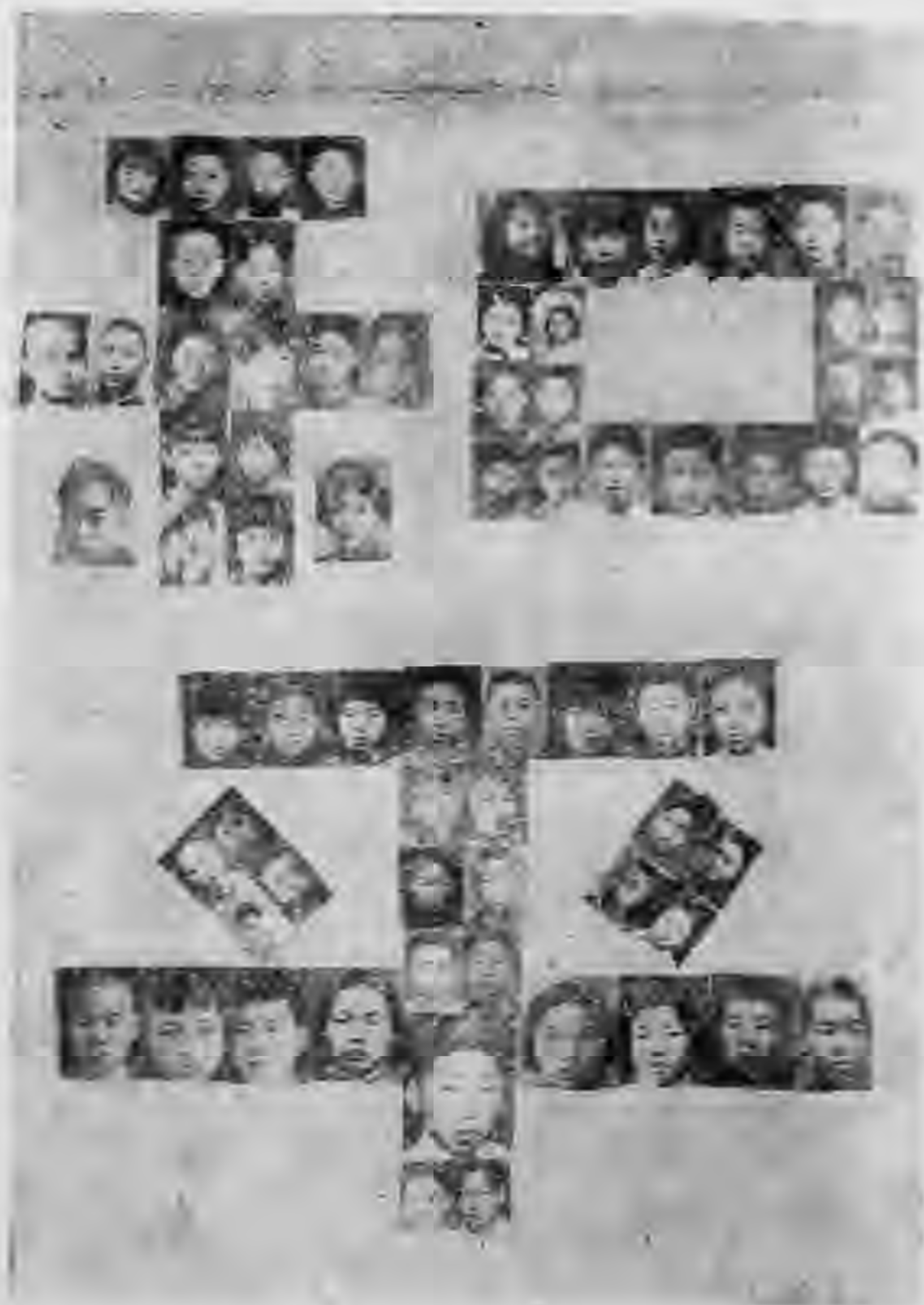
全 國 兒 童 和 平 徵 文 優 勝 兒 童 留 影