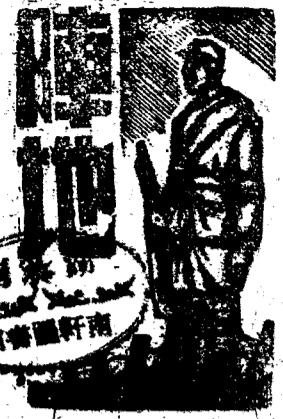
地獄的淪陷區經濟生活