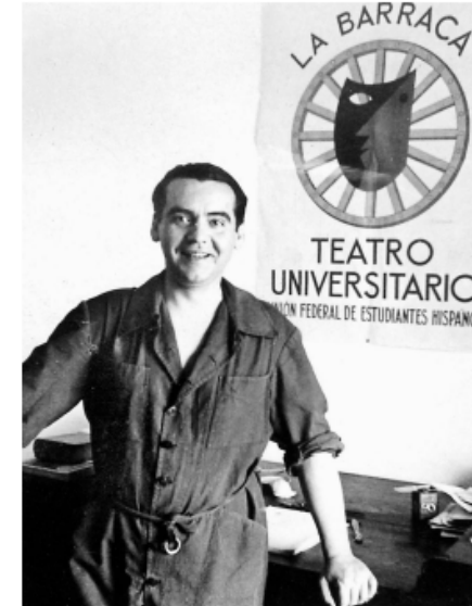
Federico Garcia Lorca devant une affiche pour sa compagnie théâtrale La Barraca, en 1935.

« Une victime parmi d'autres » Après l'échec des recherches menées en 2009 par la région andalouse, sur la base du travail de Ian Gibson, une nouvelle campagne a en effet commencé en 2014 pour le localiser à partir des travaux de ML