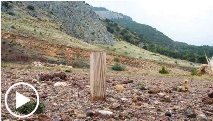
Paraje del Peñón del Colorado, con la señalización del terreno donde se quieren buscar por tercera vez los restos de García Lorca

Archivado en: Federico García Lorca | Ian Gibson | Memoria histórica | Fosas comunes | Literatura española | Guerra civil española | Historiografía | Matanza civiles