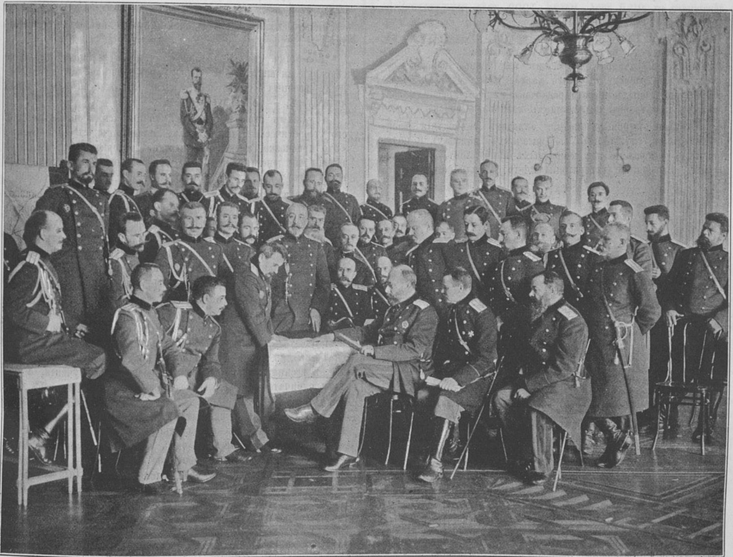
Офицеры генеральнаго штаба Варшавскаго военнаго округа на тактическихъ занятіяхъ подъ руководствомъ генераль-лейтенанта Боголюбова. (Къ корреспонденціи «Варшава»).