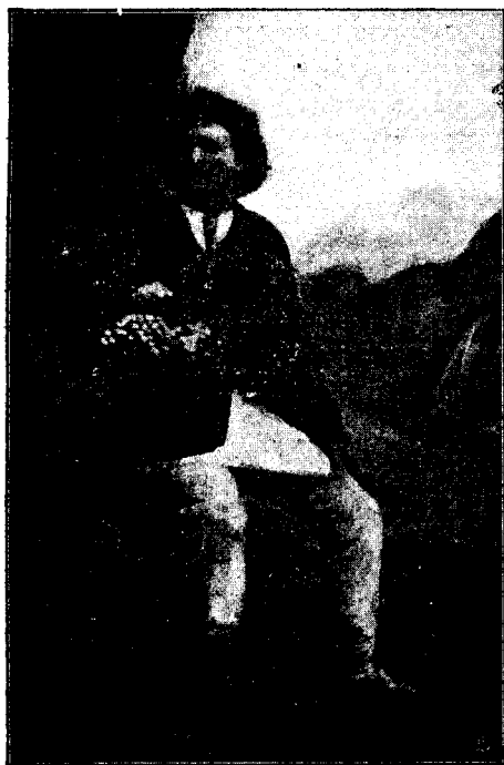
Vanzătorul de struguri.

Dacă ne aruncăm privirea la cele ce se petrec în lupta socială, în viața de toate zilele, vom observa că nu se poate să existe doi oameni, cari să urmă-