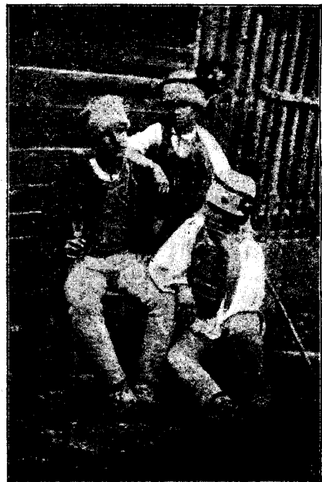
Trei juri din apropierea Sibitului.

— Cochetăria nu e totdeauna o momeală; adeseori e și un scut.