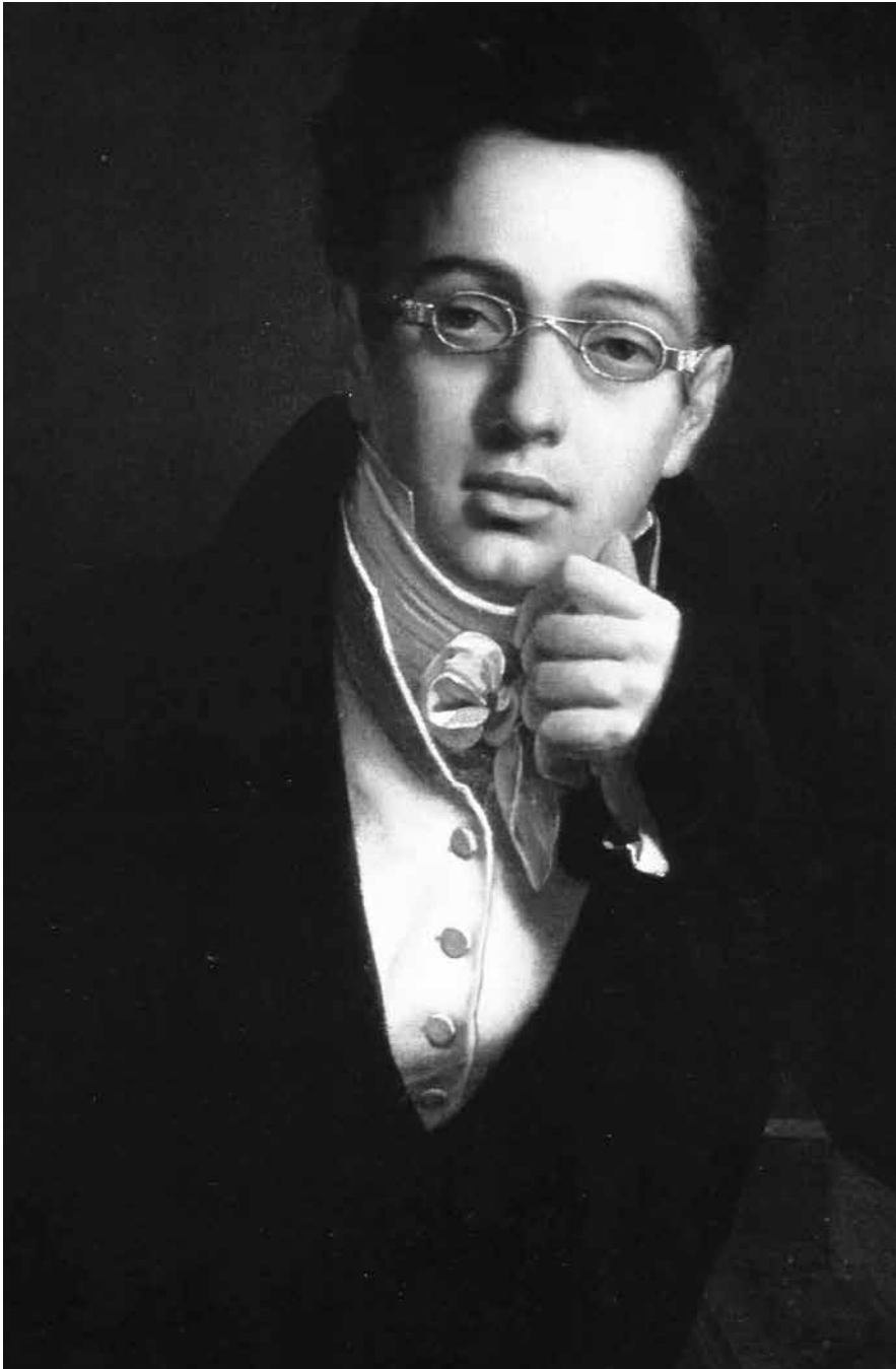
Anoniem portret van de jonge Franz Schubert

derde beweging roept dankzij haar hoge register een zekere kwetsbaarheid op. Deze subtiliteit maakt echter al gauw plaats voor een triomfantelijke slotbeweging, waarin gedurfde texturen en klankkleuren troef zijn.