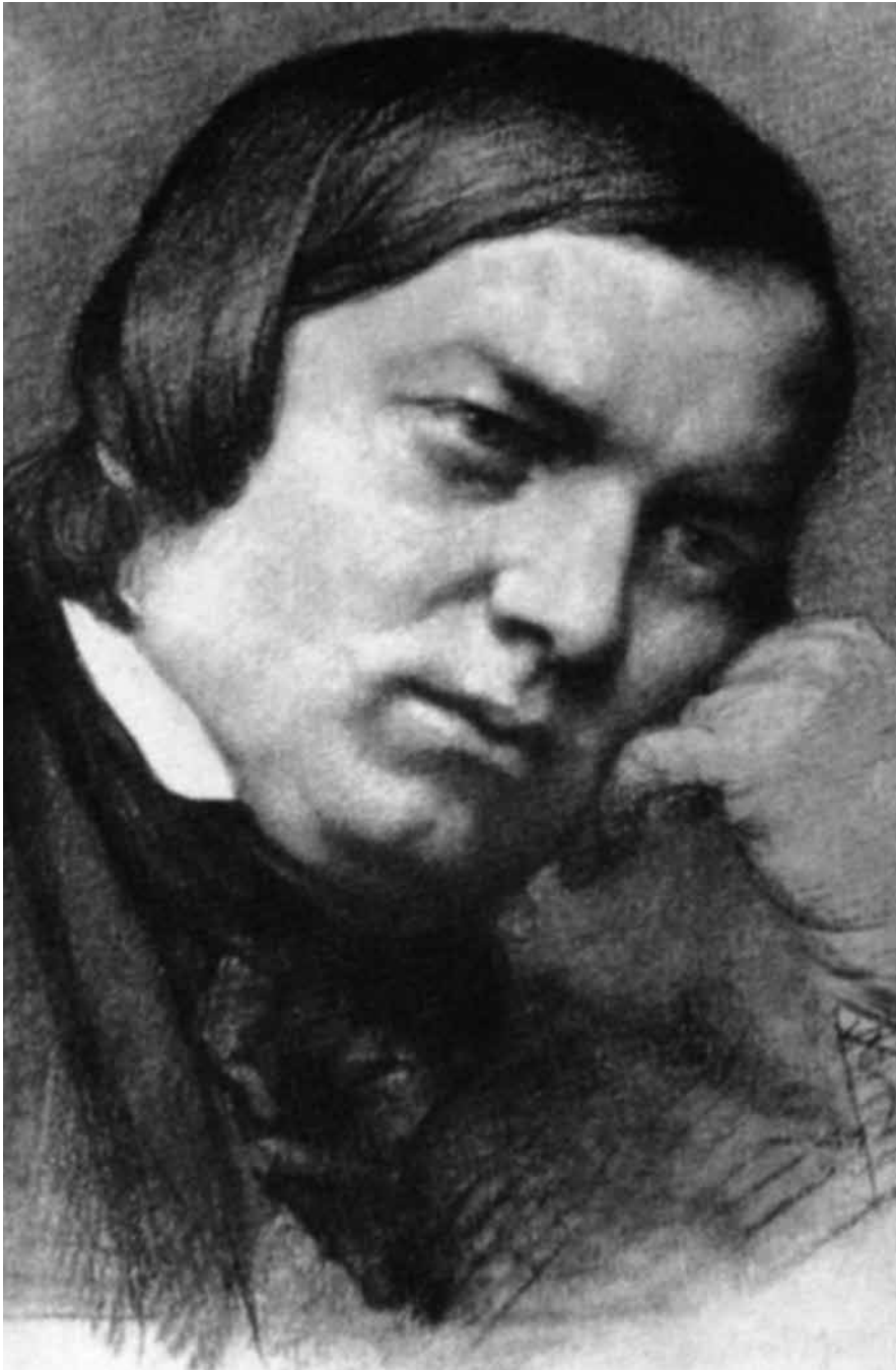
Robert Schumann. Tekening van Eduard Bendemann uit 1859, naar een daguerrotypie van Franz Hanfstängl uit 1850