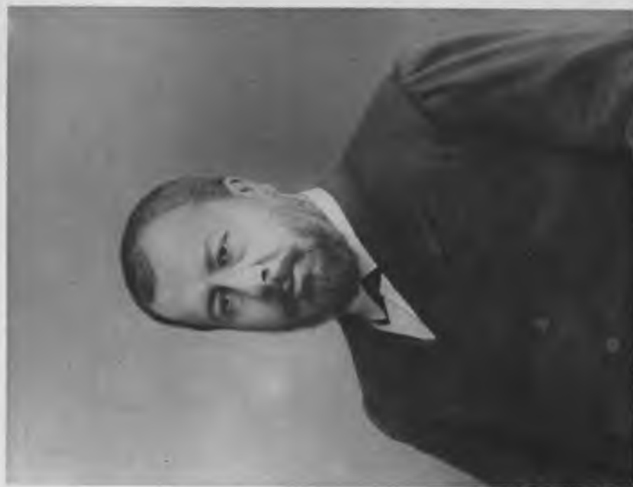
Н. А. Аленьевъ, Городской Голова. + 1893 г.