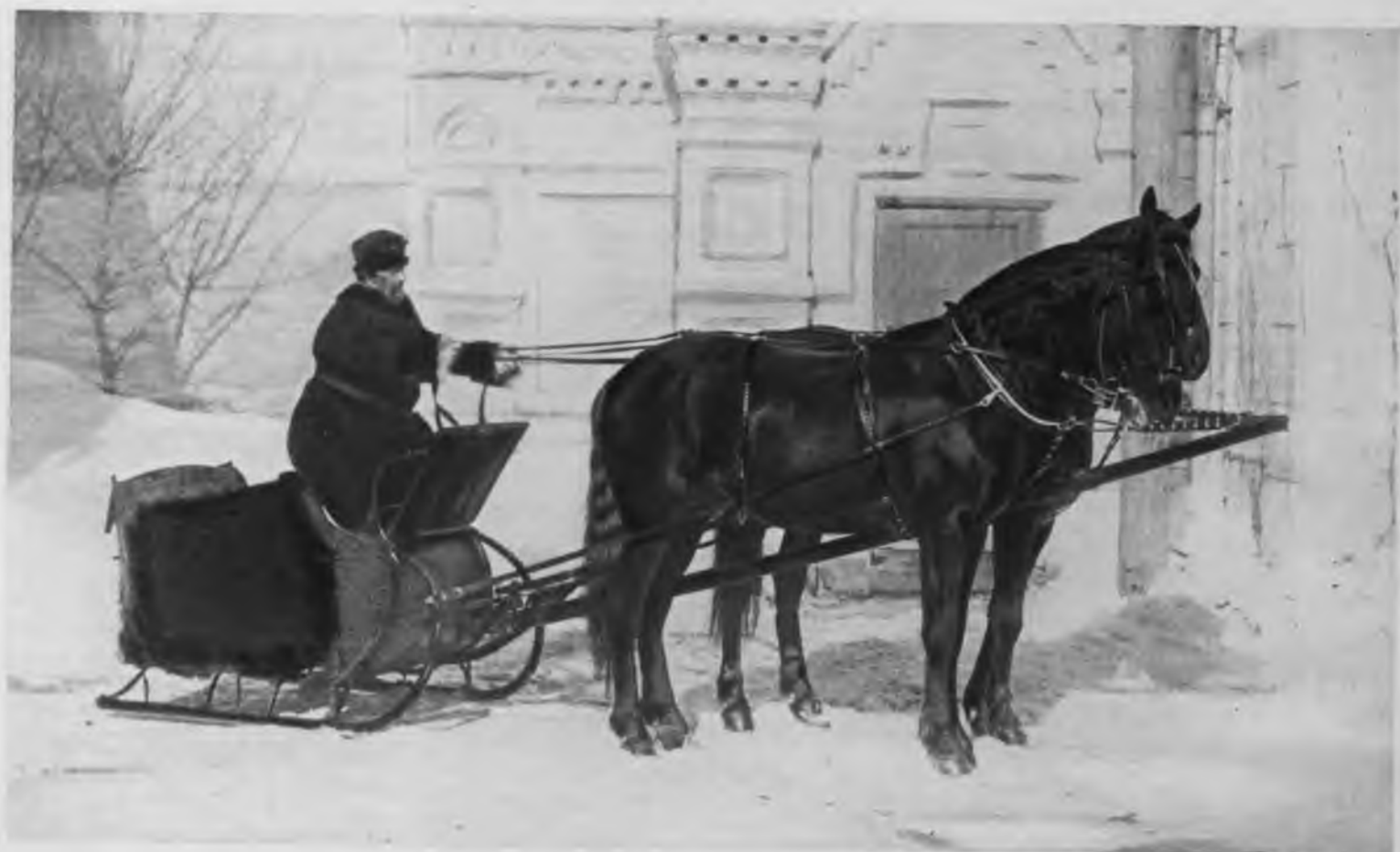
Московский бытъ. Зимній „лихачъ“. Зимняя барская упряжка.