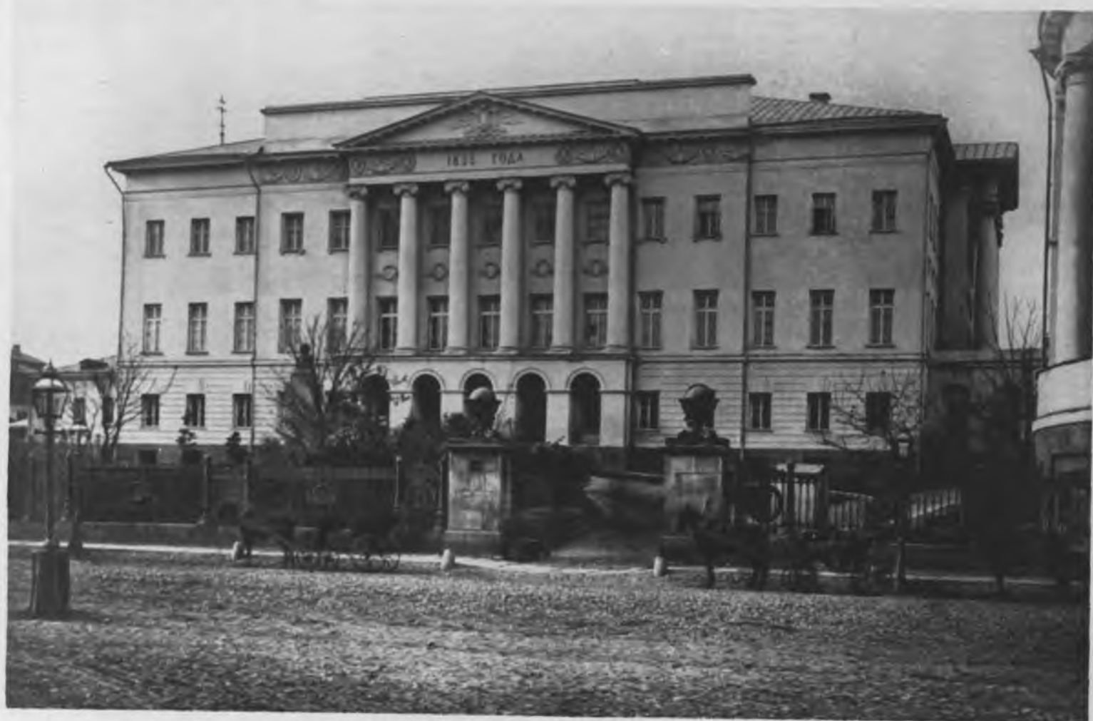
Новое здание Московскаго Университета. (Перестроено).