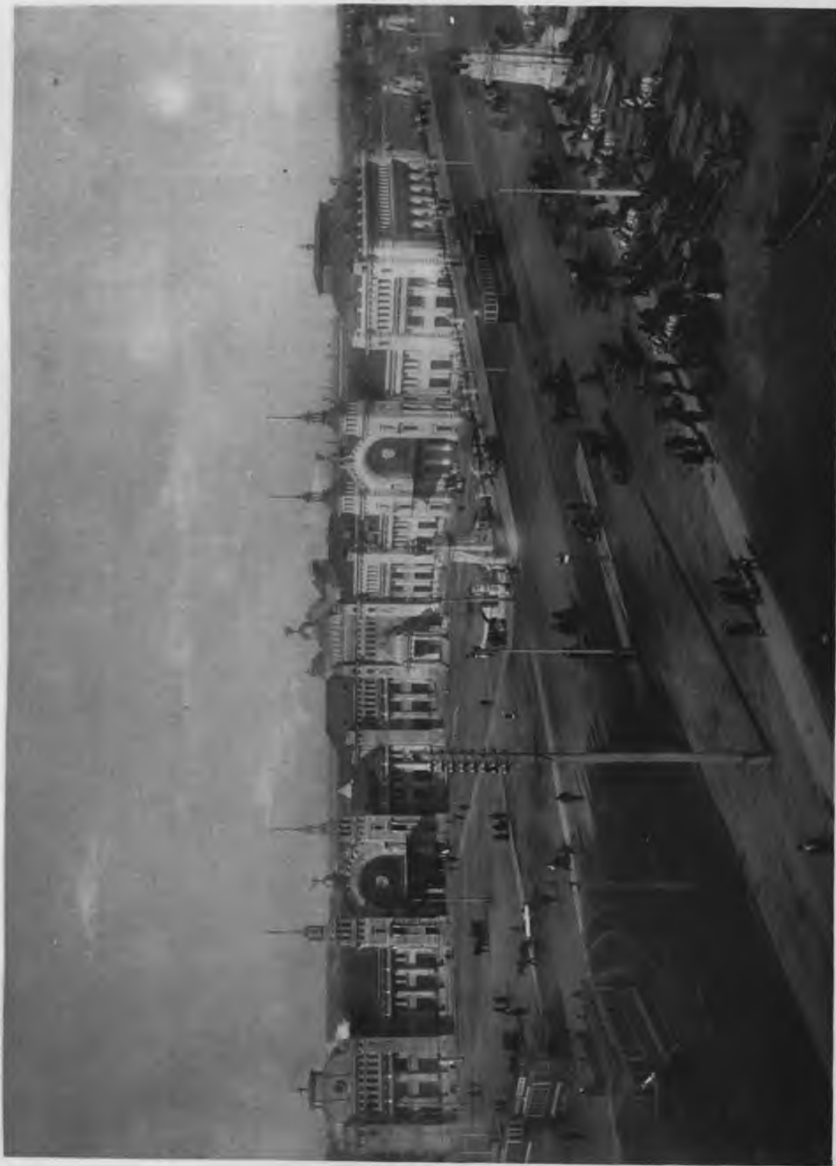
Фото-типо-графура Т-ва „Образованіе“.