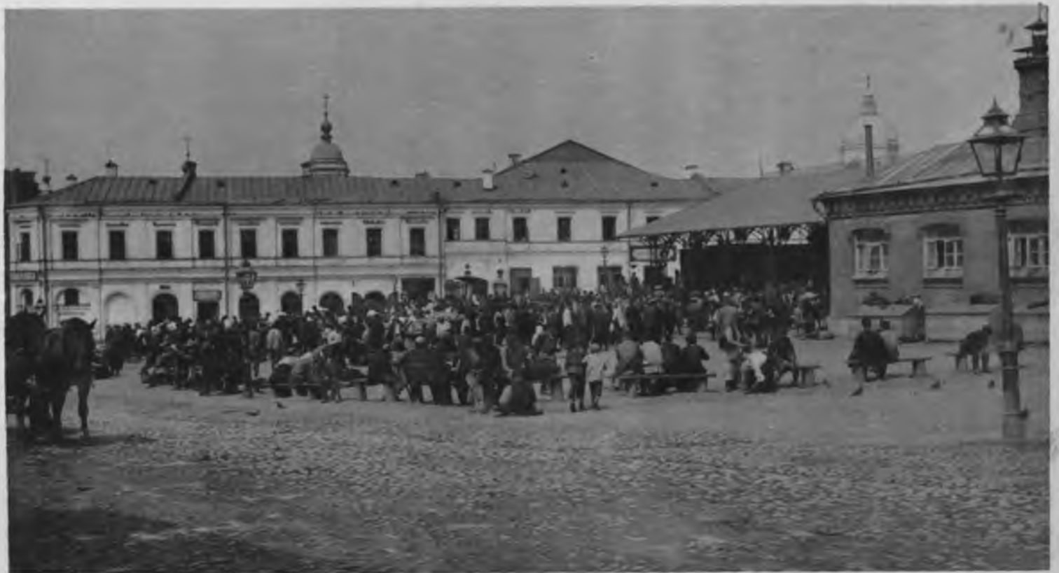
Московская жизнь. Хитровъ рынокъ.