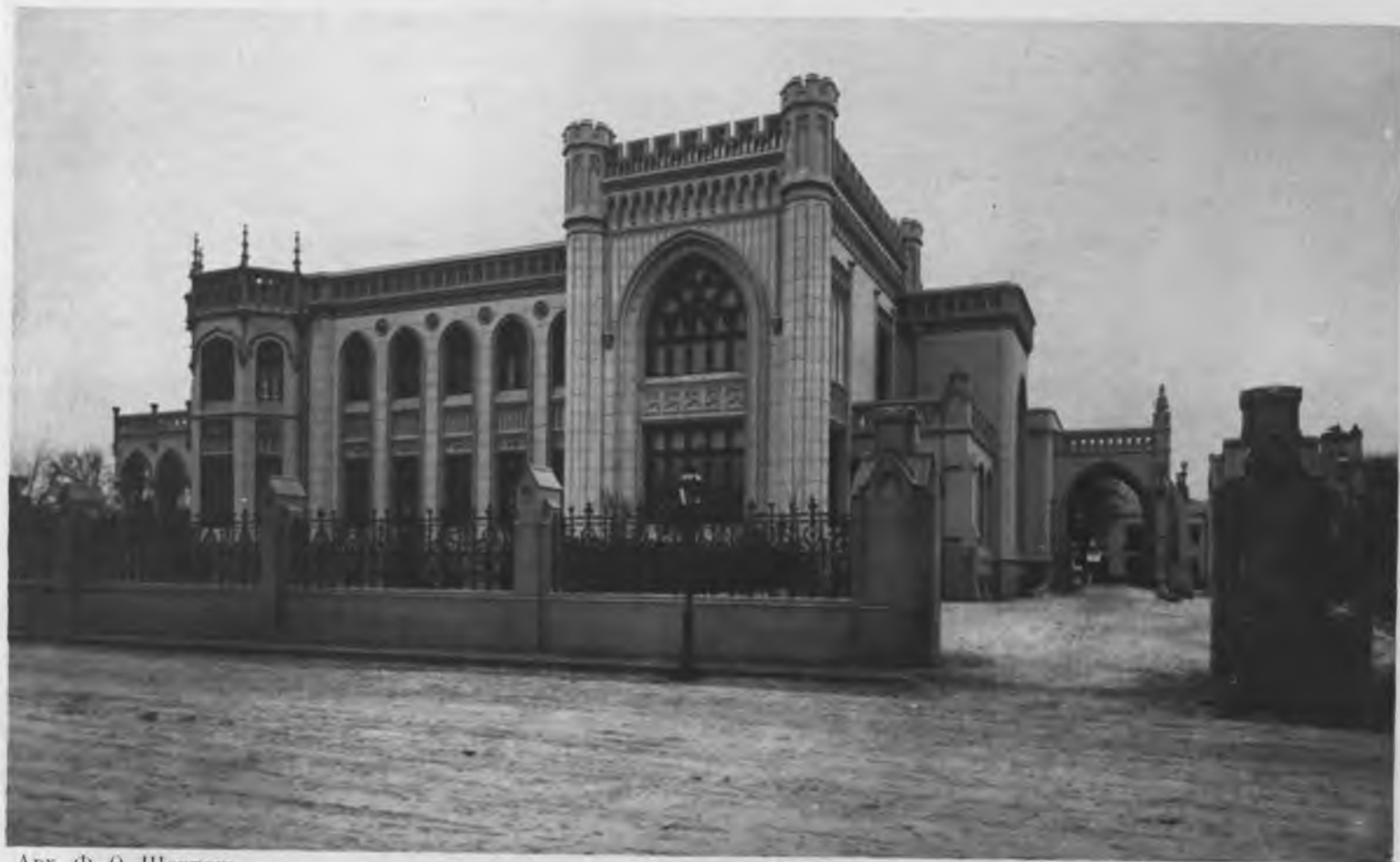
Арх. Ф. О. Шехтель.