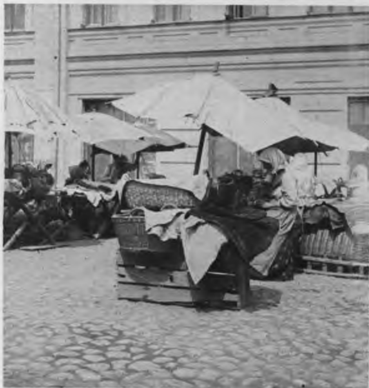
Торговки хлѣбомъ на Смоленскомъ рынкѣ.