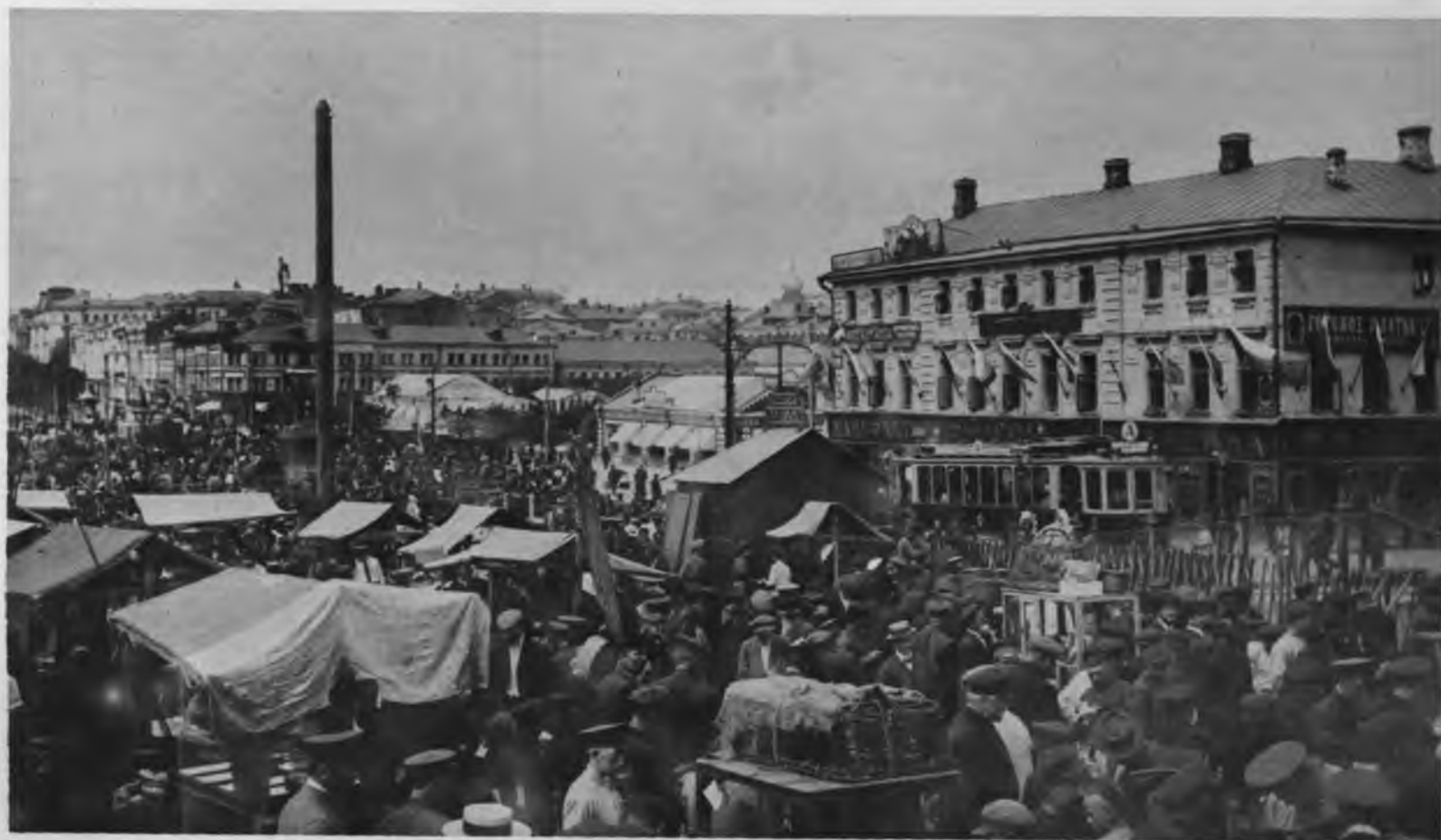
Московская жизнь. Воскресный торгъ на Трубной площади.