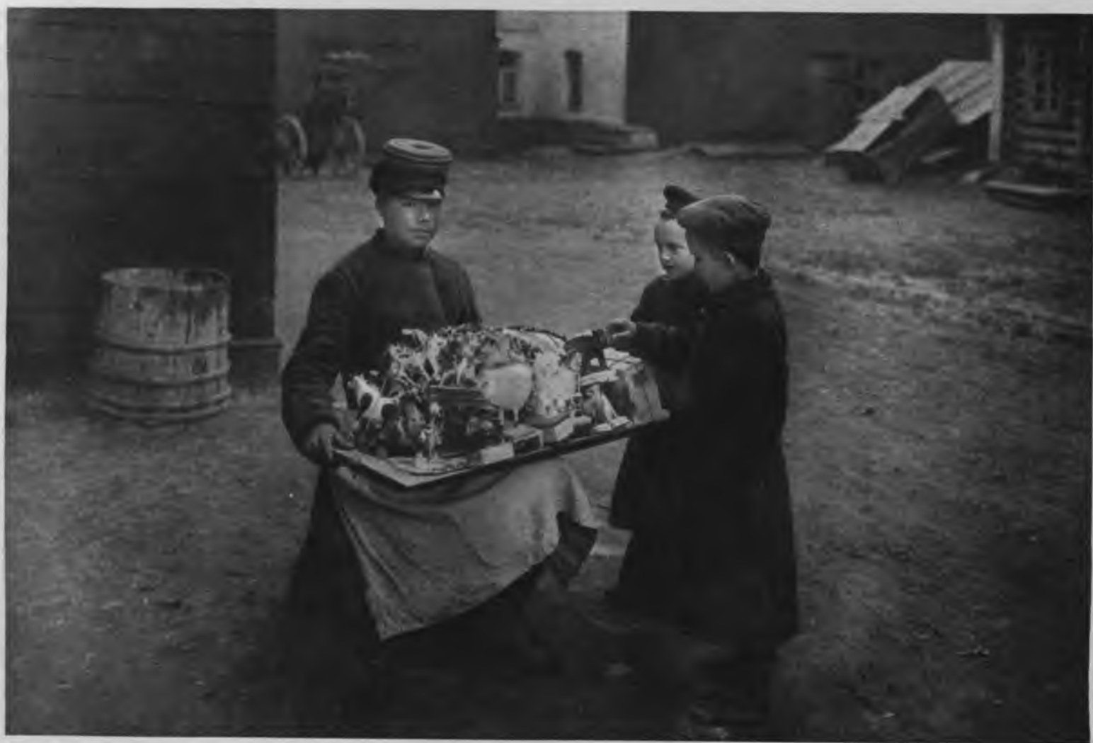
Московскій бытъ. „Ванька“ легковой извозчикъ. Продавецъ игрушекъ.