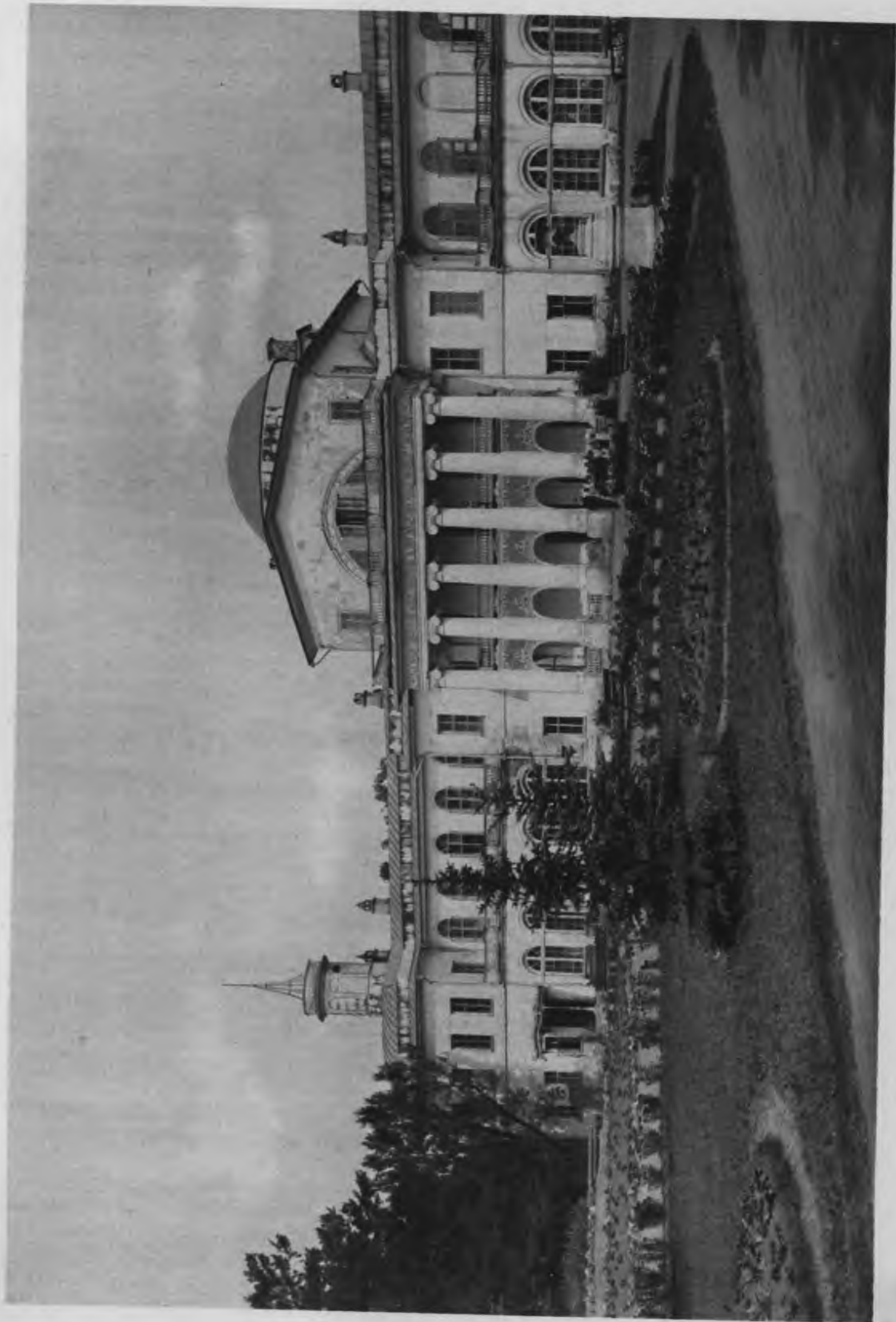
«Мамоновская дача». — бывшее имение гр. Дмитриева-Мамонтова.