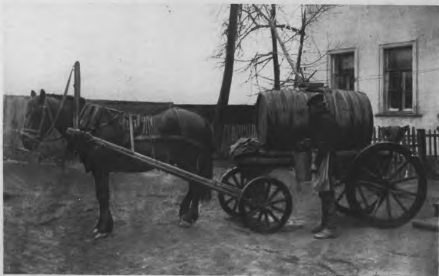
Типы старой Москвы: „водоносъ“ и „водовозъ“.