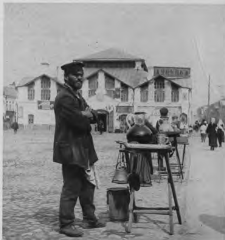
Продавецъ кваса и „дуль“.