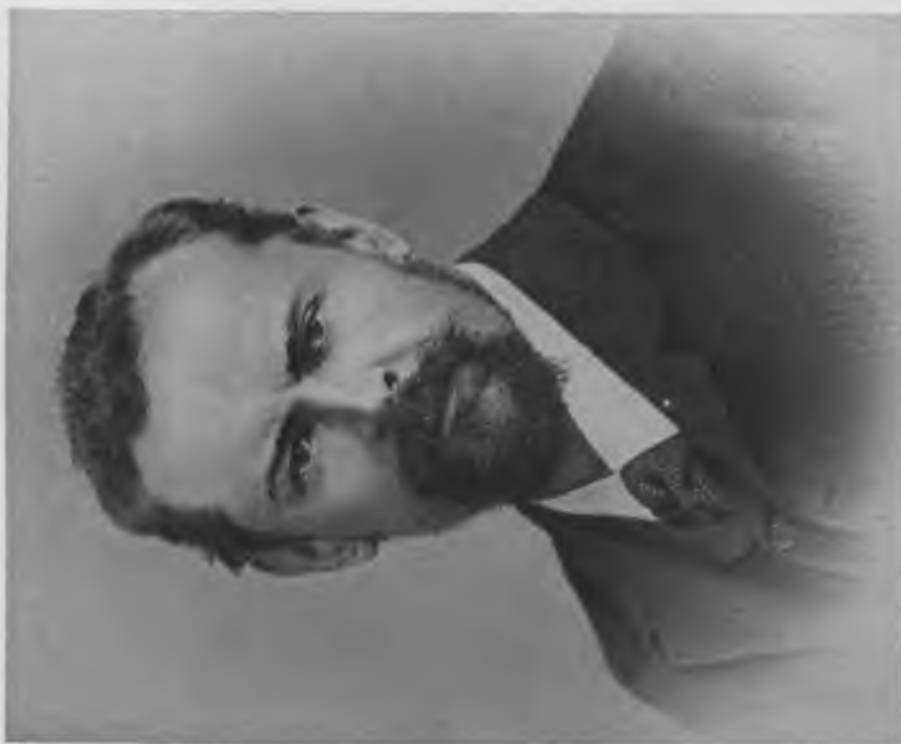
Им. С. Н. Трубецкой. Ректор Московского Университета. + 1905 г.