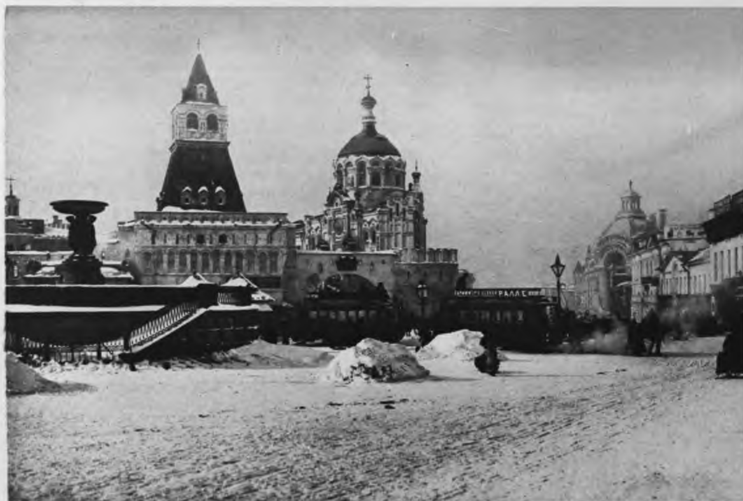
Московский бытъ. Весенний торгъ на Трубнои площади.