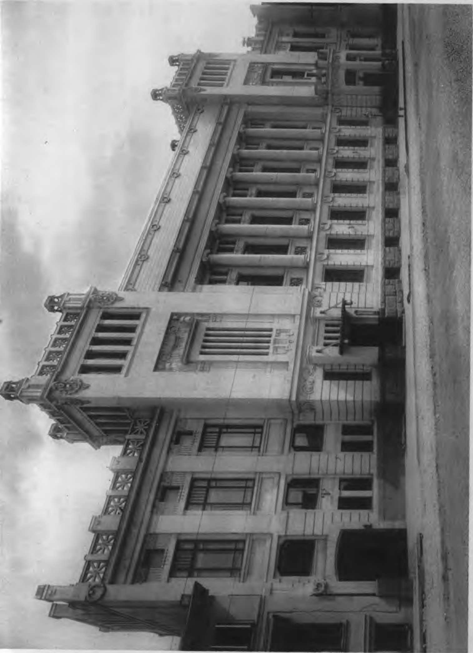
Купеческій клубъ на Малой Дмитровкѣ.