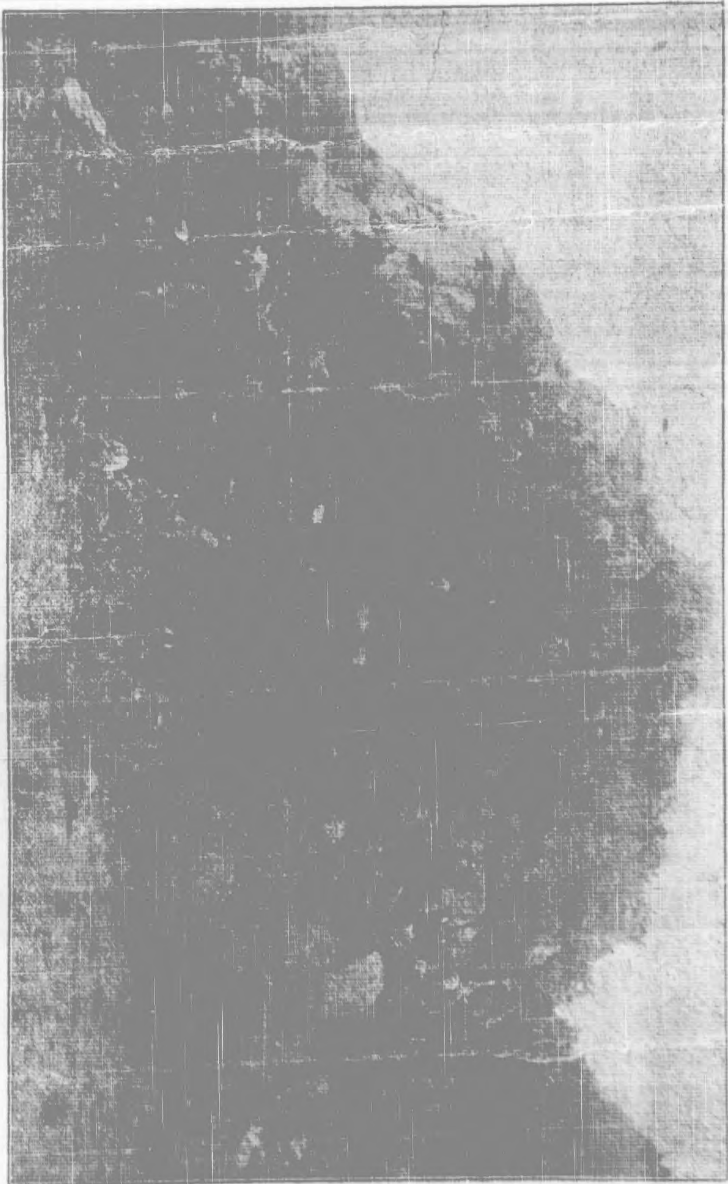
青海回教進會附設第一中學校及附屬各校旅行邦巴之塔雁山

紳老，從中維持，暫假清真寺空房，辦理校務，但阿漢混雜，眉目不清，有時正值禮拜而學生歌謔吵鬧難免阿洪之干涉，有時上堂授課，而阿洪講經議事，易啟教員之厭惡，雙方滋擾，易生糾紛。且當時大多數程