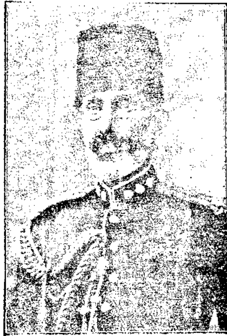
汗爾德那王漢富阿之刺被

，並獲英俄兩國之承認。那德爾汗於去年頒布憲法，宣布阿富汗完全獨立。並以回教為國教，法律習慣，一仍回教體制。那德爾汗勵精圖治，解放奴隸，實行強迫勞動，強迫國民教育，並組織國民會議，襄助一切政務，此外，並成立十萬精壯之優良陸