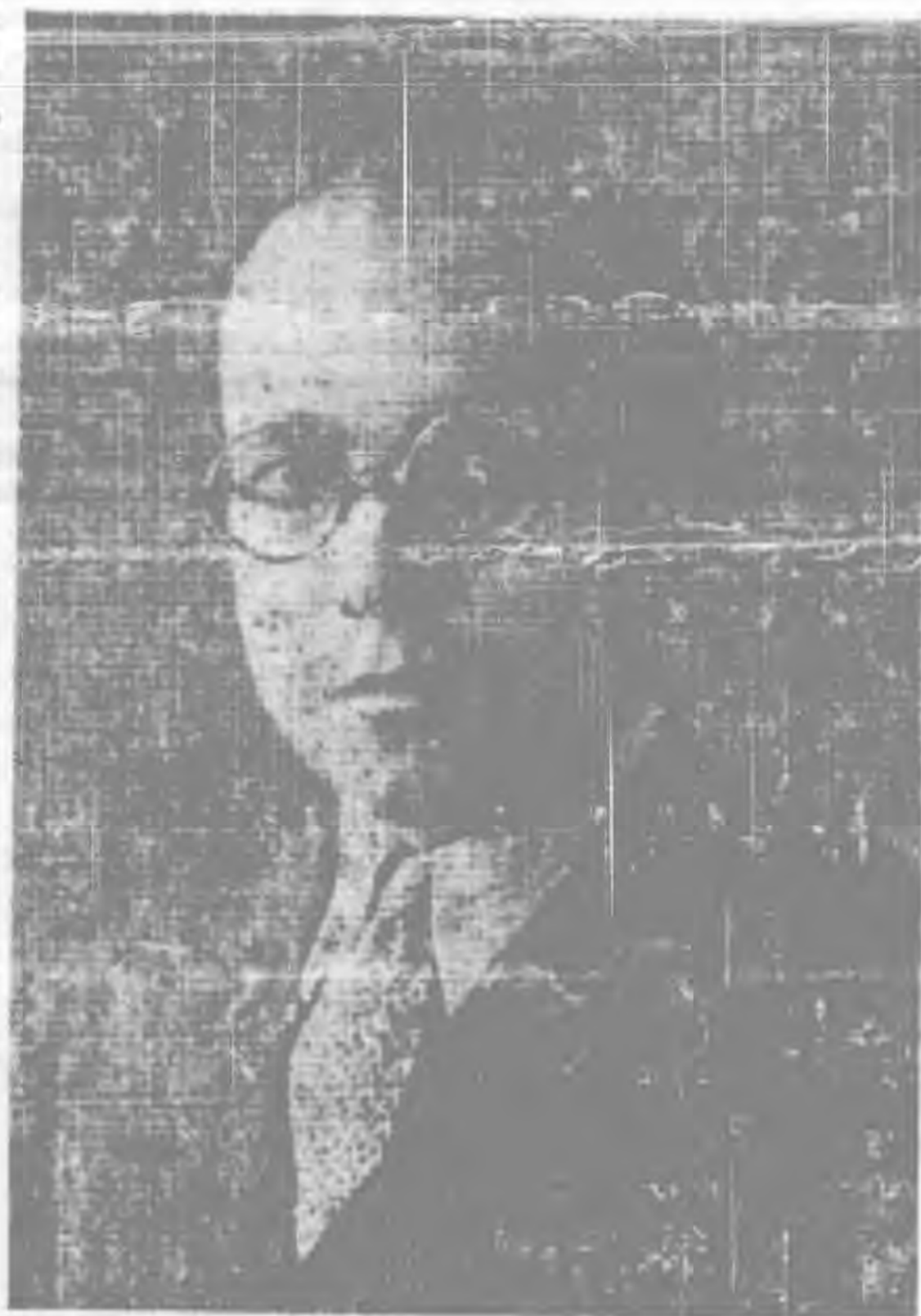
埃學及生愛部資部哈爾沙爾大誠學中先國生

觀雲南明德中學後。對我談了許多教育問題。因為他遊歷過全世界。故他把全世界回教教育狀況對我談得很透徹。結果下來他還是贊成愛資哈爾大學的教育。他便把雲南回教教育狀況。介紹到愛資哈爾大學。謬蒙愛大當局即覆函褒許。我們自知缺點很多。故不敢當。於是我們用函要求愛大。容納中國學生。雖然經了幾次通信。但未蒙明白表示學生津