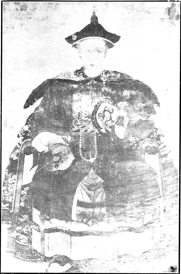
清翰林院檢討楊公秀遺像