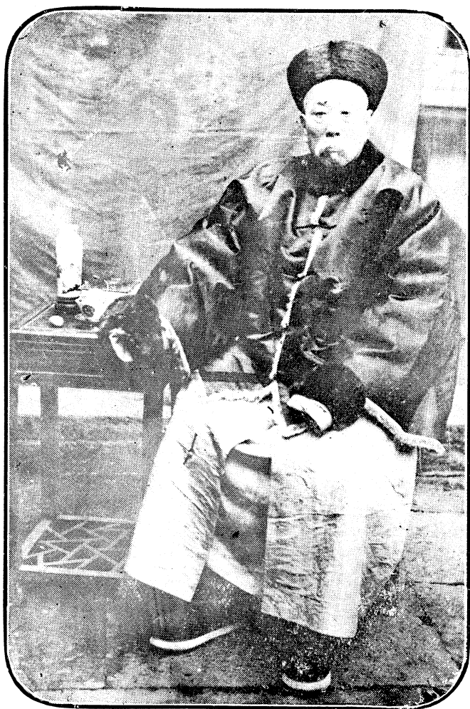
清署蘇州府知府楊靖公遺像