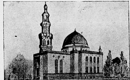
Inggris bikin propaganda, bahoea Nippon aken meroesak oem-met Islam di India! Tapi liatlah gambarnya ini mesdjid baroe di iboe kota Keradjaan Nippon (Tokio). Pemboekan ofisial ini mesdjid dihadiri oleh wa kil 2 oemmet Islam seleroeh Asia, diantaranya dari Indonesia.