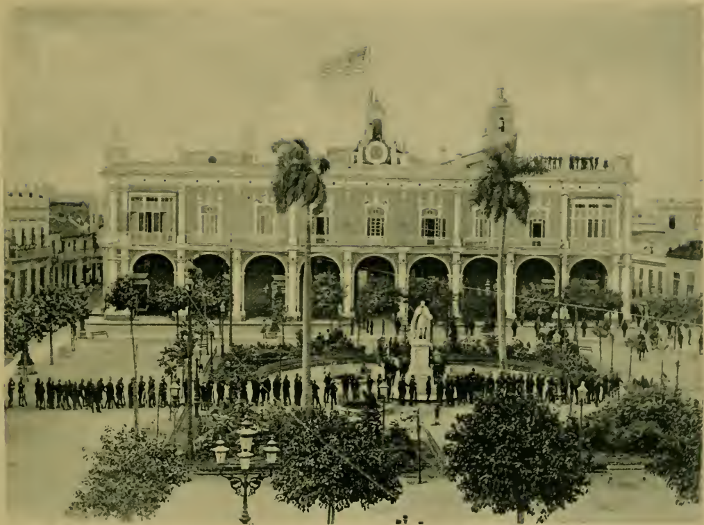
Plaza de Armas y Palacio General. Arms Square and Palace.