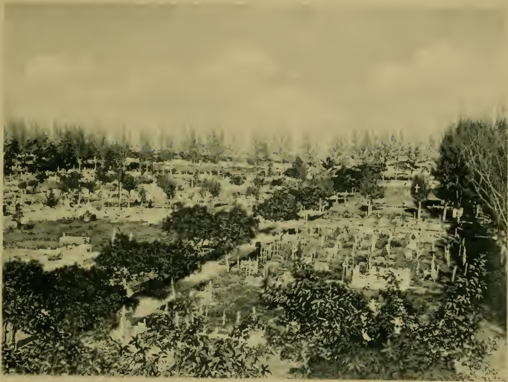
Cementerio de Colon. Colon Cemetery, where the "Maine" victims are buried.