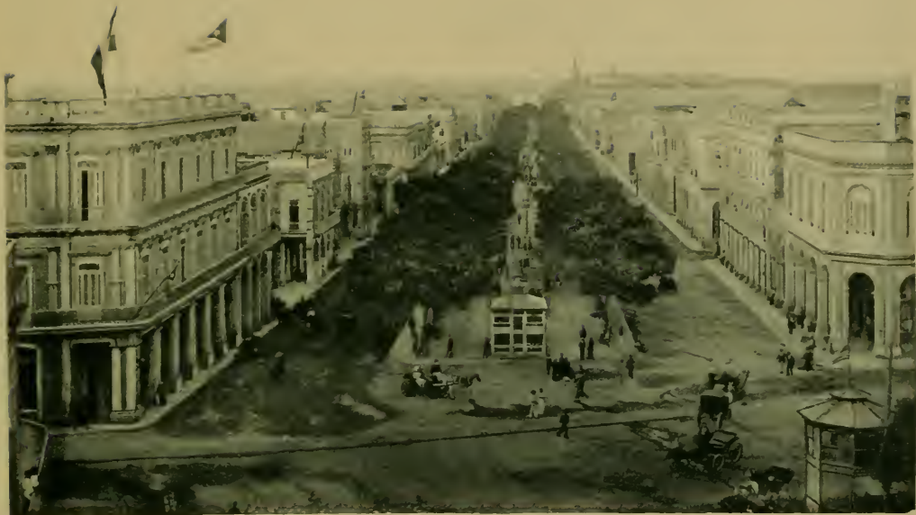
Vista del Prado. The Prado.