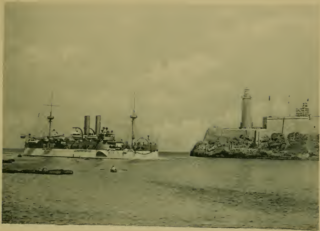
El "Maine" entrando por el Morro en Enero 27 de 1898. The "Maine" entering Havana Harbor, January 27, 1898.