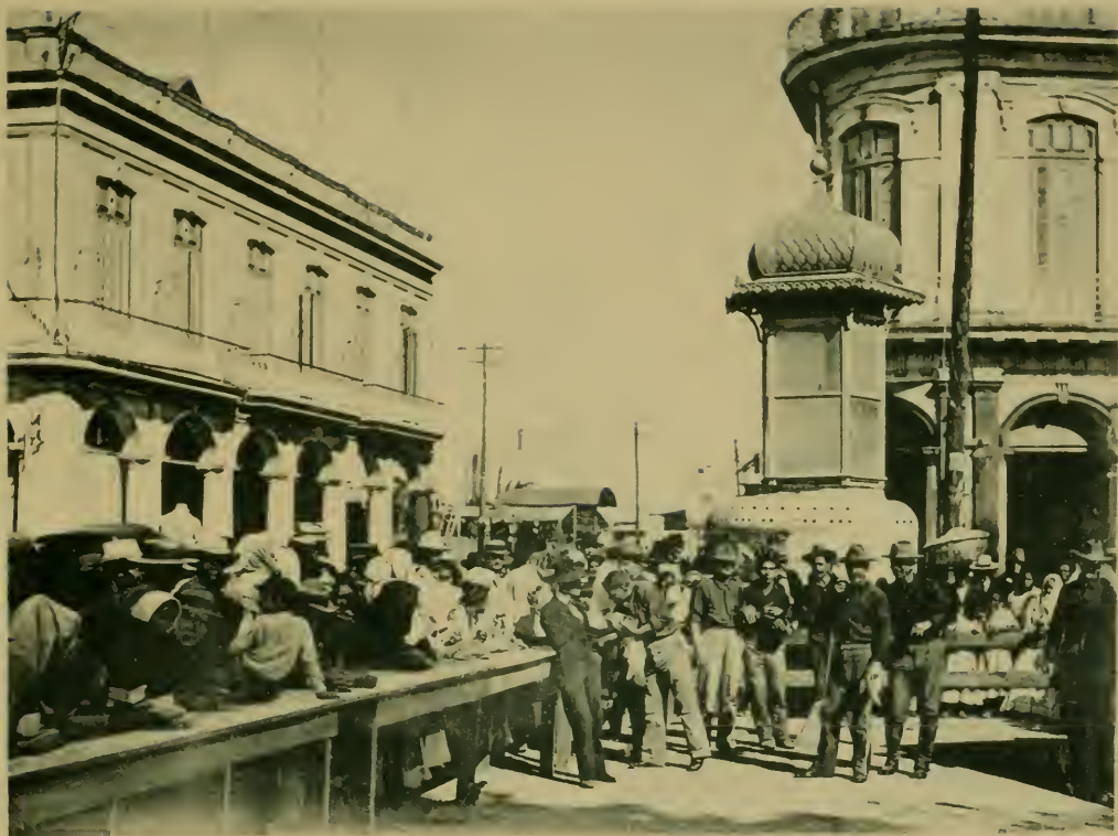
10a Estacion de Auxilio. 10th U. S. Relief Station.