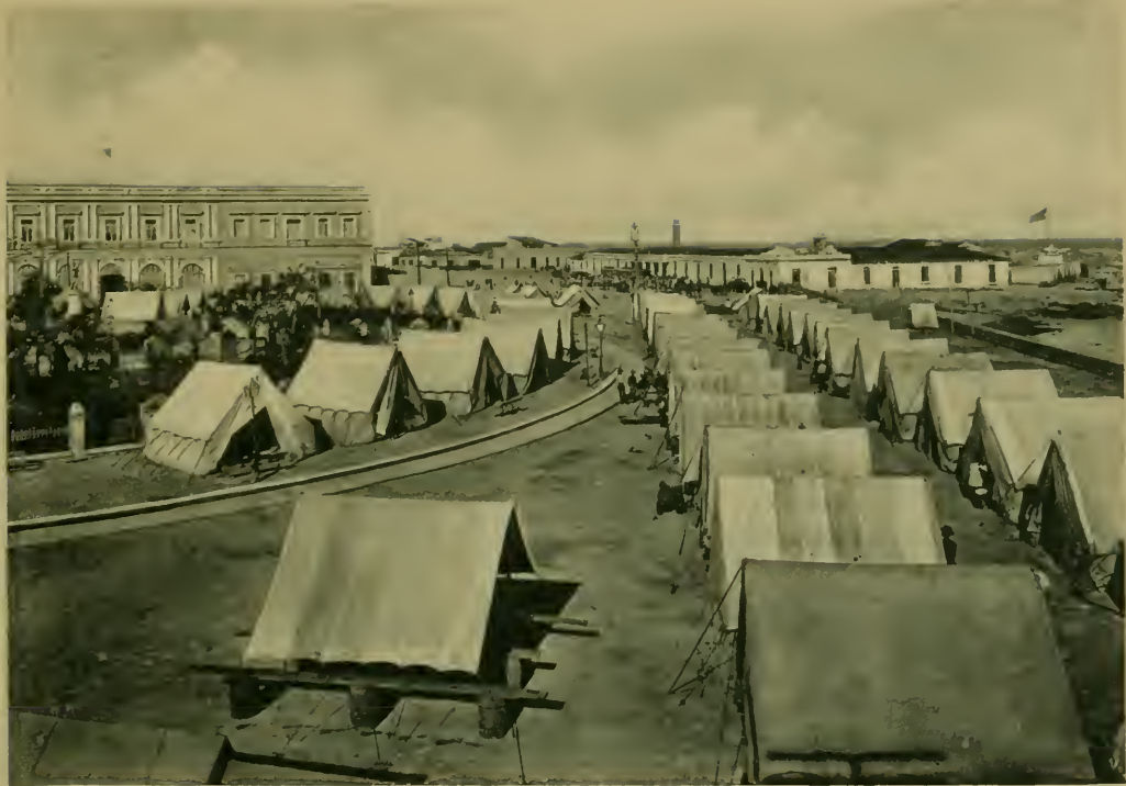
Plaza y Castillo de la Punta. Plaza and Fort La Punta.