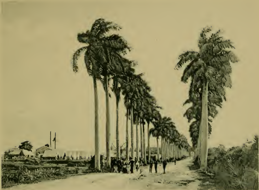
Palmas—Calzada de Palatino. Palm Avenue leading to Las Delicias.