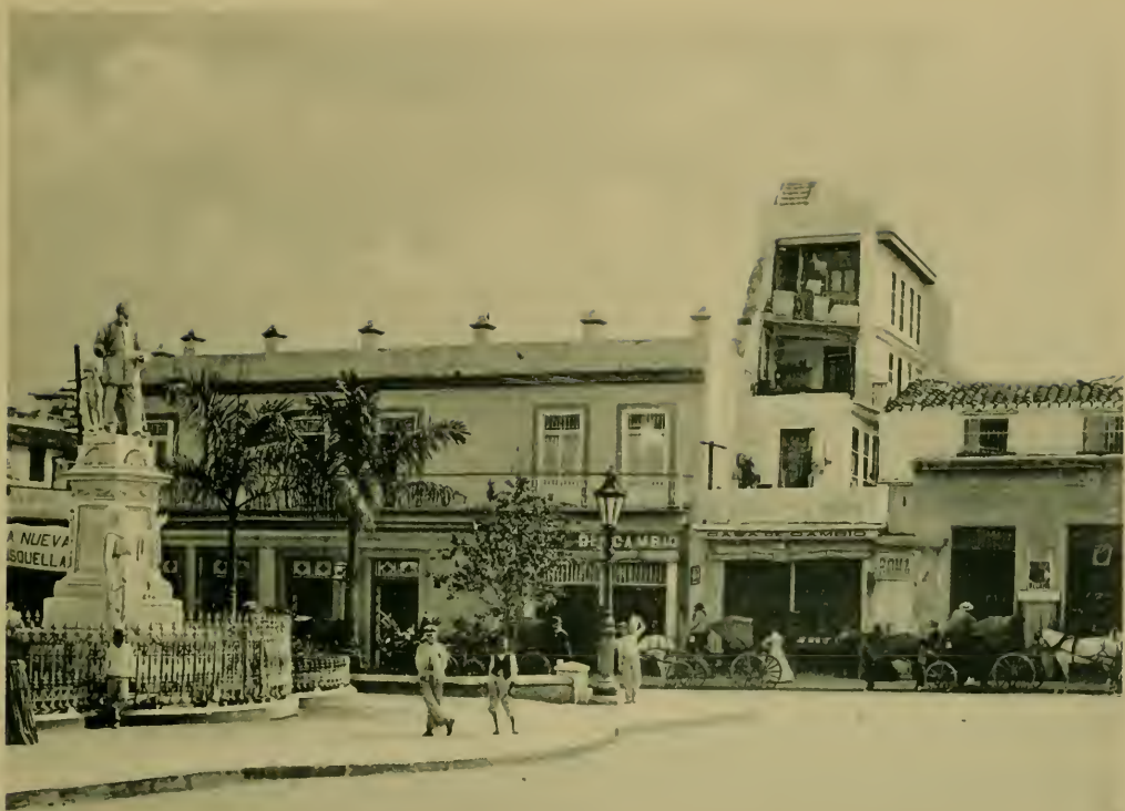
Estatua de F. Albear y Lara-Entrada á la Calle Obispo. Statue of General Albear and Entrance to Obispo Street.