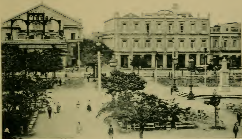
Parque Central—Viendo el Teatro de Tacon y Hotel de Inglaterra. Central Park—View toward Tacon Theatre and Hotel Inglaterra