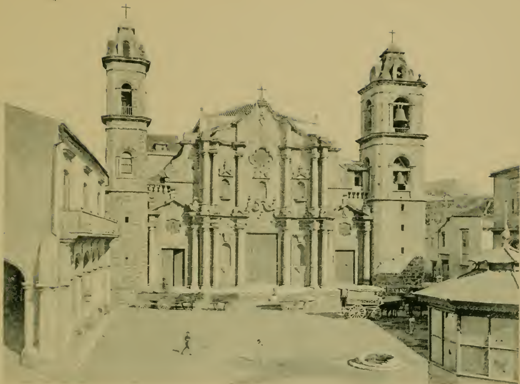
La Catedral. The Cathedral.