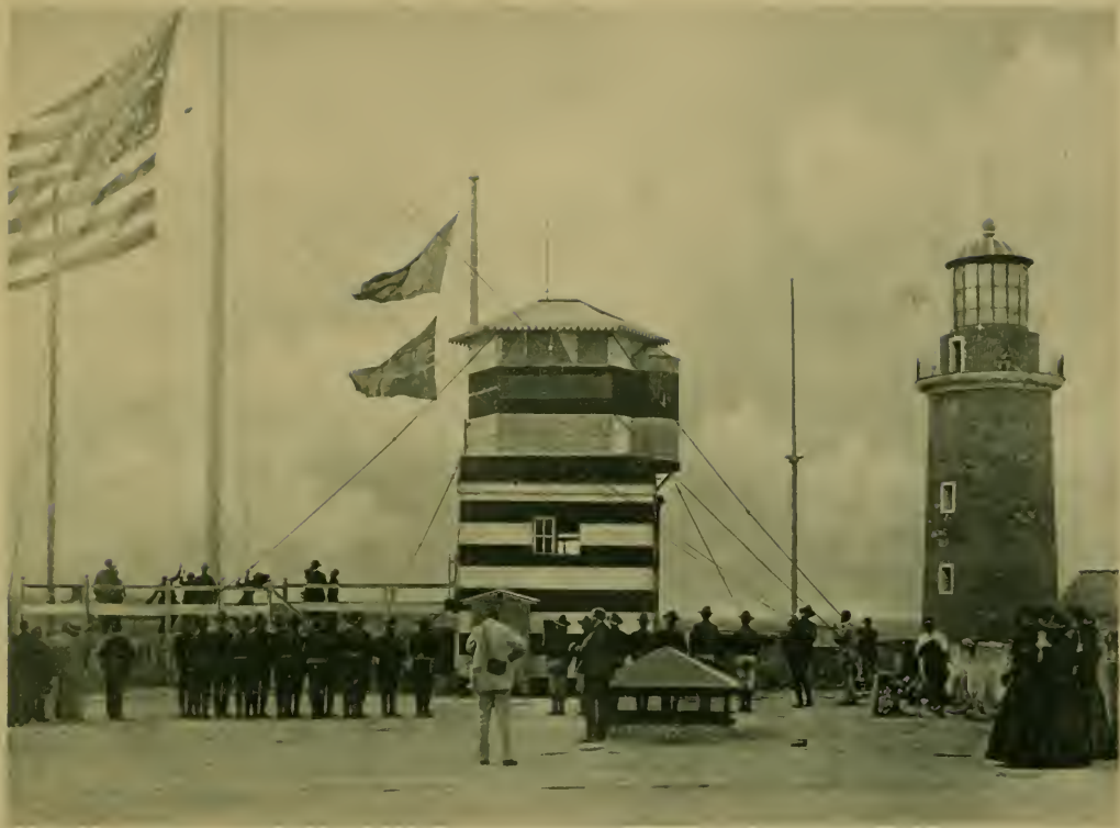
Subida de la bandera Americana—Castillo del Morro. en Enero 1 de 1899. Hoisting the American Flag at Morro Castle, January 1, 1899.