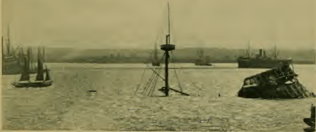
Restos del "Maine." Wreck of the "Maine" in Havana Harbor.