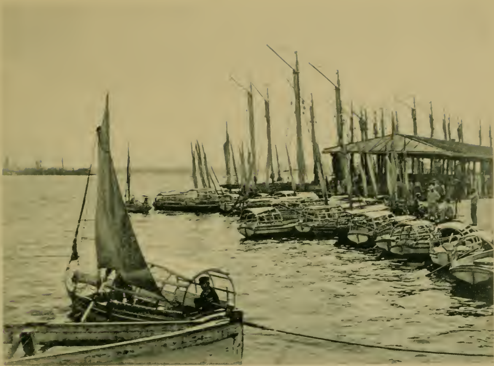
La Machina. Boat Landing.