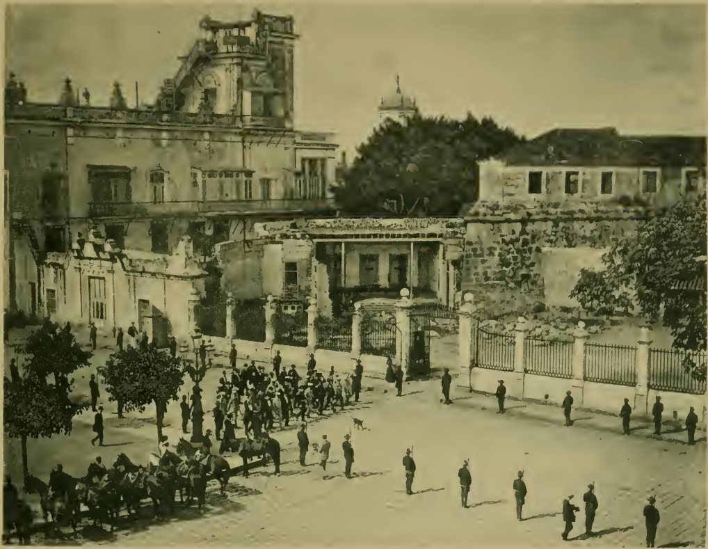
Cuartel de la Fuerza—Embarque de General F. Castellanos. Departure of General F. Castellanos from Havana.