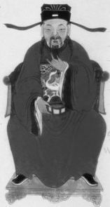
宋翰林院學士武公像