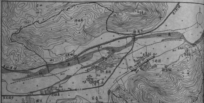
卓岐下岐坦两村区域图