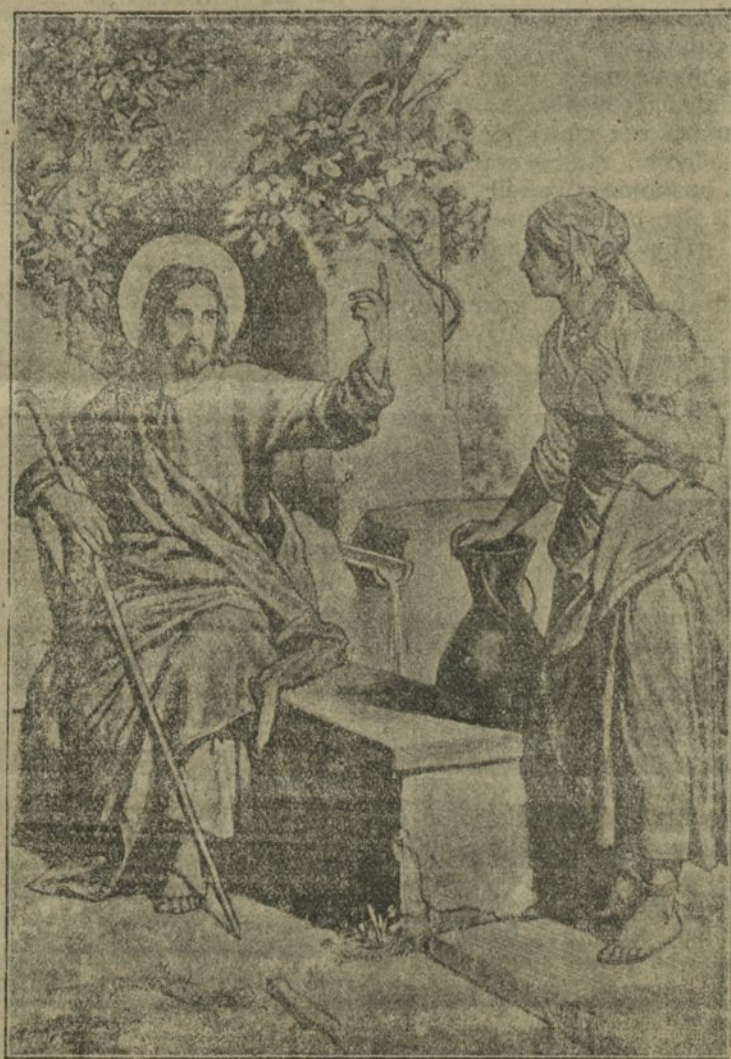
Розмова Хрыста з самаранкаю.

Быў самы паўдзён. Прытамлены доўгім пераходам, Госпад Спасіцель сеў адпачнуць ля глыбокай самаранскай студні. Вучні пашлі ў горад кіпіць перакускі. Каля студні няма ані вядра, ані вяроўкі, так што дастаць вады —