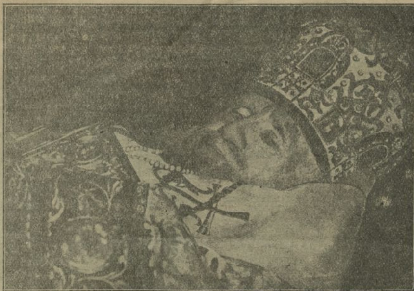
Свяцейшы Патрыярх Ціхан у гробе.