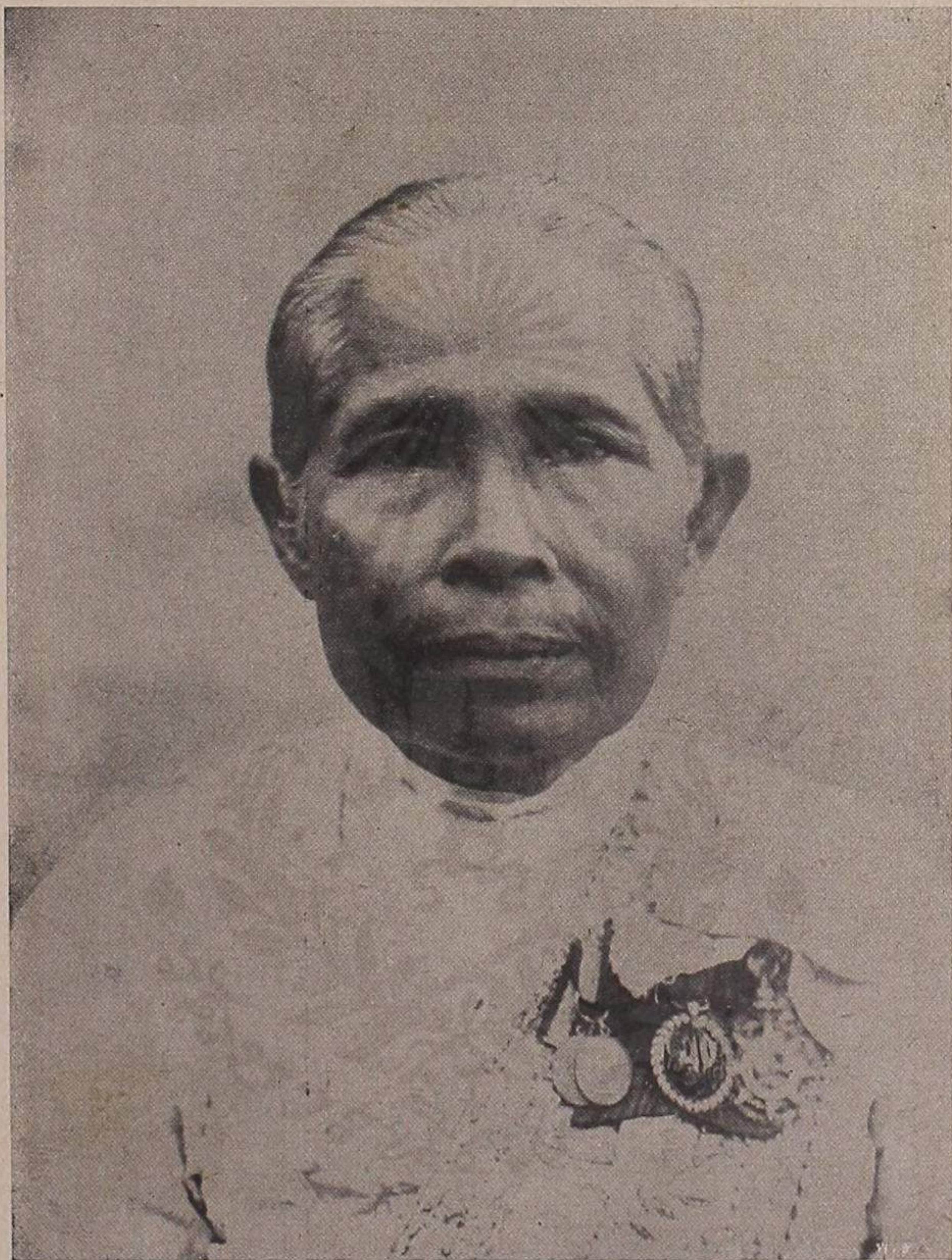
ท้าวสมศักดิ์ (เจ้าจอมมารดาเหม รัชกาลที่ ๔) ท จ ว.