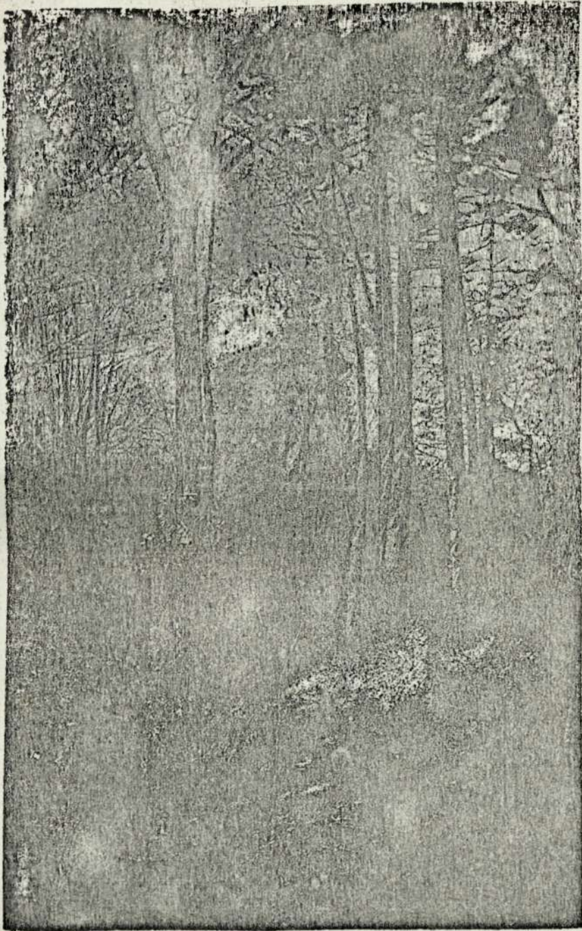
Natur'a — in renascere.