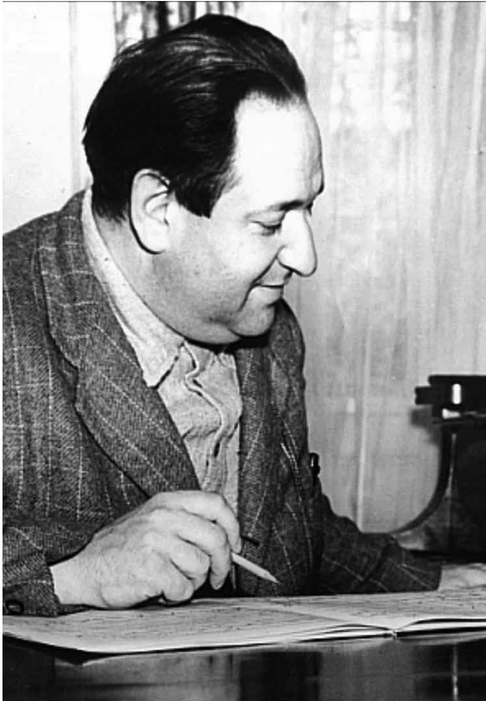
Erich Wolfgang Korngold