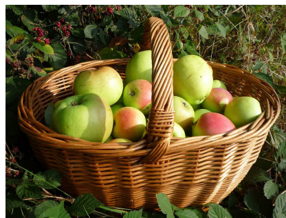
Der Apfelkorb H

DEFINITION 18.6. Unter der Negation auf der Menge der ganzen Zahl \mathbb{Z} versteht man die Abbildung -: \mathbb{Z} \rightarrow \mathbb{Z} , die durch