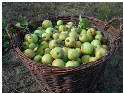
Der Apfelkorb G

BEMERKUNG 18.5. Welche Objekte bzw. Strukturen kann man mit den ganzen Zahlen zählen? Es gibt keine Mengen mit negativ vielen Elementen! Dennoch gibt es viele Situationen, wo man mit ganzen Zahlen sinnvoll zählen kann. Sobald es einen ( gerichteten ) Prozess zusammen mit einem zugehörigen gegenläufigen Prozess gibt, wie etwa einen Schritt nach rechts bzw. einen Schritt nach links zu machen, oder wenn man zwei sehr große Haufen (oder Körbe) an Äpfeln hat, und der Prozess ist, einen Apfel von dem einen Haufen zu dem anderen Haufen zu transportieren (mit dem umgekehrten Transport als dem gegenläufigen Prozess), so kann man die möglichen (hintereinander ausgeführten) Prozesse durch die ganzen Zahlen beschreiben: 7 (oder deutlicher +7) bedeutet 7 Äpfel von Haufen G nach Haufen H übertragen, -3 bedeutet drei Äpfel von Haufen H nach Haufen G übertragen. Hierbei muss man willkürlich festlegen, welche Prozessrichtung man als positiv ansehen möchte. Auch in der Hauswirtschaft werden die Einnahmen positiv und die Ausgaben negativ verbucht. Damit zusammenhängend werden negative Zahlen häufig als Schulden und positive Zahlen als Guthaben interpretiert.