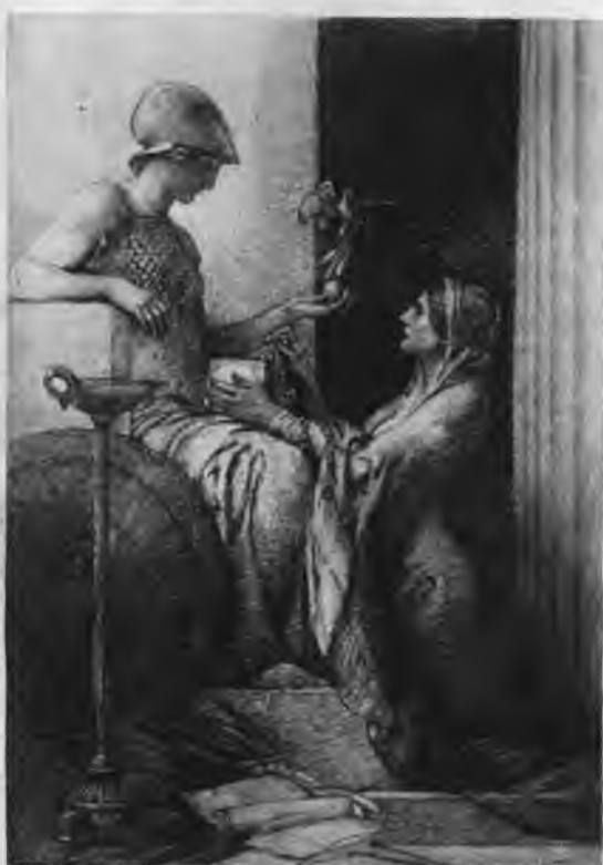
LELAND • STANFORD • JUNIOR • UNIVERSITY