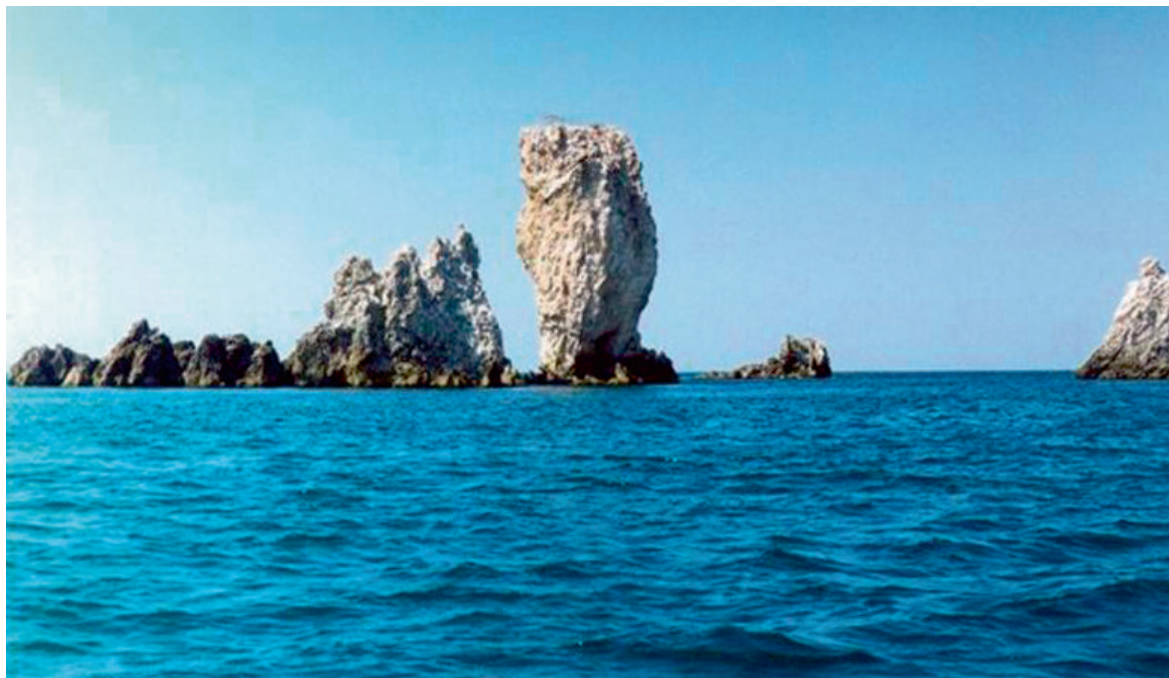
Скелі-Кораблі, або Елькен-Кая, розташовані за 4 км від мису Опук

Опук – це не лише унікальна природа, але й археологічна пам'ятка. Тут розташовувалося древнє місто Кіммерик (VI-IV століття до нашої ери), руїни якого (цитадель, десятки колодязів, залишки стін) були знайдені на території заповідника.