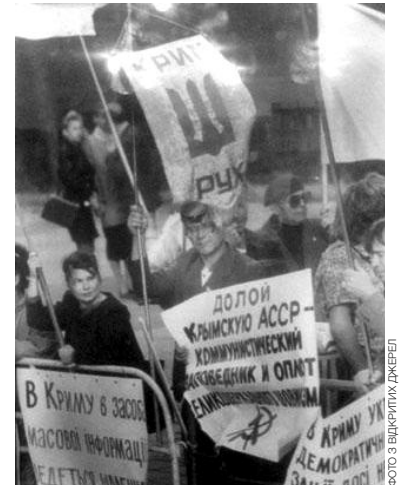
Мітинг Народного Руху України. Сімферополь, 1990 р.

У жовтні під гаслом «Крим – Україна – Європа» за сприяння комітету «Крим з Україною» — «Соборність» та Кримської організації УРП у приміщенні Кримського академічного українського музичного театру в Сімферополі відбувся I Всекримський конгрес українців, у роботі якого взяли участь більш ніж тисяча делегатів і який проголосив головною метою збереження статусу Криму як невід'ємної складової частини України. Захід став помітною подією в житті українців півострова. Перед конгресом задля призупинення його підготовки по кримському радіо виступив тогочасний голова Вер-