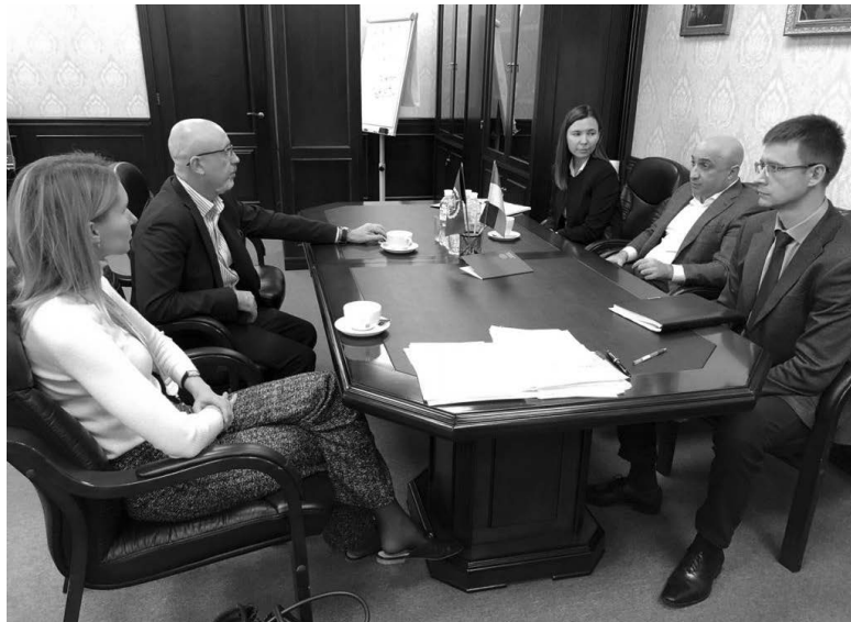
Заступник Генерального прокурора України Гюндуз Мамедов та віцепрем'єр-міністр України – міністр з питань реінтеграції тимчасово окупованих територій Олексій Резніков під час робочої зустрічі.

– заборона призову мешканців окупованої території до збройних сил держави-окупанта (протягом 2014–2020 рр. незаконно відбулося 11 призовних кампаній в окупованому Криму, а кількість українців, яких призвали до лав