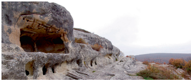
Залишки середньовічного міста-фортеці Ескі-Кермен, одного з об'єктів культурної спадщини на території окупованого Кримського півострова, що входить до Попереднього списку всесвітньої спадщини ЮНЕСКО.