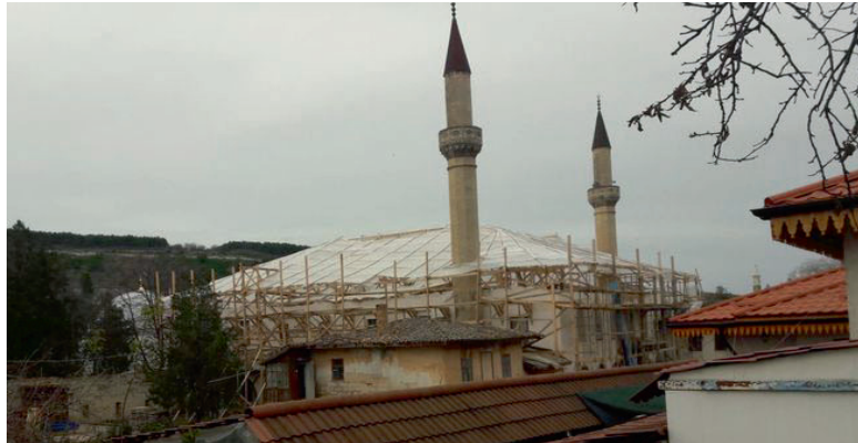
Так звана «реставрація» Ханського палацу у Бахчисараї, одного з об'єктів культурної спадщини на території окупованого Кримського півострова, що входить до Попереднього списку всесвітньої спадщини ЮНЕСКО.