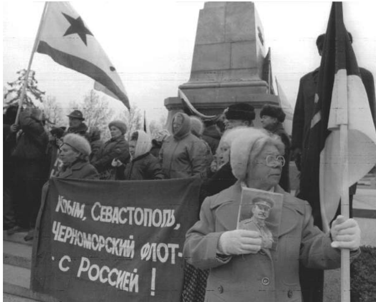
Крим у 1990-ті...

1 грудня 1991 р. під час загальнонаціонального референдуму про Незалежність України 54% мешканців АР Крим проголосували «за»; в Севастополі цей показник склав 57% мешканців міста. Народження незалежної держави стало неабияким стимулом для діяльності українських національно-культурних організацій, що проголошували фактичну приналежність Криму до України. Проте вони наражалися на реакцію низки організацій, що агітували за вихід півострова зі складу України та його приєднання до РФ: найпотужнішою з них було «Республіканское движение Крыма» (РДК). Проросійські активісти лякали місцеве (переважно російськомовне) населен-