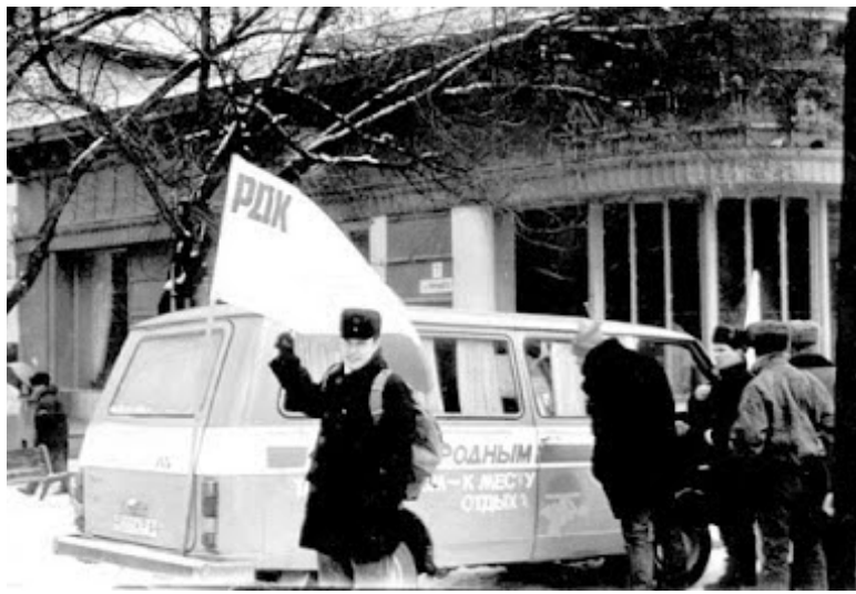
Активісти ДСУ біля агітаційного автобуса РДК («Республіканское движение Крыма»), що агітувало за повний вихід зі складу України. 1990-ті роки

Парадоксальність ситуації полягала в тому, що представники національно-демократичних сил, відстоюючи непорушну єдність Криму з Україною, були змушені йти на створення регіональної партії, підкоряючись кримському закону, щоб не опинитися поза виборчою кампанією. Розгорнута у Криму кампанія виборів власного президента потребувала серйозної рішучої протидії, яка була б можливою лише за наявності дієвої політичної організації. У подібних складних умовах виникла гостра потреба згуртувати свідоме українство, на той час розпорошене по багатьох організаціях, у єдину політичну організацію, яка була б спроможна суттєво впливати на суспільно-політичну ситуацію в Криму. Відтак УГГК повів принципову лінію на активний бойкот виборів президента Криму