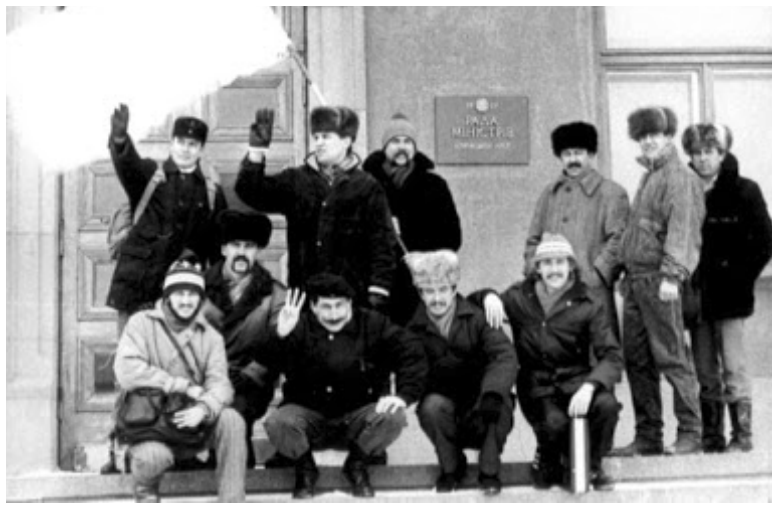
Активісти організації «Державна самостійність України» у Сімферополі біля Ради міністрів АР Крим, 1990-ті роки

як антиконституційних. Українські організації без матеріальних засобів, без газет, радіо і телебачення, а лише розповсюдженням самотужки виготовлених ентузіастами листівок не могли ефективно протидіяти пропагандистській машині проросійських сил. Проте була нагода заявити, що в Криму є достатньо людей, які стоять на засадах українського державотворення і сміливо виступають за Україну.