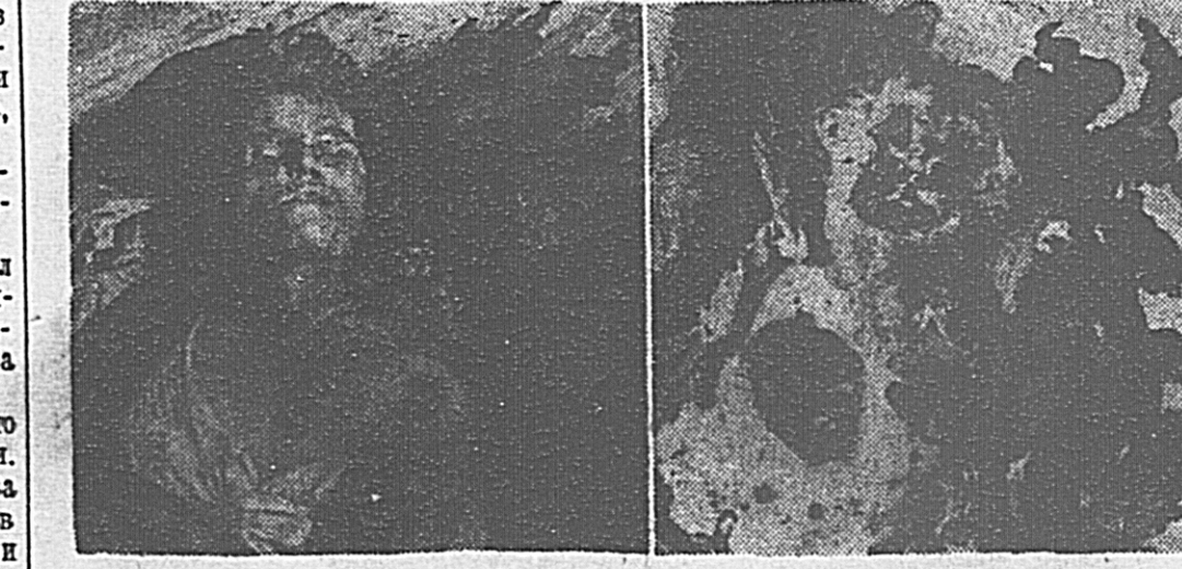
Над ними надругались фашисты. Трупы гражданки села Н. и 16-летней девушки из местечка Д., изнасилованных и изуродованных фашистскими изобретателями (Северо-Западное направление).

«КОМСОМОЛЬСКАЯ ПРАВДА» 2 стр. 4 декабря 1941 г.