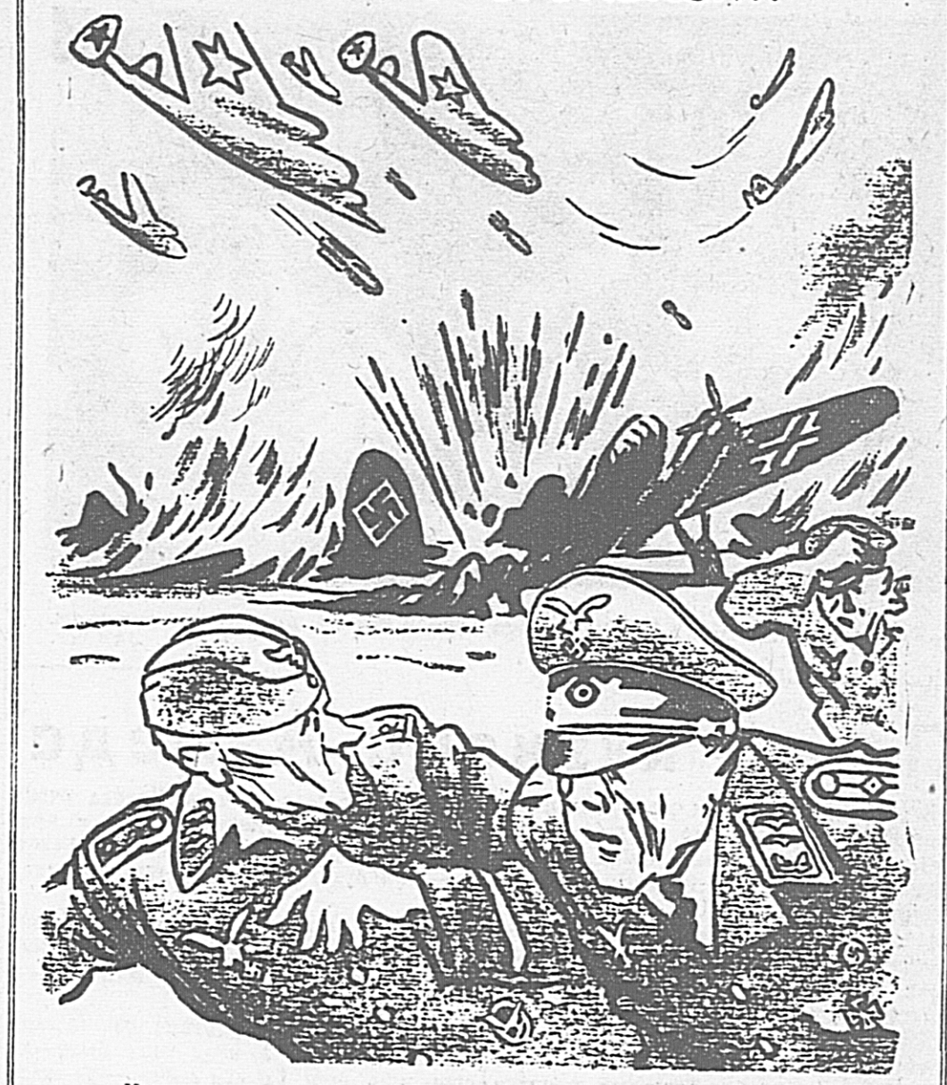
— Какая несправедливость, фельдфебель! Генерал обвинил нас в бездельности, в то время как мои летчики буквально горят на работе.