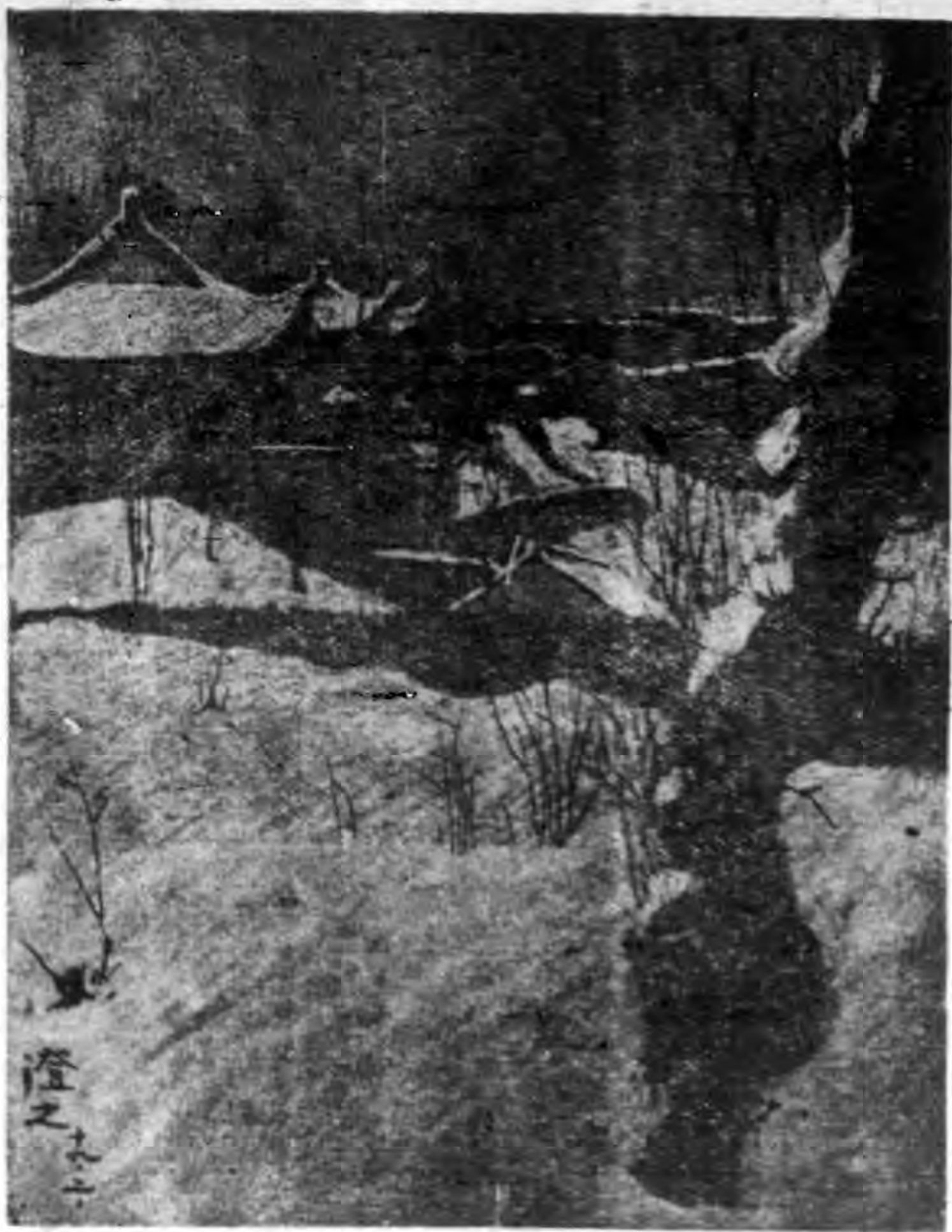
雪 積 城 台 南 風 社 員 陸 其 清 作

現在一般人的腦海裏，祇是注意着政治的變遷，外交的趨向或軍事的行動，好像忘了世上還有美術的存在。其實，一個四歲小孩（奧特華）的墨團子作品展覽會，也會激動羣衆的沉寂的心情。因爲人們的確都感到精神上糧食的缺乏，所以遇着了奧特華展覽會，也如吳黎吃着山珍海錯一樣的快樂。那末六月六日那天，這新進藝術團體——南風社——第一次展覽會的藝術作品，必將給與人們更深刻的印象。這展覽會的誕生，的確是人們精神上的糧食。猶如那春日蕩漾的南風，將吹散了人間一切的卑穢煩愁！令人優遊陶醉！那天室中的陳列，滿目琳瑯，確有美不勝收之感。那陳列着的以油畫最多，素描也不少、其次就是國畫水彩畫和極少數的圖案，他們作品的取材，有風景人像靜物等等，可是他們最精練的作品、當首推人像一類