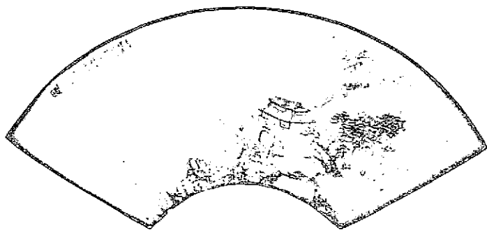
張蓮溪先生繪贈乘鈞者