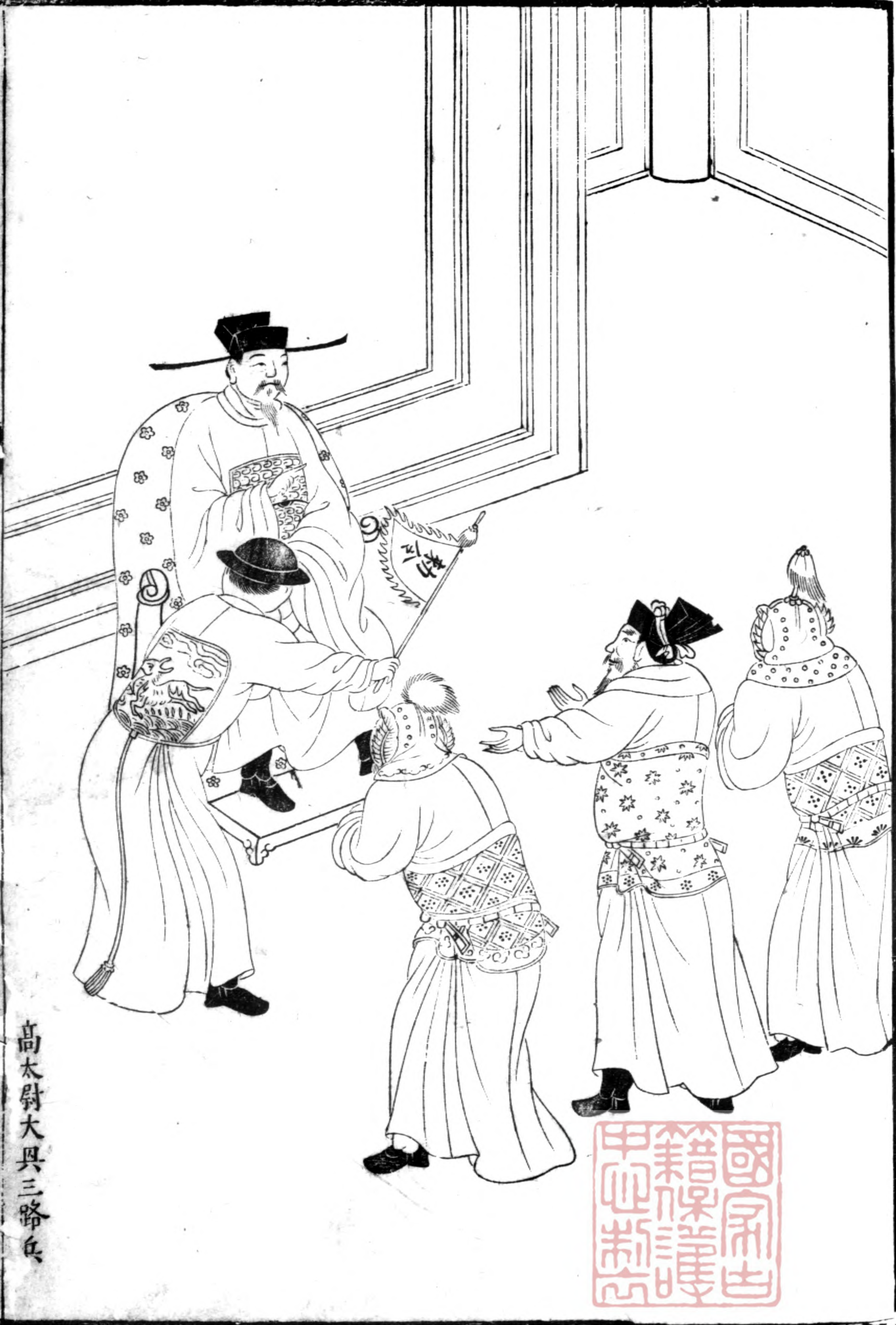
高太尉大興三路兵