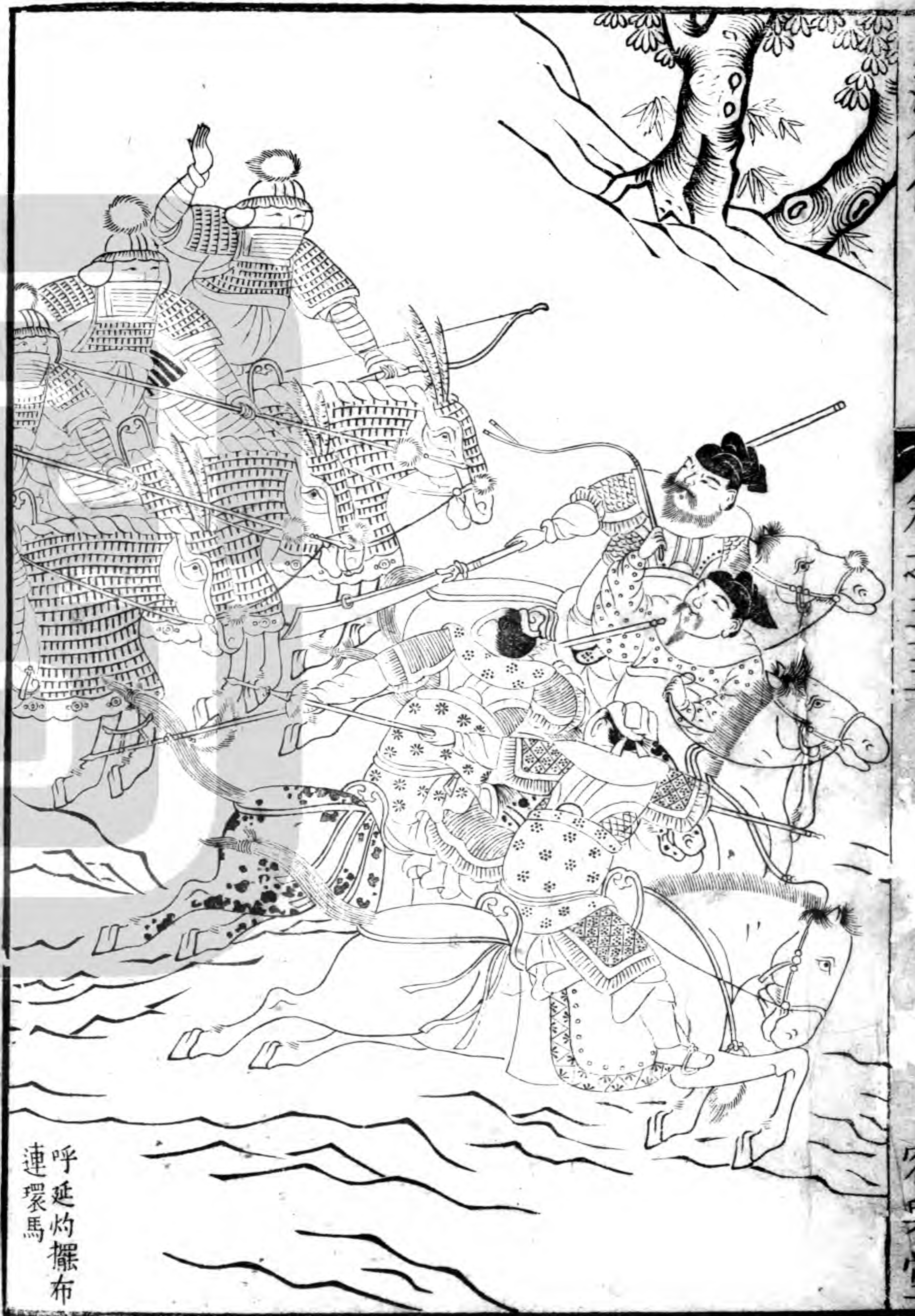
呼延灼擺布 連環馬