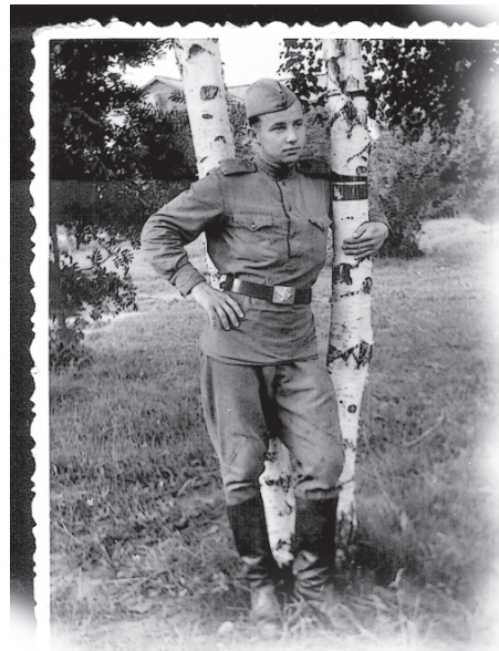
1962 год. С переславскими березками-подружками.