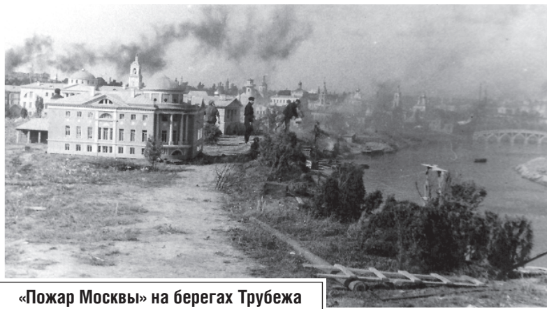
«Пожар Москвы» на берегах Трубежа