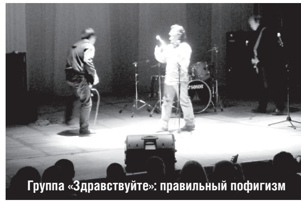
Группа «Здравствуйте»: правильный пофигизм