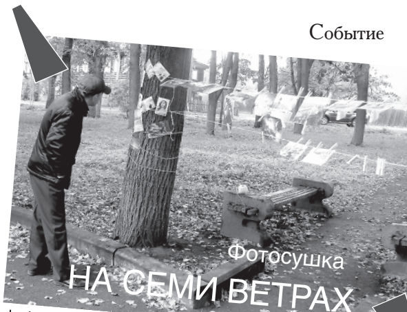
Фотосушка НА СЕМИ ВЕТРАХ