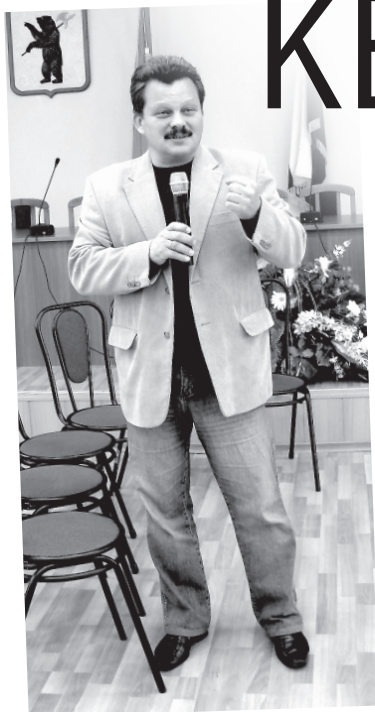
Участников приветствует мэр Переславля

Подготовка и проведение викторины легли на плечи сотрудников молодежного центра, и, забегая вперед, скажу: получилось у них неплохо. Все проходило в актовом зале мэрии, что еще более добавляло важности и торжественности!