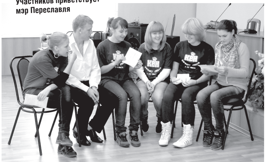
«Родившиеся в 90-е» сполна испытали на себе, что такое жизненный опыт и бойцовская закалка старшего поколения!

И тем не менее, опыт побил молодость - выиграла «Молодшая дружина!» Хотя разница в одно очко позволяет сказать традиционное: победила дружба! Ведь, как и сказал в начале глава города, молодые поняли, что значит опыт, и наверняка прониклись к ветеранам еще большим уважением, а те, в свою очередь, ближе познакомилась с современной молодежью. Одним словом, сдружились!