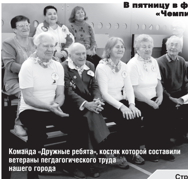
Команда «Дружные ребята», костяк которой составили ветераны педагогического труда нашего города

Остается добавить, что поздравить пожилых с их праздником и пожелать им спортивных успехов и долголетия пришли руководители города во главе с мэром.