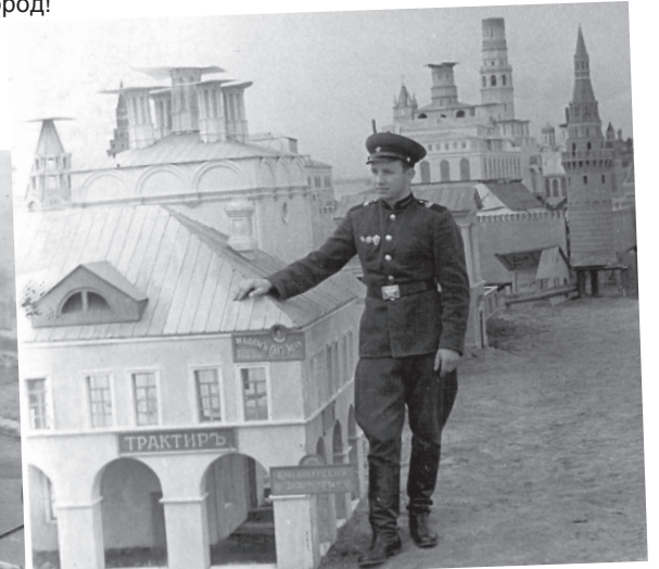
1963 год. У декораций фильма «Война и мир», который снимали в то время в Переславле