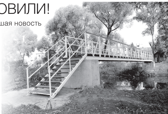
Новый пешеходный мост через Трубуж

И вот на минувшей неделе на месте снесенного появился новый красавец мост! Он намного более устойчив к половодью, надежен и к тому же имеет высоту, достаточную для беспрепятственного прохождения судов ГИМСа. Жители довольны!