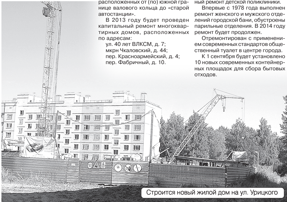
Строится новый жилой дом на ул. Урицкого