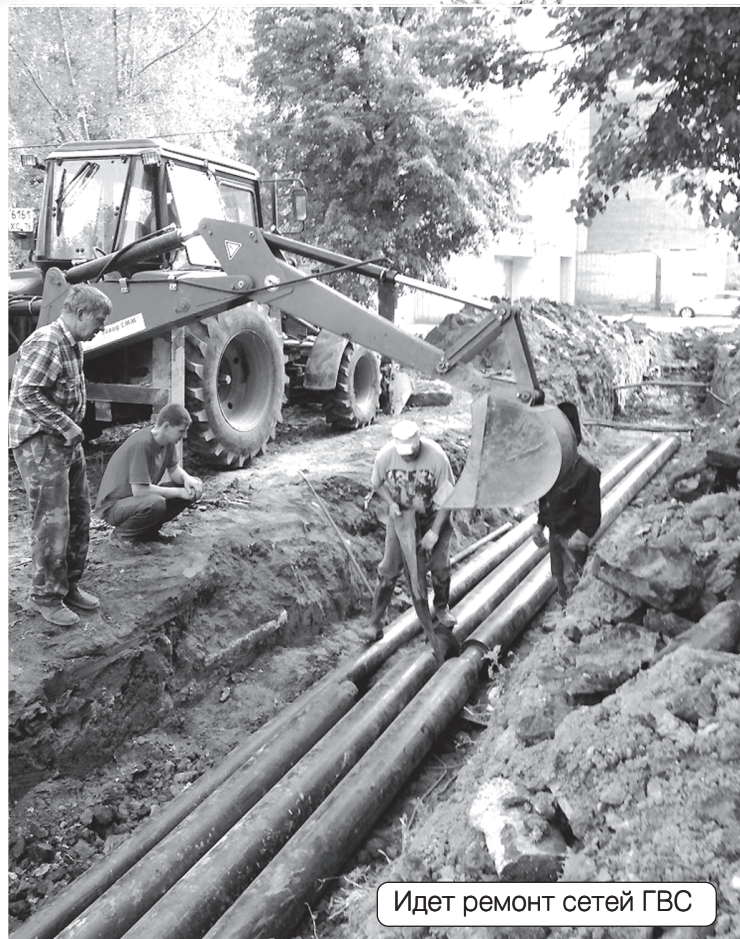
Идет ремонт сетей ГВС