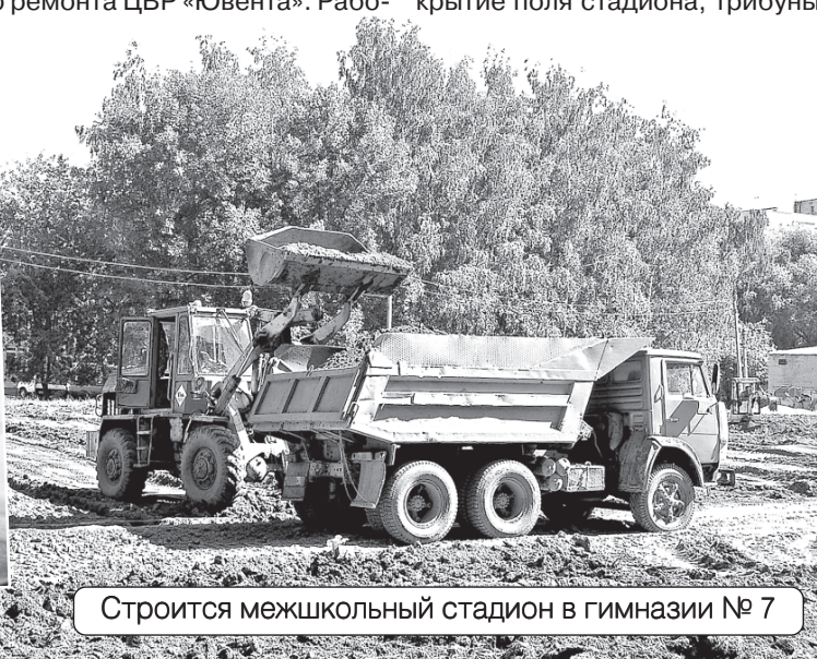
Строится межшкольный стадион в гимназии № 7