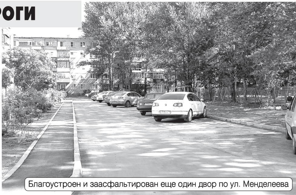
Благоустроен и заасфальтирован еще один двор по ул. Менделеева

В августе начнется реконструкция дороги на ул. Менделеева, которая будет включать в себя замену водовода и устройство нового тротуара по всей длине