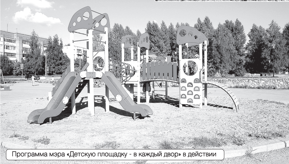
Программа мэра «Детскую площадку - в каждый двор» в действии