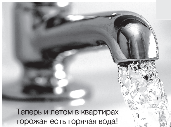
Теперь и летом в квартирах горожан есть горячая вода!

К 1 сентября будет установлено 10 новых современных контейнерных площадок для сбора бытовых отходов.