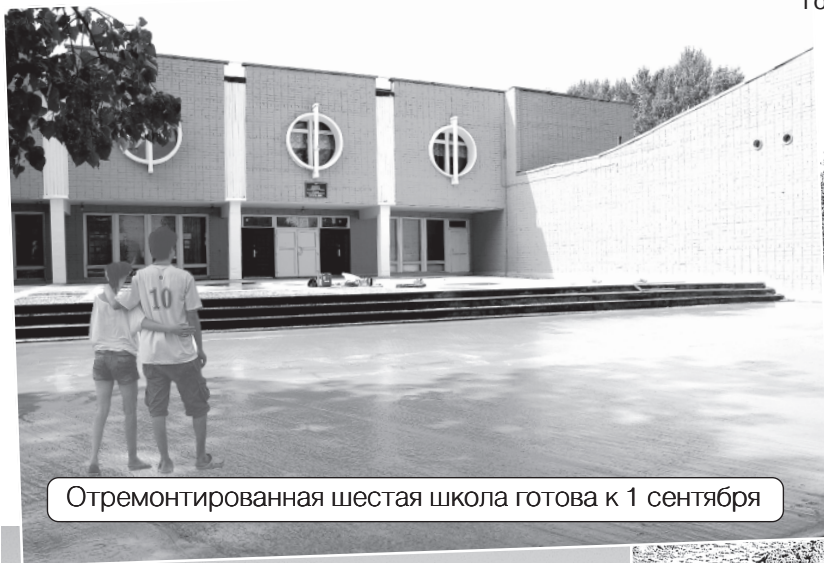
Отремонтированная шестая школа готова к 1 сентября

Многие жители Переславля-Залесского по достоинству оценили то обстоятельство, что наконец-то в городе появился кинотеатр «Оскар».