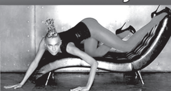
ФОТО-ВИДЕО студия -Огромный выбор ФОТО-ВИДЕО ТОВАРОВ -ПОДАРКИ, СУВЕНИРЫ, ПАРФЮМЕРИЯ ФОТО НА ДОКУМЕНТЫ за 10 мин ЛАМИНИРОВАНИЕ

КСЕРОКОПИЯ -НА ПАМЯТНИКИ ПЕЧАТЬ ФОТОГРАФИЙ любого формата ОПЕРАТИВНАЯ ЦИФРОВАЯ ПОЛИГРАФИЯ -любой дизайн, визитки, буклеты, календари, наклейки, виньетки, флаеры ВОССТАНОВИТЕЛЬНЫЕ РАБОТЫ -ХУДОЖЕСТВЕННОЕ ФОТО ОЦИФРОВКА, МОНТАЖ И КОПИРОВАНИЕ БАГЕТ РАЗНЫХ РАЗМЕРОВ В НАЛИЧИИ И НА ЗАКАЗ