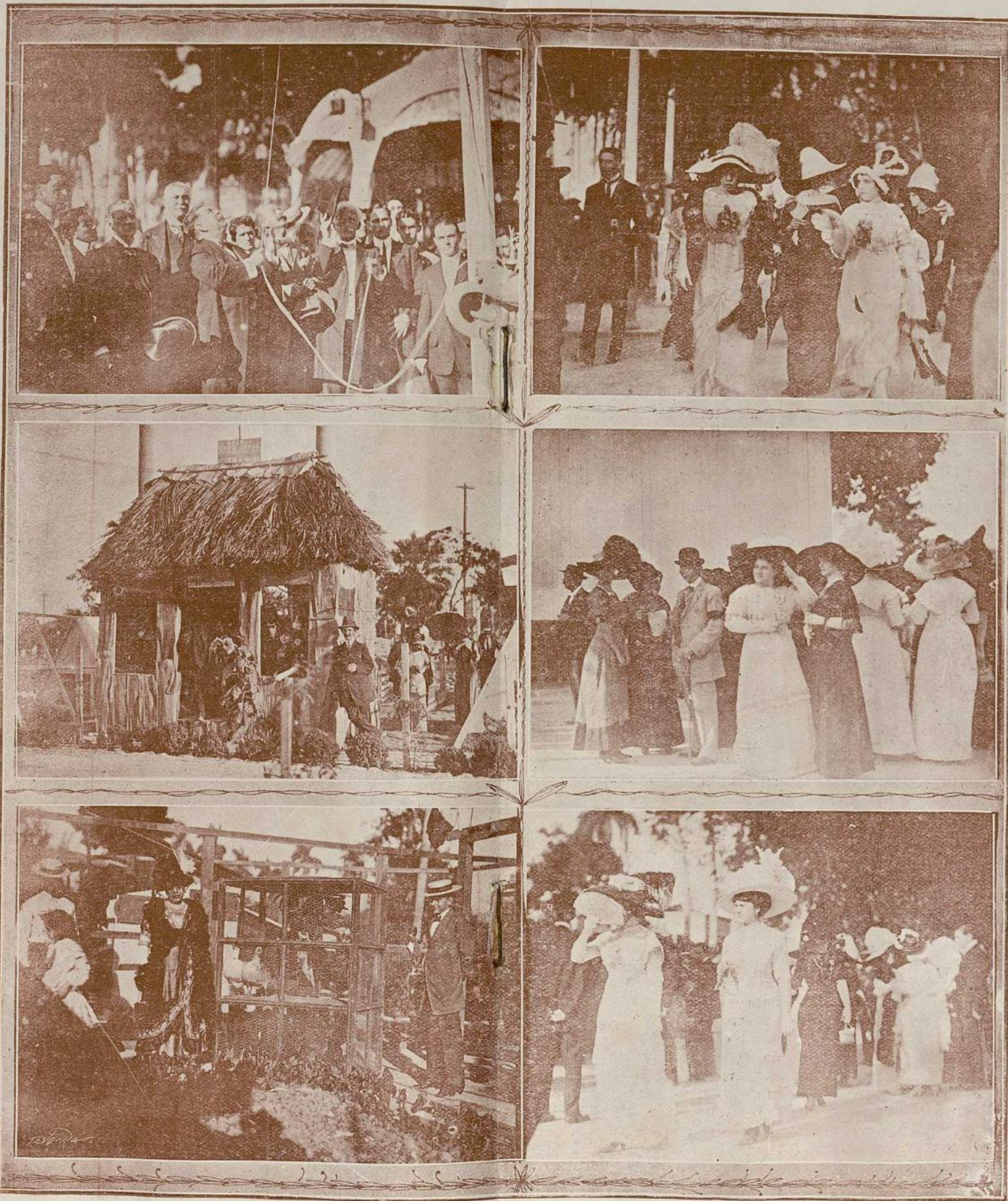
LA ACTUALIDAD: ALGUNOS ASPECTOS DE LA EXPOSICIÓN NACIONAL DE AGRICULTURA EL DÍA DE LA INAUGURACIÓN EFECTUADA EL DOMINGO 28 DE ENERO PRÓXIMO PASADO