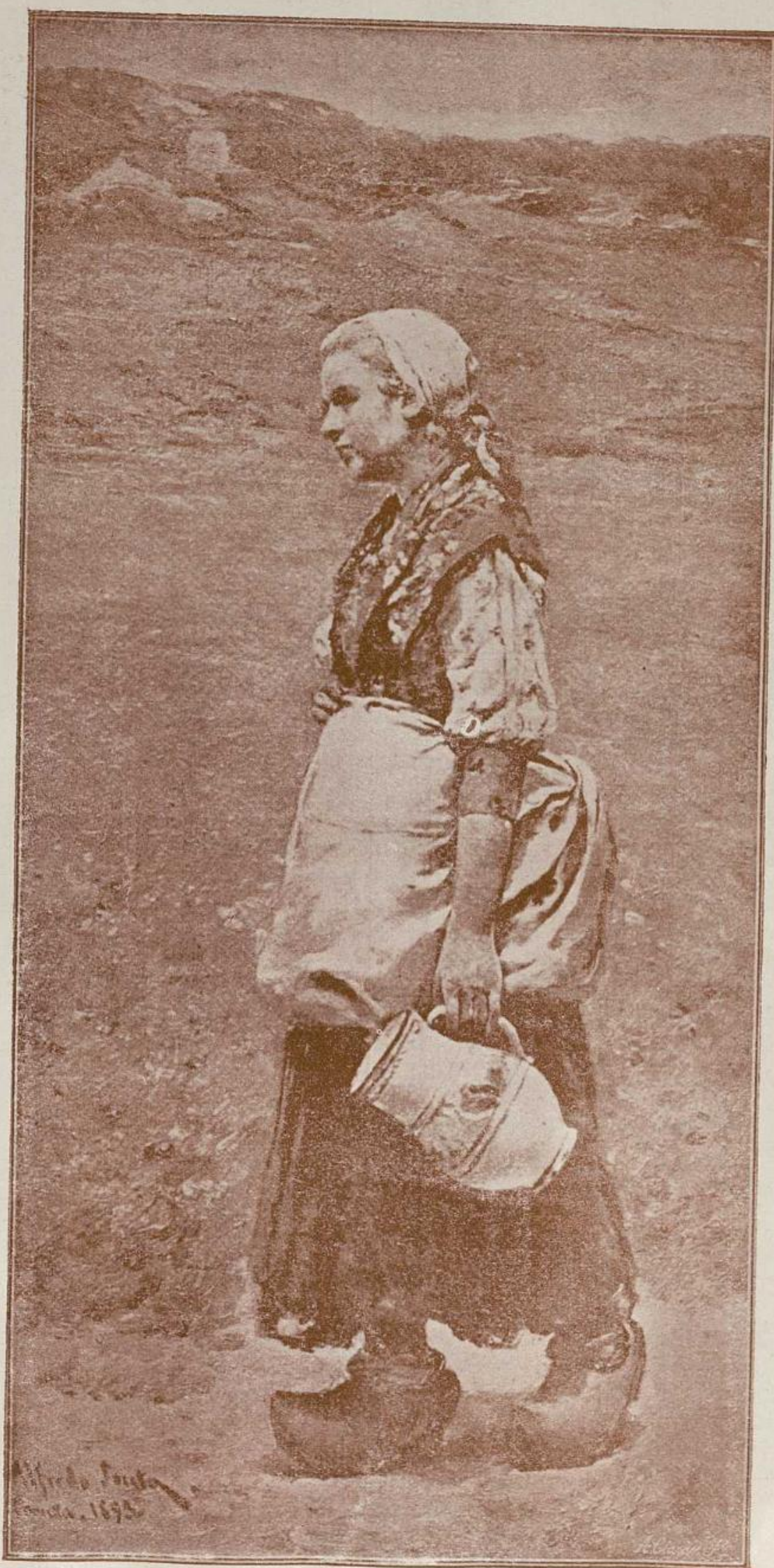
Camino de la fuente