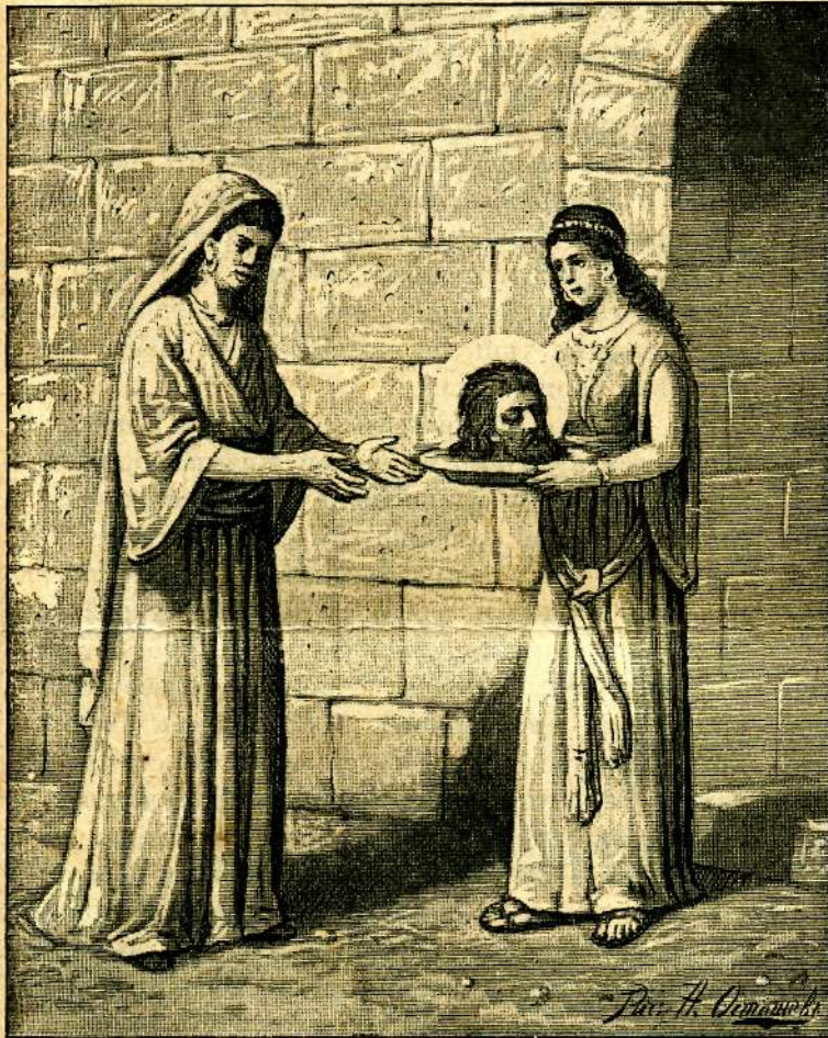
Иродіада и Саломія съ усѣченною главою Св. Предтечи и Крестителя Господня Іоанна. (Къ 29-му августа).

Многіе невѣры отрицаютъ дѣйствительность такихъ чудесъ, иные сомнѣваются въ возможности ихъ, прибѣгая къ разнымъ ухищреннымъ объясненіямъ „непонятныхъ“ для нихъ явленій, но вѣдь, чудесныя исцѣленія отъ болѣзней совершаются часто на глазахъ многочисленныхъ свидѣтелей, иные же чудесные случаи помощи Божіей людямъ