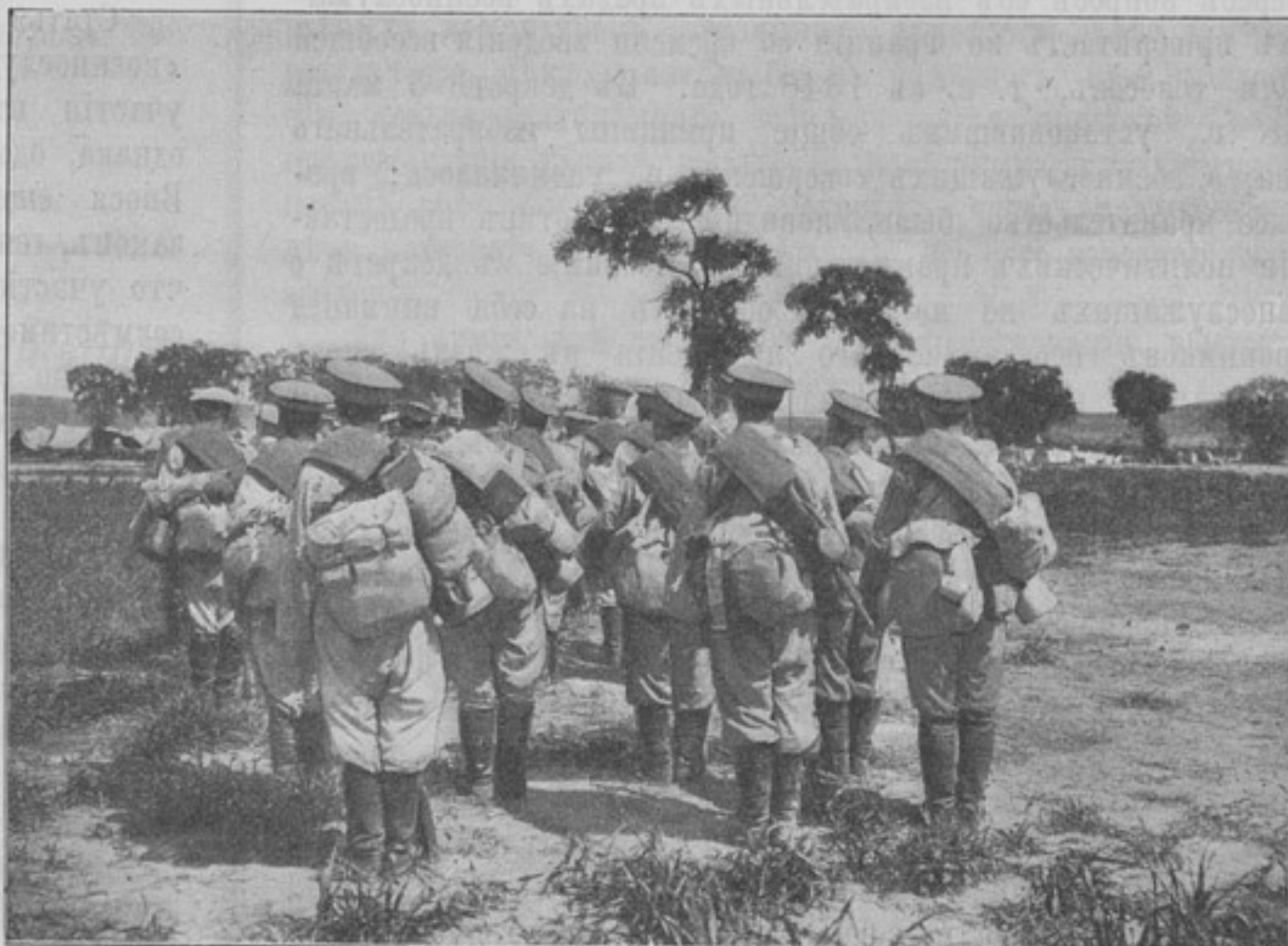
Хвостъ колонны. (Къ ст. «Пригонка снаряженія»).