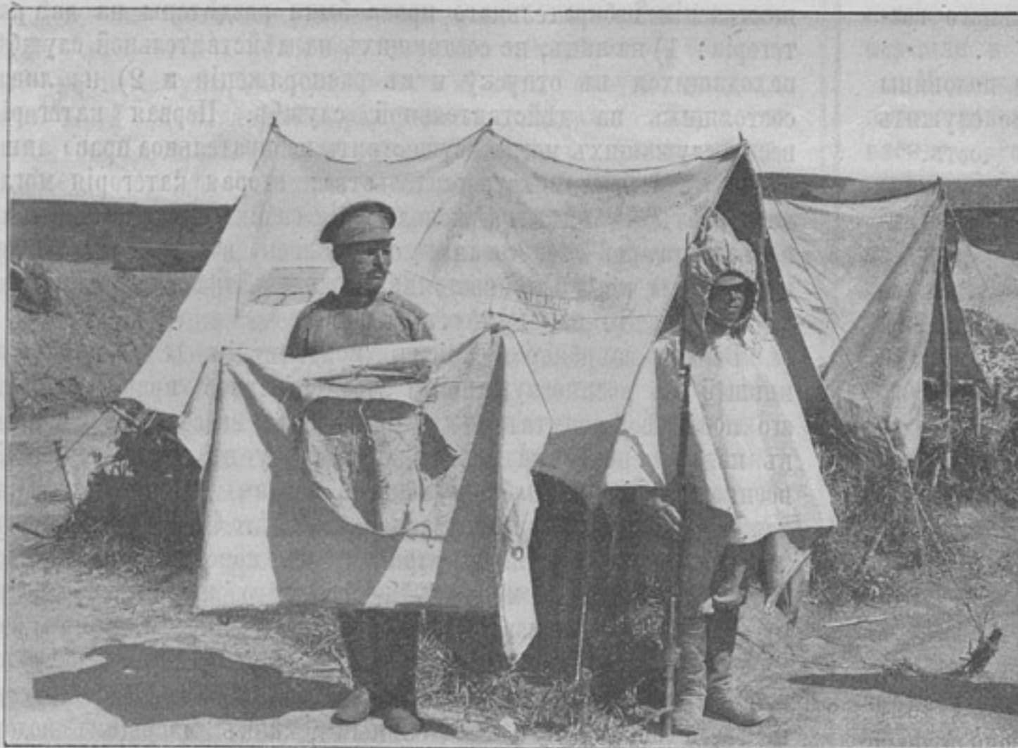
Палатка дождевая накидна. (Къ ст. «Пригонка снаряженія»).

вернуть военнымъ избирательныя права, но всѣ эти попытки кончались полной неудачей *).