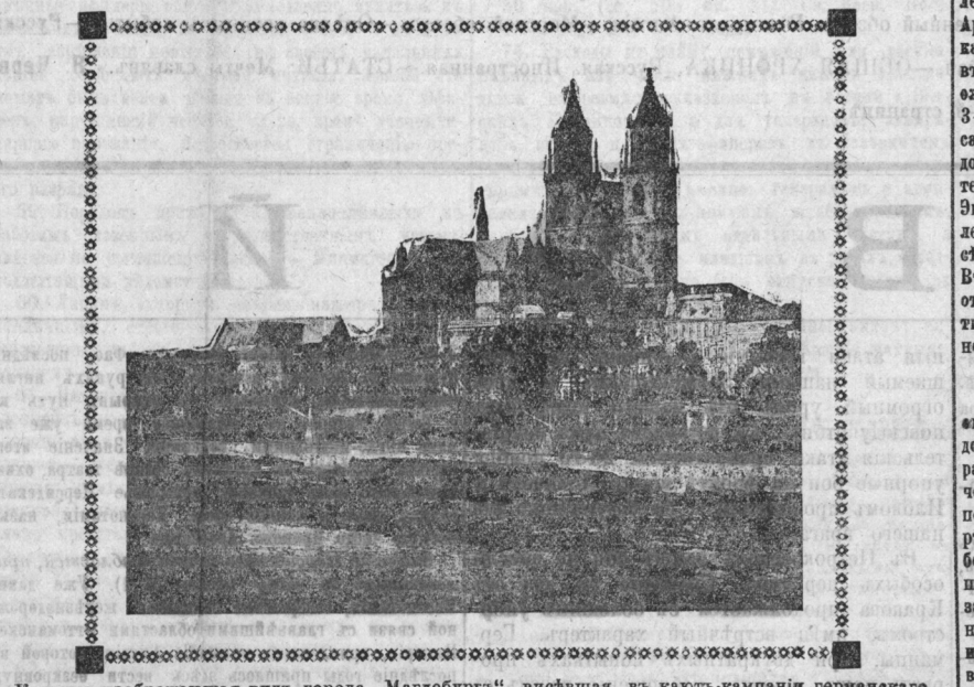
Картина изображающая видъ города «Магдебурга», взятая въ каютѣ каманія германскаго крейсера «Магдебурга», уничтоженаго немскими судами 13-го августа 1914 года въ Балтiйскомъ морѣ.