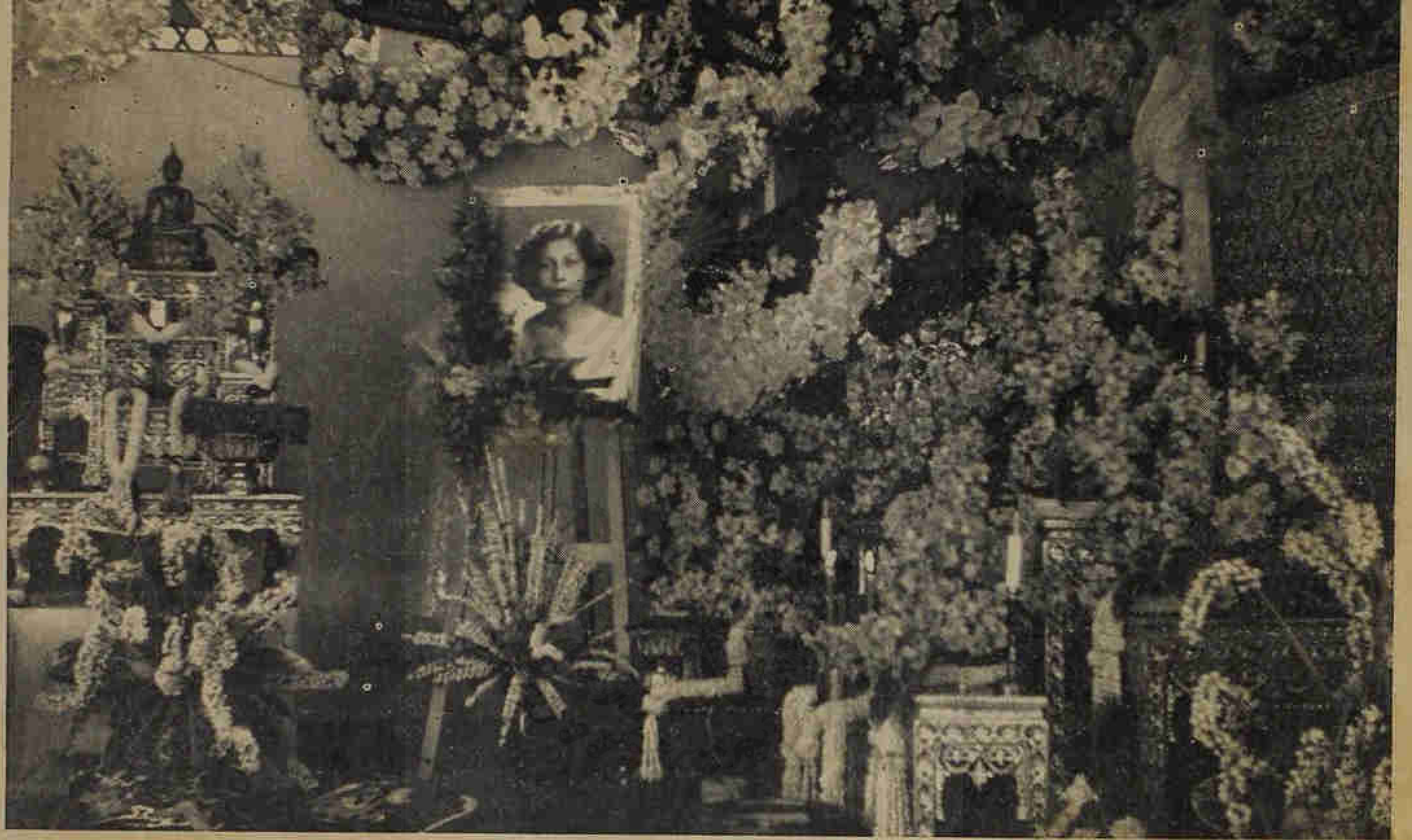
๕๐๔ ตงศพขำเพญกุล ๗ บ้านคลองเตย