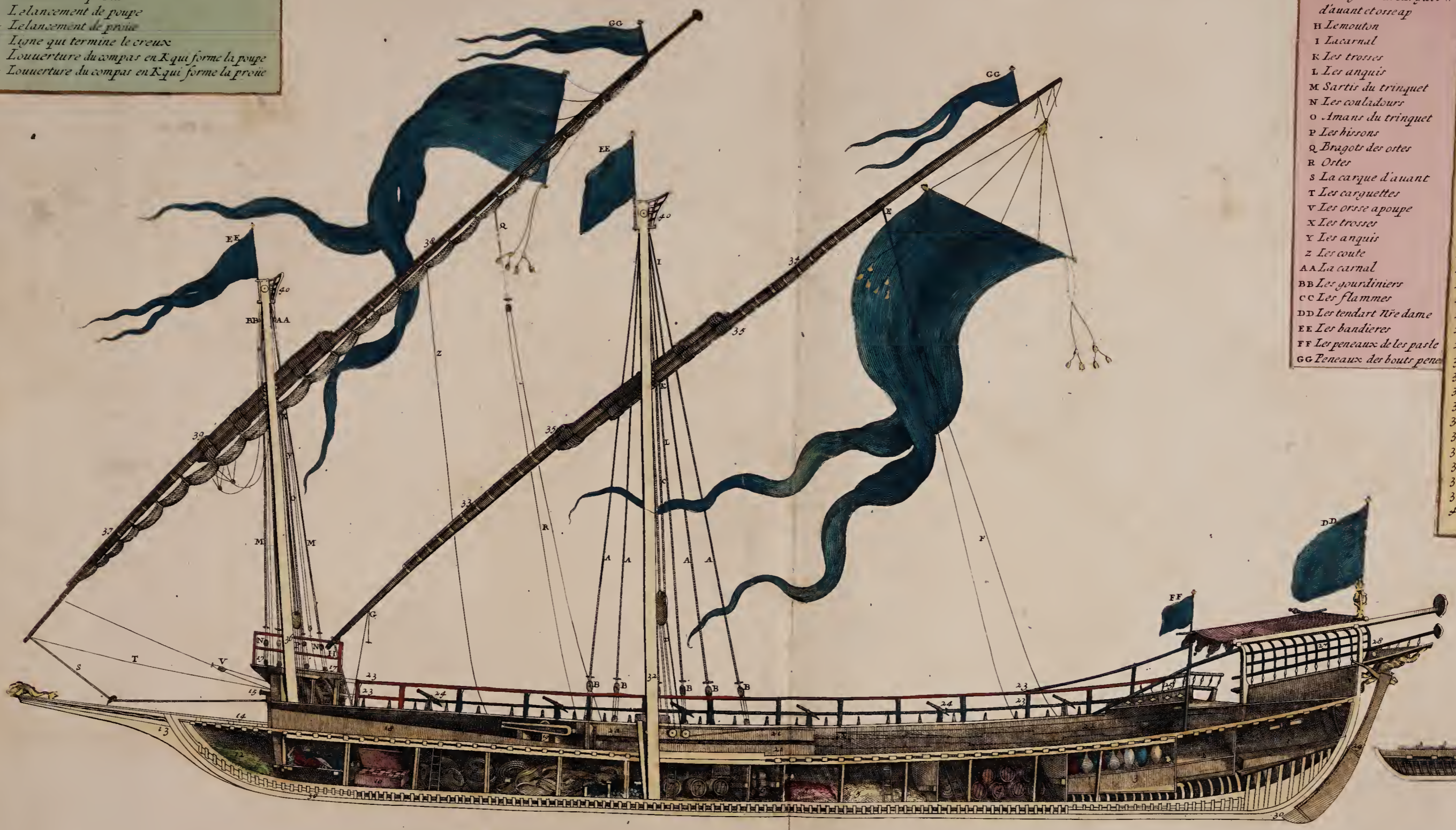
Coupe D'une Galere Avec Ses Proportions

A Sartis de Maistre B Couladours Maistre C Amans de Maistre D Les vestes de Maistre E Bragots des ostes F Ortes G Bragots o la carguer H Le mouton I Lacarnal K Les trosses L Les anquis M Sartis du trinquet N Les couladours O Amans du trinquet P Les hissons Q Bragots des ostes R Ortes S La carque d'avant T Les carquettes V Les orses apoupe X Les trosses Y Les anquis Z Les coute AA La carnal BB Les pourtiniers CC Les flammes DD Les tendart nre dame EE Les bandieres FF Les pencaux de les paste GG Pencaux des bout pencaux 1 Legauon 2 La chambre du conseil 3 Les scandala provisions du Capitaine 4 Compagne, vin, et viande 5 Lepanyol pain et legumes 6 Laroute aux poudres 7 Latuerne 8 La chambre des villes 9 Chambre de proue cordages 10 Caisse du chirurgien 11 Le tolar des malades 12 La chardoniere 13 Les peron 14 Le tambouret 15 Les canons 16 La conille 17 La rembade 18 Les anguilles du courcier 19 Le canon du courcier 20 La S te barbe 21 Les moisselas 22 La rais de courcier 23 Les filarets 24 Les periers 25 Les pale 26 Le tendelet 27 La guerite et la poupe 28 La timoniere 29 Le timon 30 La caronne ou quille 31 Le caïque 32 L'arbre de maistre 33 Le quart de maistre 34 La pene de Maistre 35 Les alepasser 36 L'arbre de trinquet 37 Le quart de trinquet 38 La pene de trinquet 39 Les alepasser 40 Les gatter