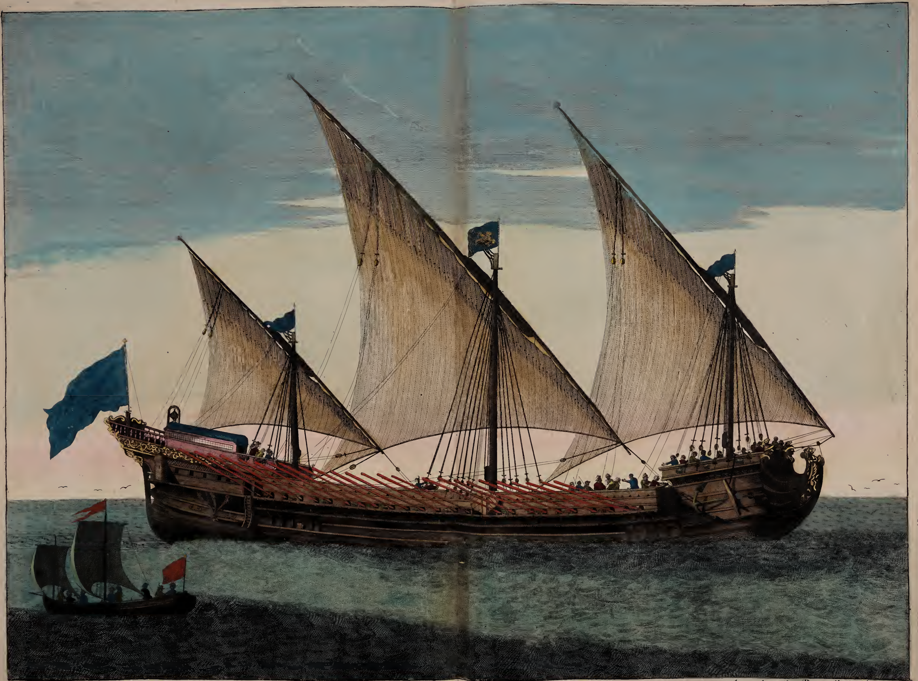
Galeasse a la voile.