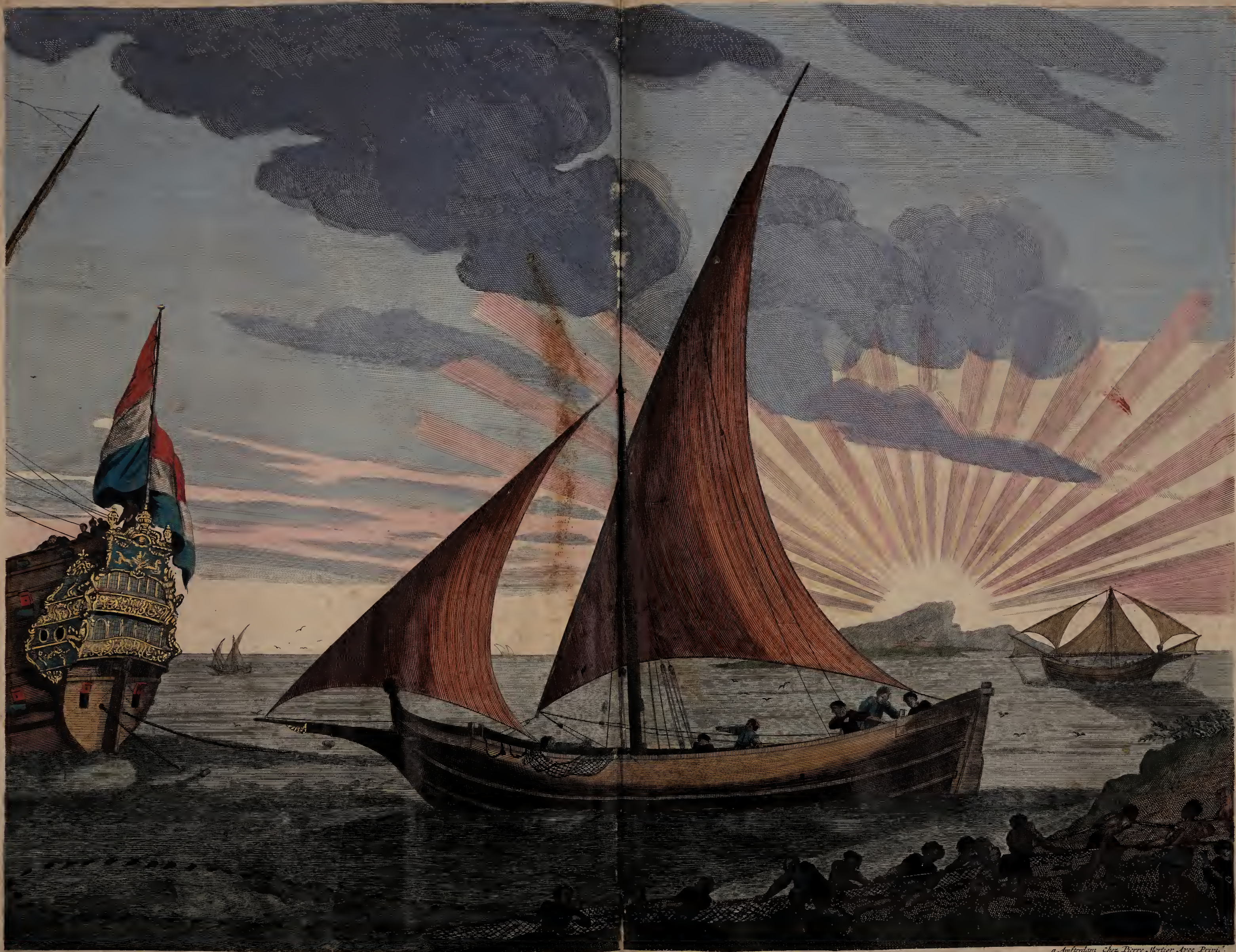
Tartane de Pesche