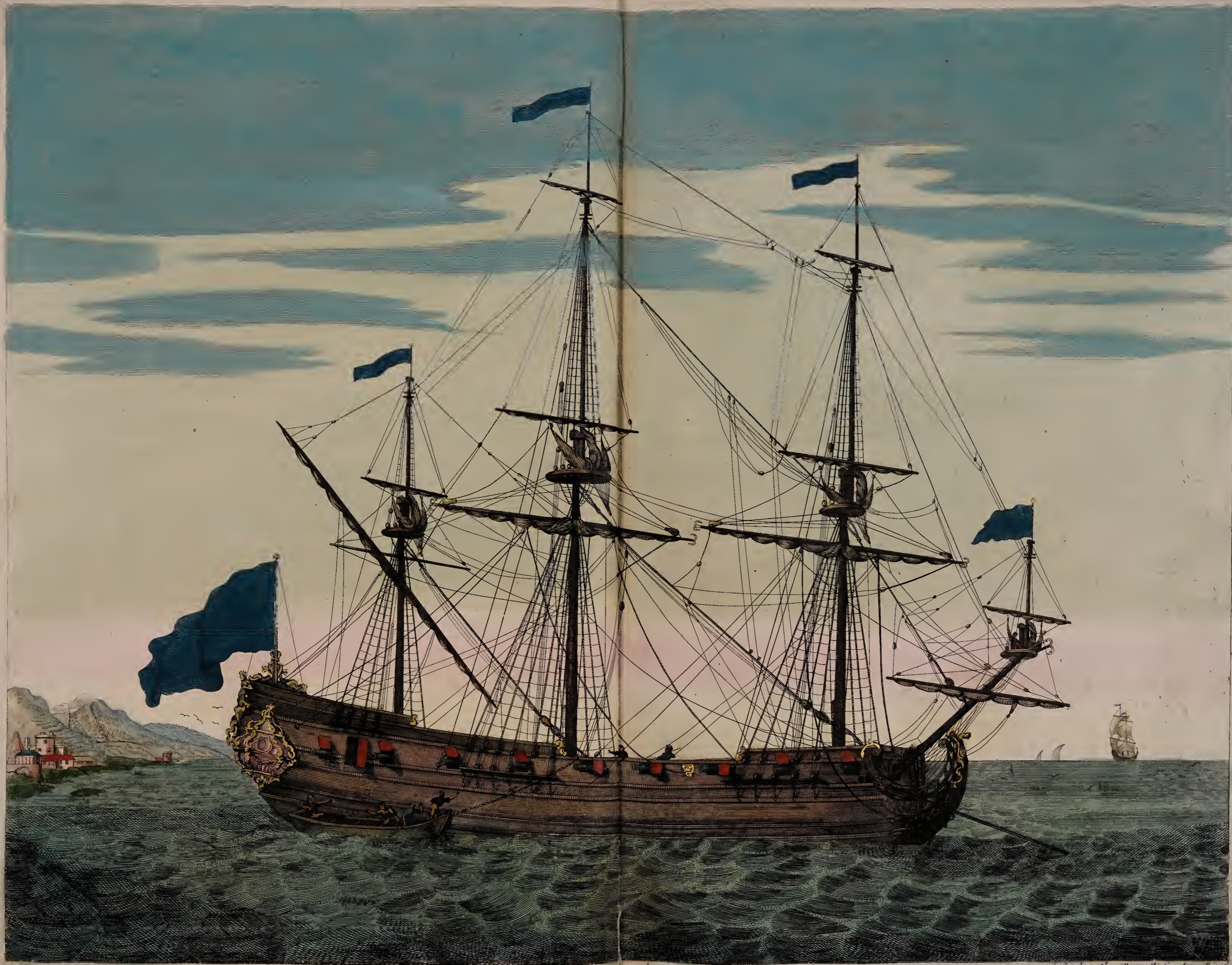
Bruster a la Sonde