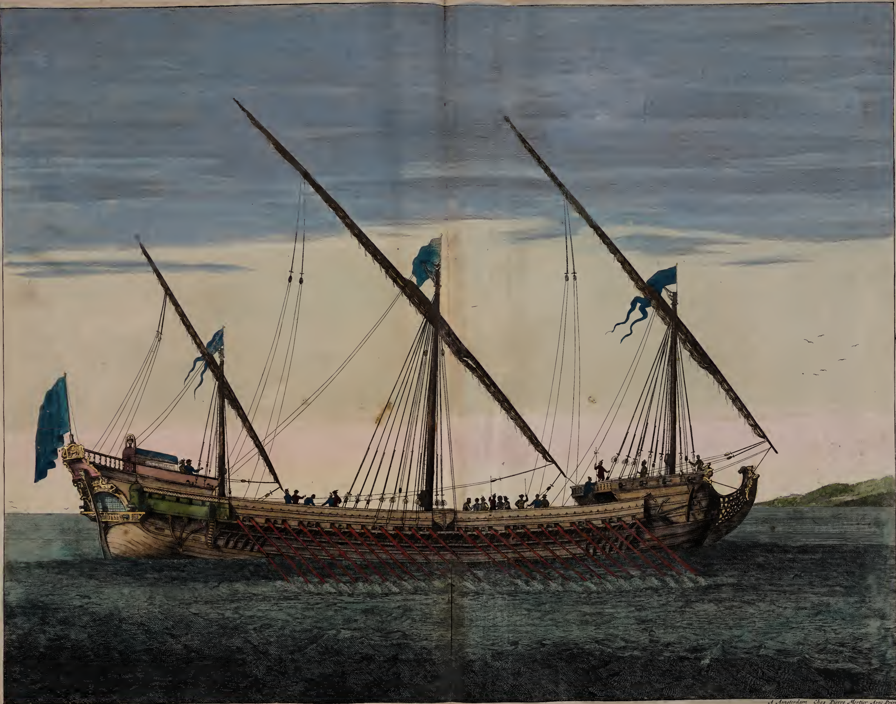
Galeasse a la rame.