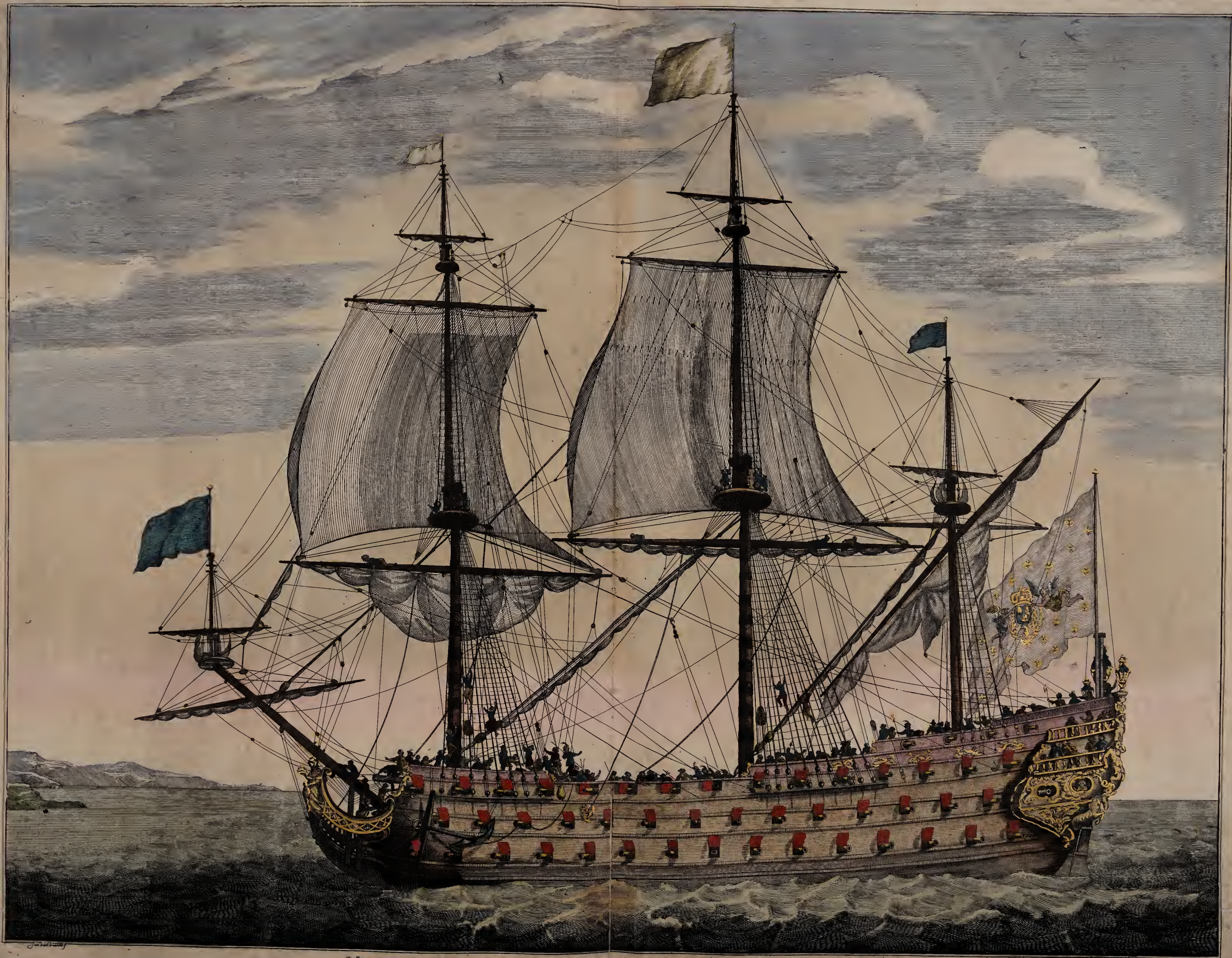
Vaisseau du premier rang portant pavillon d'Admiral