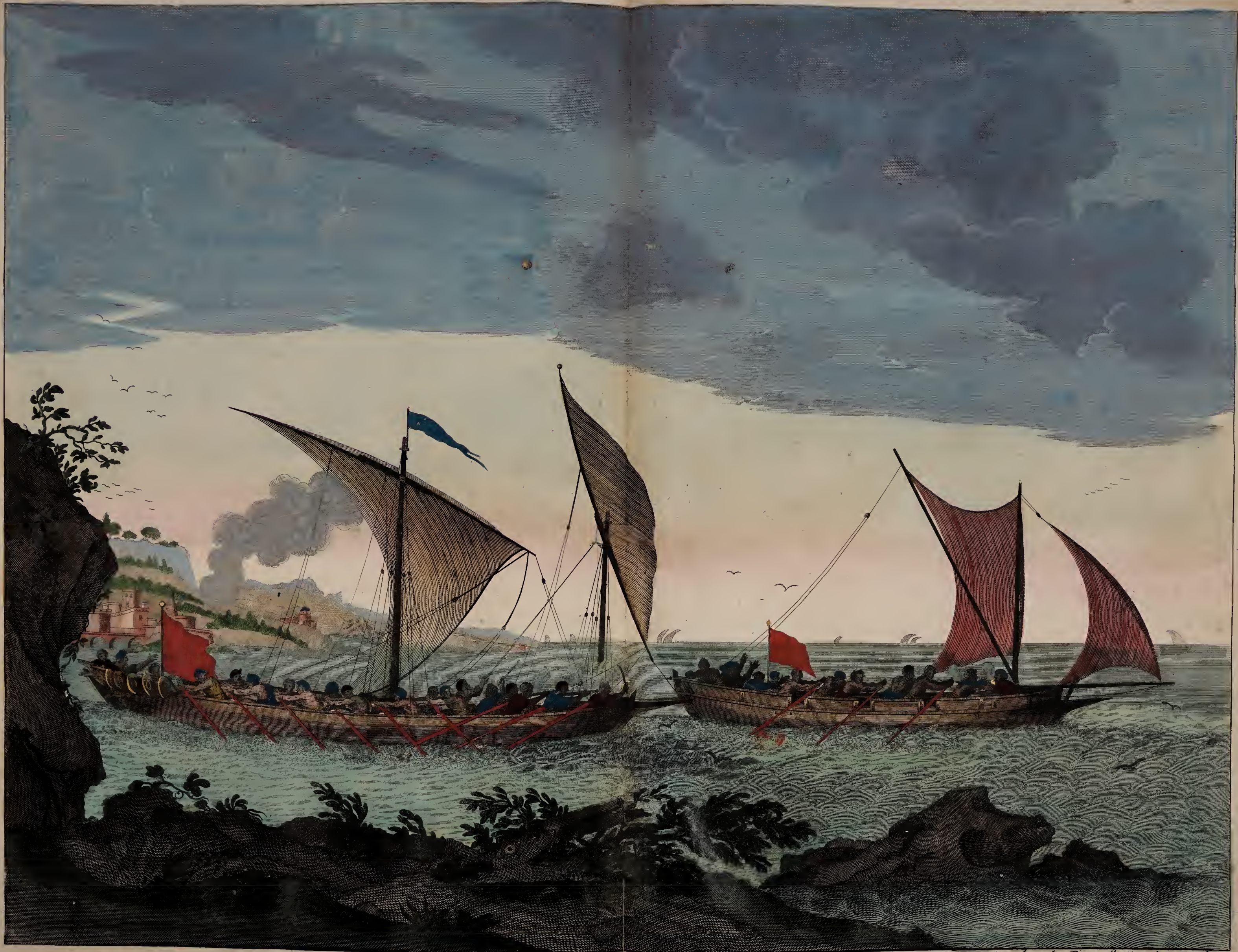
Brigantin donnant chasse a une Felouque et prest alaborder.

a Amsterdam Chez Pierre Mortier Avec Privilege.