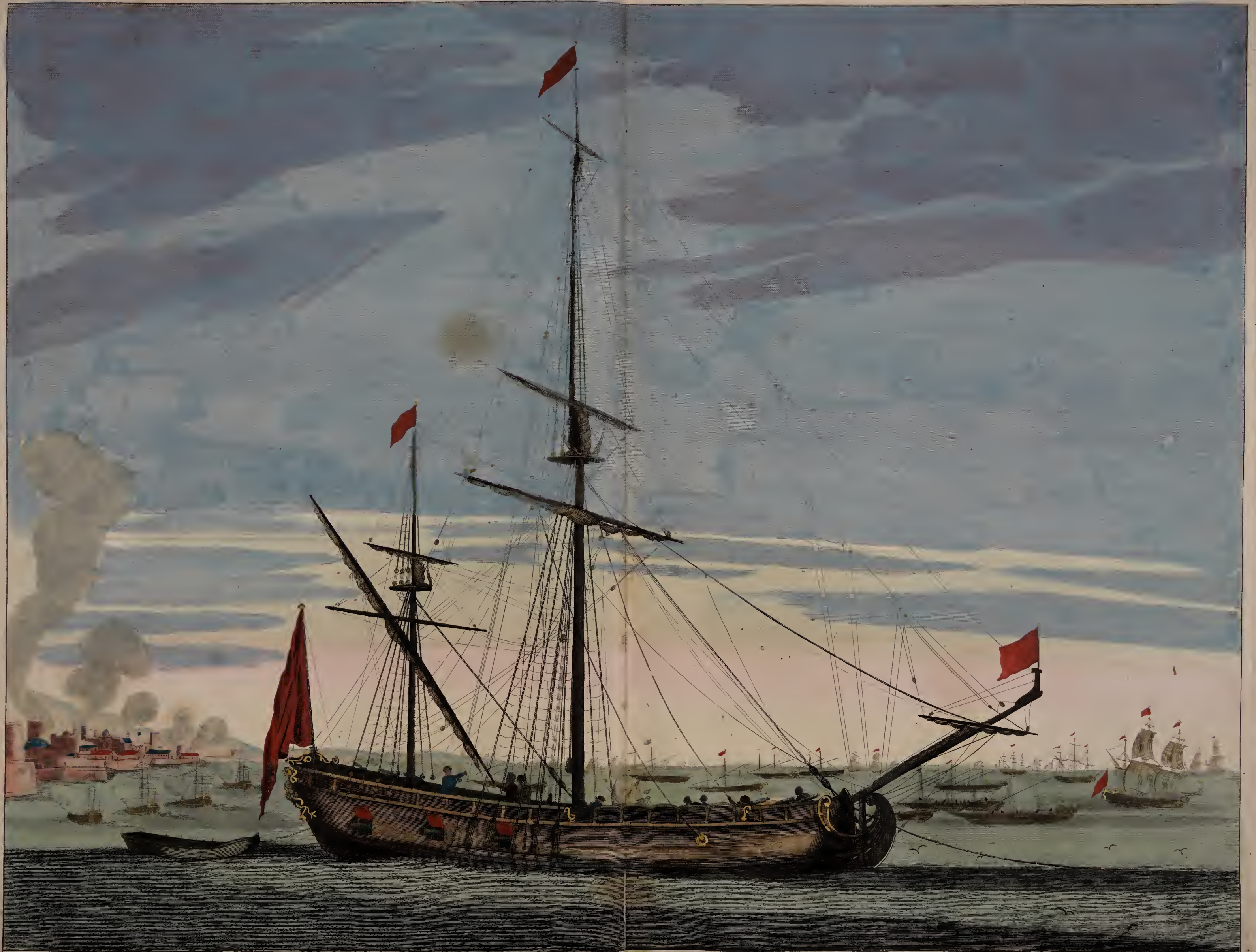
Galiote a bombe.