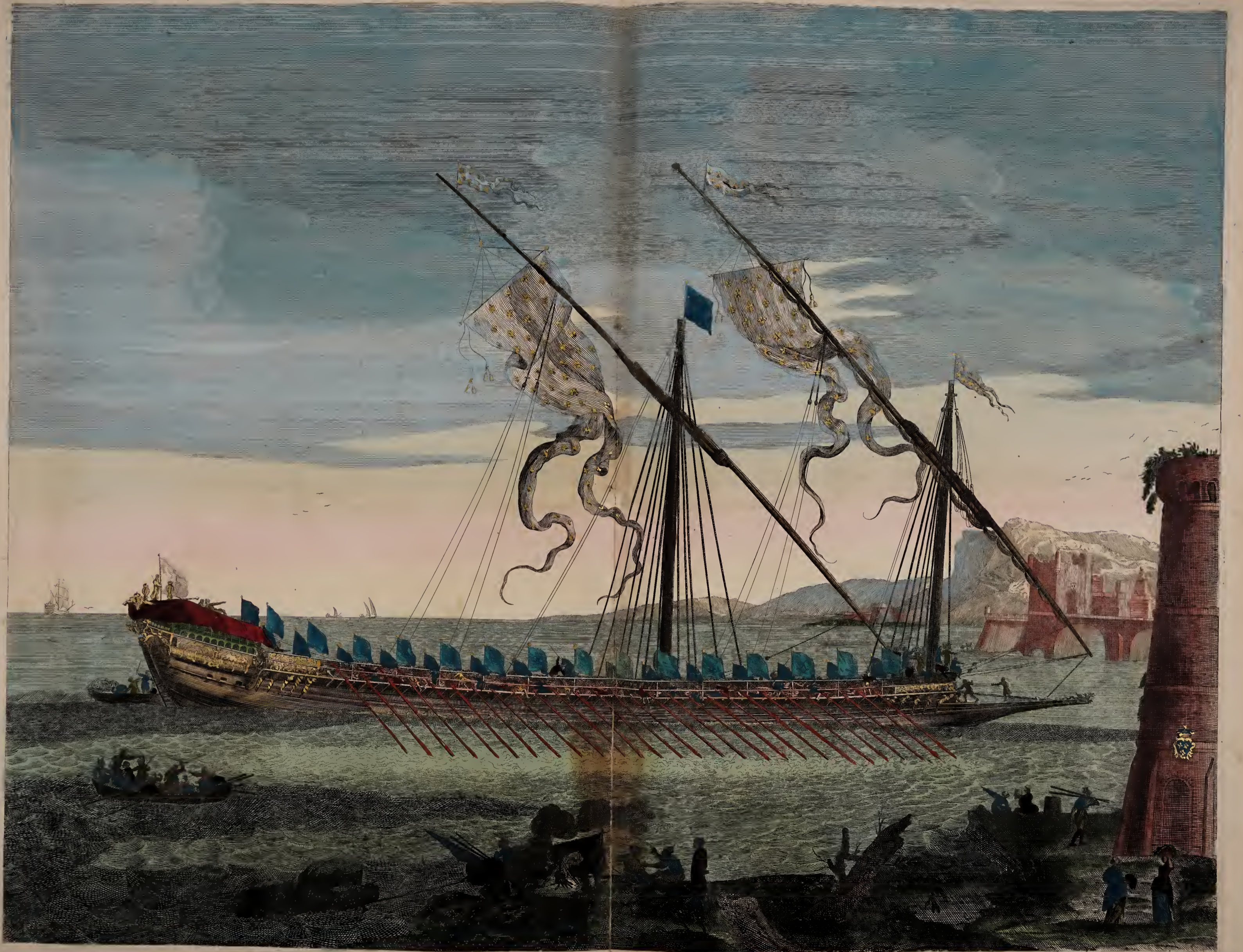
La galere Patronne, a la rame.