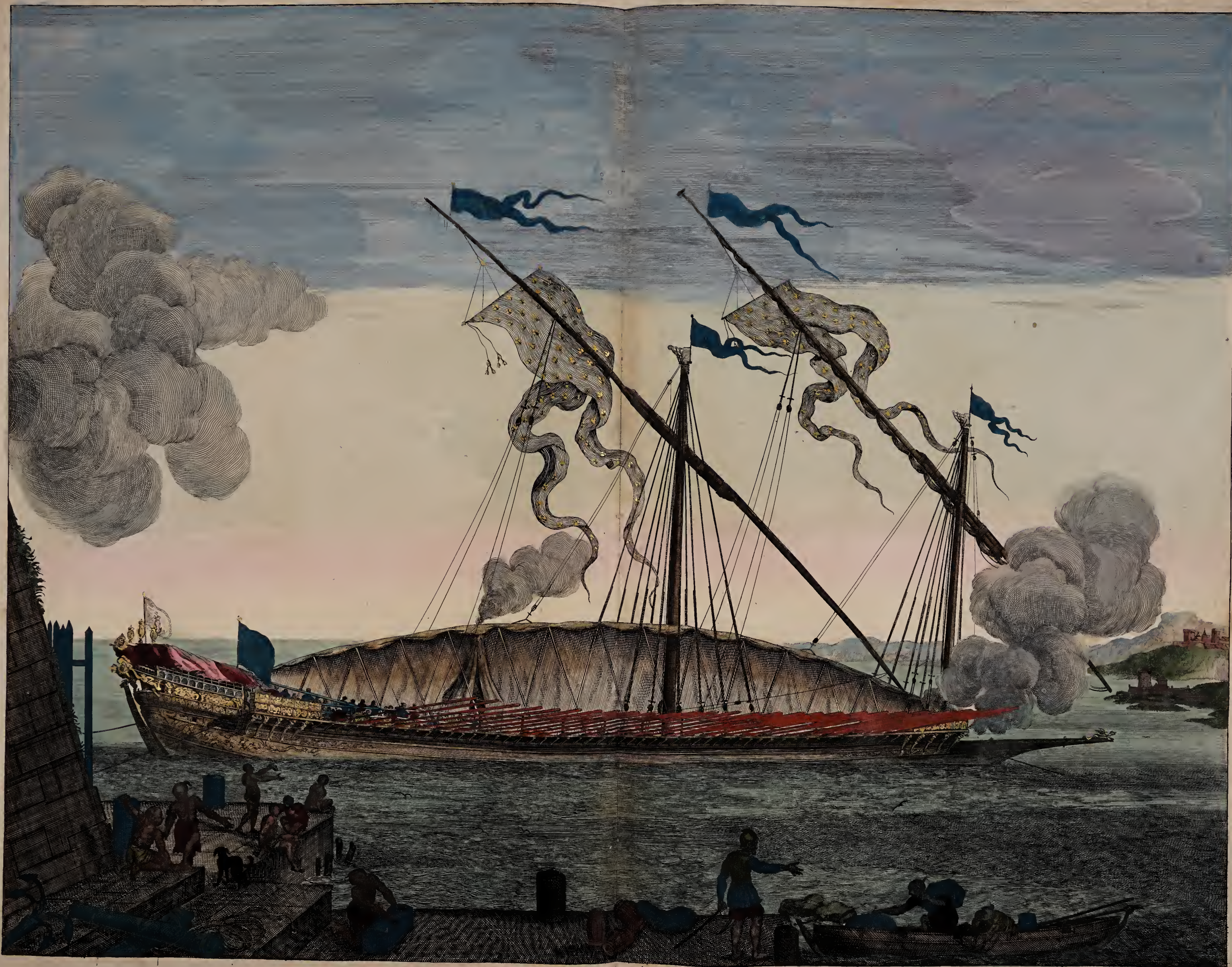
la Galere Reale a la sonde.