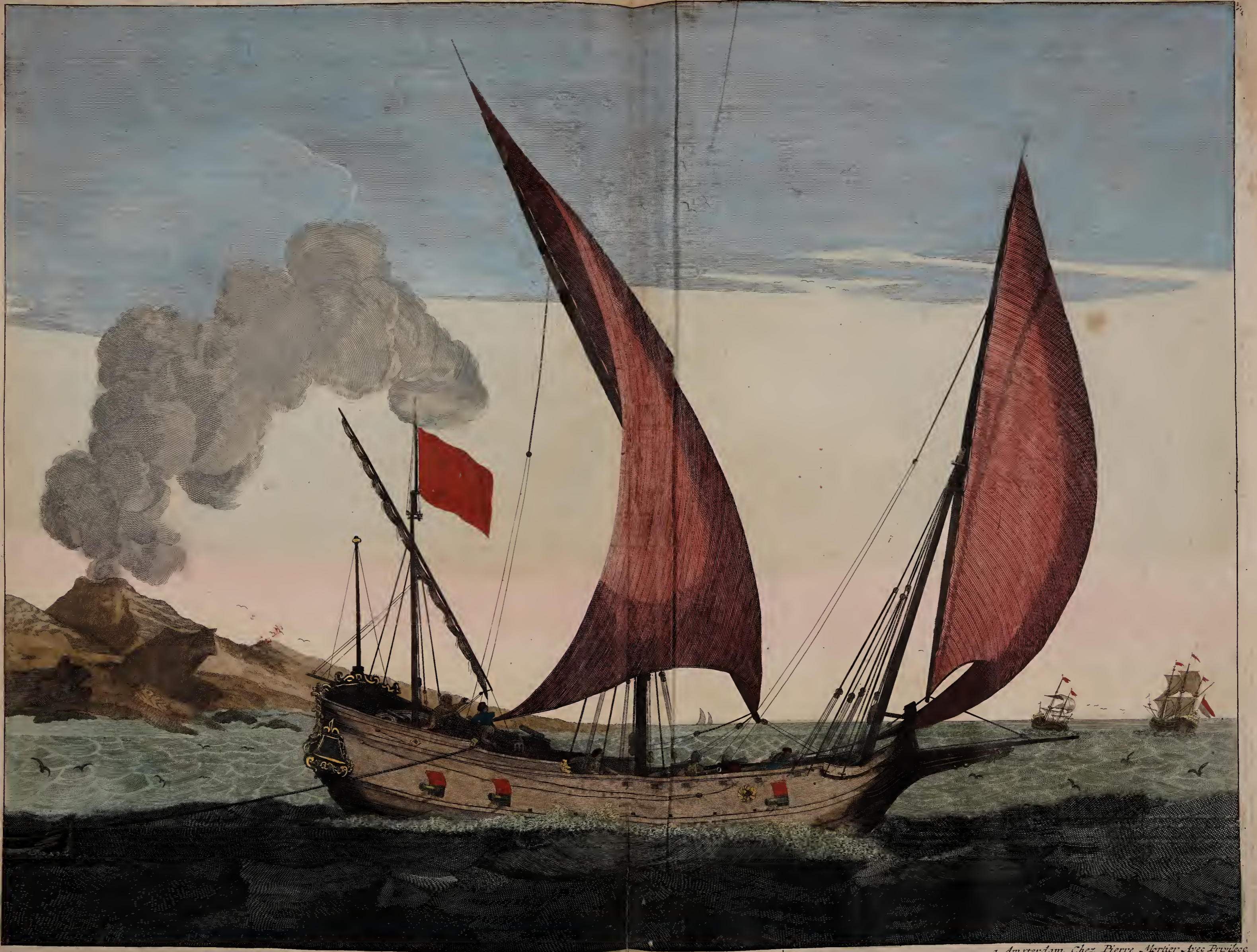
Barque allant vent arriere.