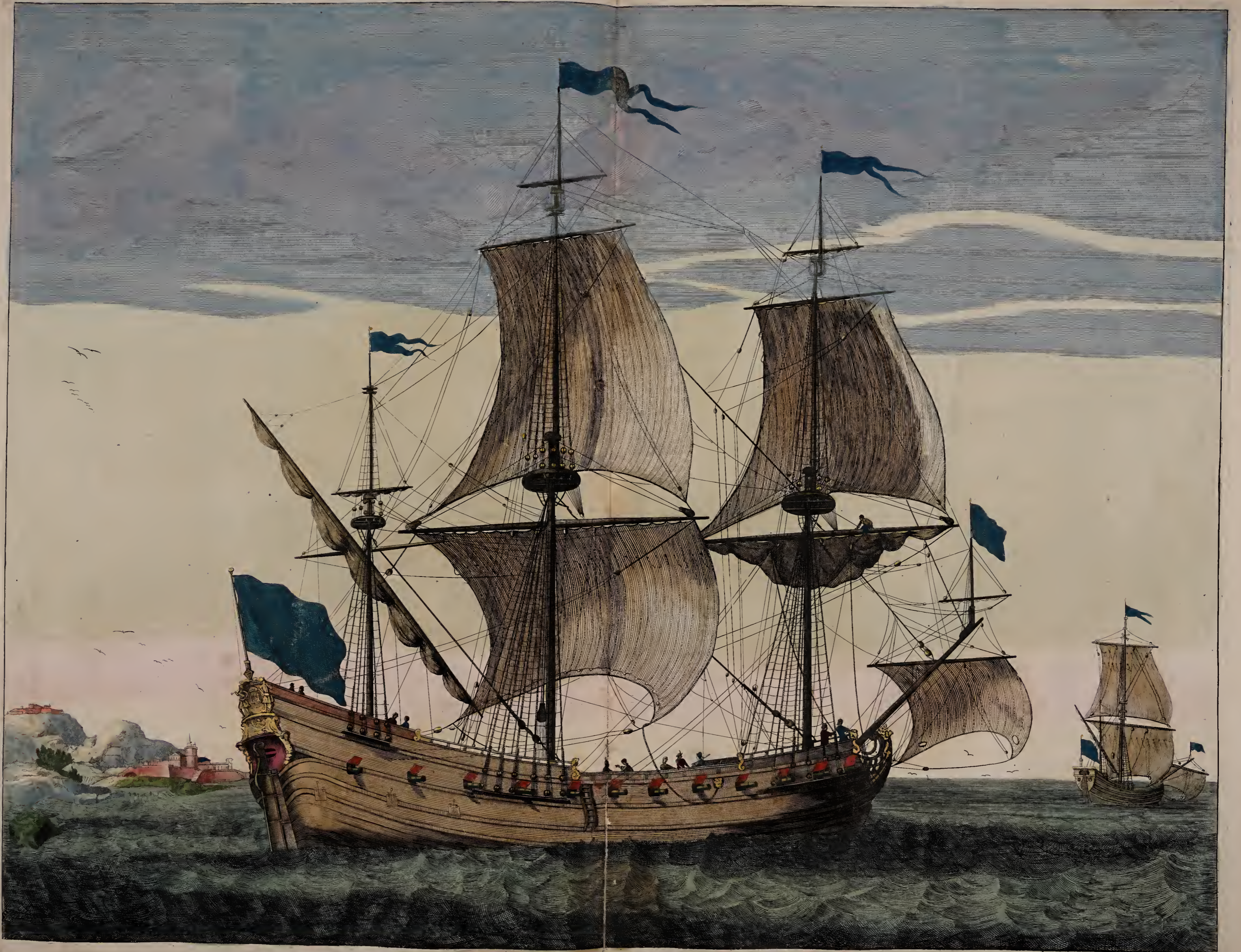
Flute Vaisseau de charge a la voile . Koopvaardy Fluydt.

A Amsterdam Chez Pierre Mortier Avec Privilège