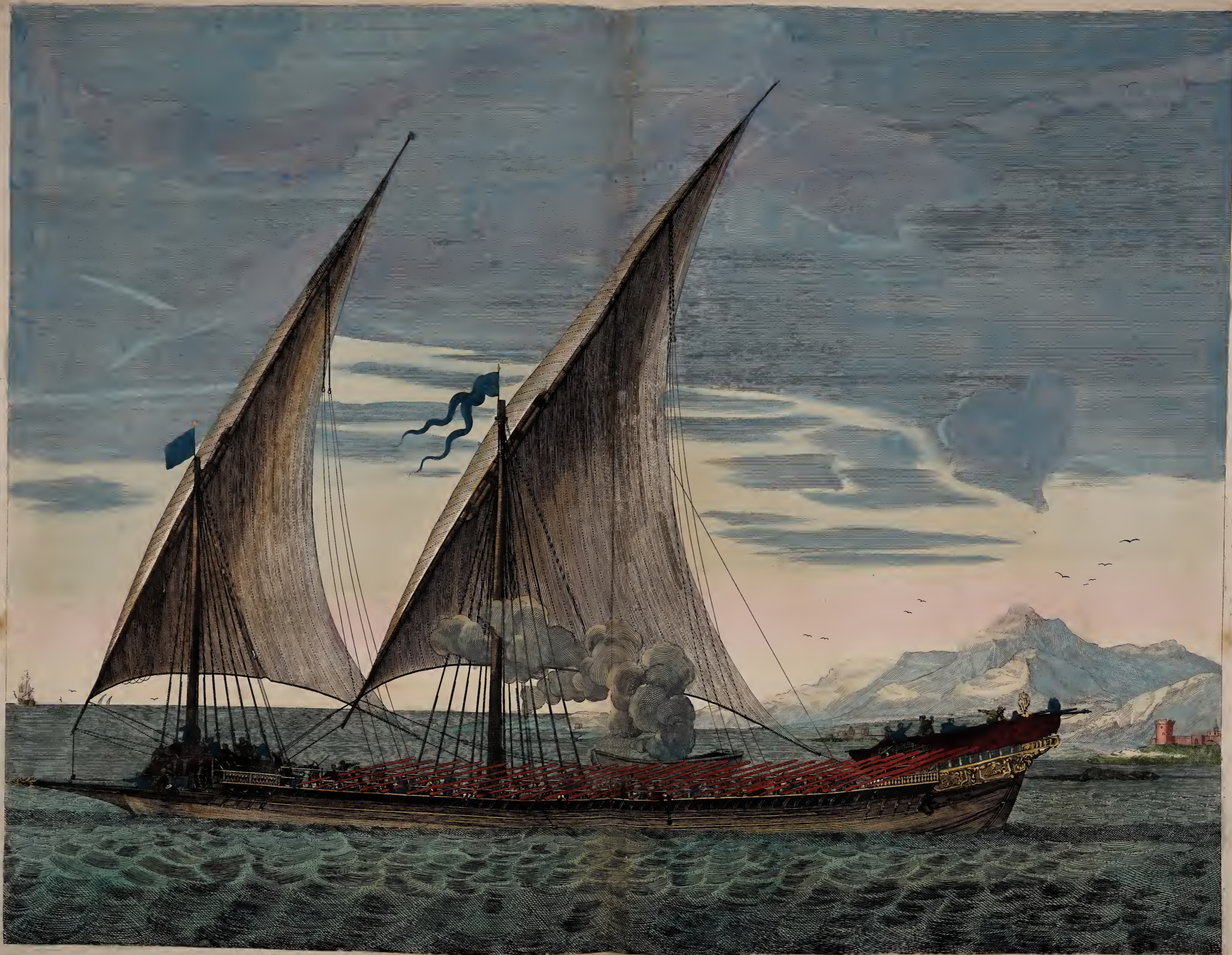
Galere a la voile portant l'Estendart de chef d'Escadre,

a Amsterdam, Chez Pierre Mortier Avec Privilege. Zeylende Galley voerende d'Admiraals Vlag.