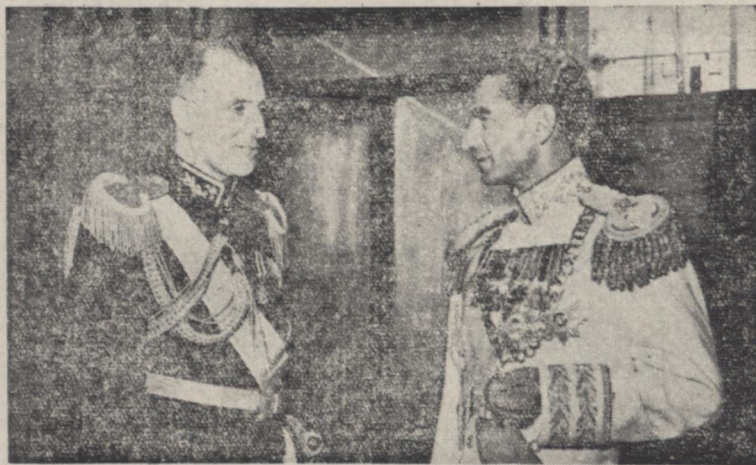
اعلیحضرت همایون شاهنشاهی و تیمسار سپهبد زاهدی نخست وزیر در مراسم سلام عید غدیر که در کاخ سفید سعدآباد انجام گرفت

در چند روز اخیر روزنامه اطلاعات بکثرت متوقف گردید و فقط از اخبار و وقایع جاری داخل و خارج کشور که در این مدت تعطیل اتفاق افتاد و حائز اهمیت خاصی بود در این شماره به تفصیل درج شده و بقیه بطور اختصار منعکس گردیده است - رای آنکه خوانندگان محترم در جریان اوضاع و حوادث فراتر رفته باشند قسمت های برجسته اخبار و روایات چند روز اخیر در این صفحه درج میشود: