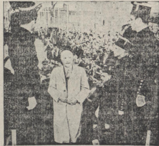
دانیل صدر اعظم آلمان و رهبر حزب دموکرات مسیحی قبل از تظلم انتخاباتی در کولون

احزاب بزرگ آلمان سیاست خارجی یکدیگر می کنند حزب دموکرات مسیحی طرفدار شرکت آلمان در سازمانهای دفاعی اروپاست و حزب سوسیال دموکرات معتقد به بیطرفی کامل آلمان است انتخابات آلمان روز یکشنبه شروع خواهد شد کمیته‌هایی که برای تبلیغ آلمان غربی رفته بودند بازداشت شدند