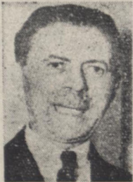
تیمسار سپهبد زاهدی نخست وزیر

خبر نگار اخیر گزارشی آسوشیتد پرسیس در باره ملاقات اخیر نخست وزیر ایران و سفیر امریکا از تهران گزارش میدهد که بر طبق اظهارات یک منبع ایرانی یکی از مهمترین موضوعاتی که در ملاقات مزبور صورت گرفته مسئله کمک فوری امریکا به ایران بوده است و همین منبع اضافه میکند که نخست وزیر ایران اعلام کرده که حتی کمک فوری بمقدار کم بهتر از کمک مالی زیاد است که در پرداخت آن تعویقی روی دهد و وضع دولت جدید ایران راپه معاشره بیندازد.