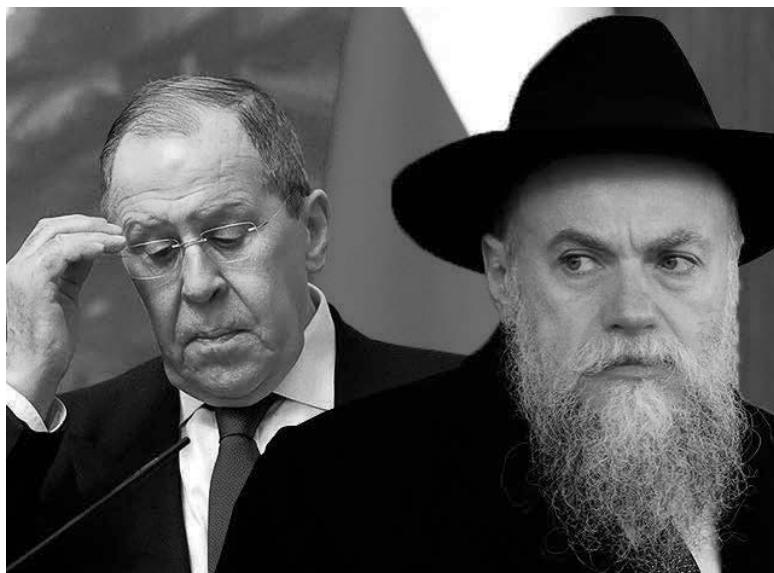
Президент ФЕГР рабин Олександр Борода і міністр закордонних справ РФ Сергій Лавров. Колаж.

Попередній аналіз позицій та діяльності православних, мусульманських, буддистських та іудейських організацій, які діють у Росії та користуються найбільшою популярністю серед російського населення, свідчить про залученість різною мірою в обґрунтування, виправдання та ведення війни РФ проти України на етапі широкомасштабної збройної агресії, що розпочалася у лютому 2022 р. Найглибше включені у ці процеси православні та мусульманські організації, меншою мірою – буддистські та іудейські. Фактично численніші російські релігійні організації православних, мусульман і буддистів стали частиною російської військової пропагандистської машини, вони агітаційно-інформаційно підтримують скоєння злочину агресії, порушення суверенітету і територіальної цілісності Украї-