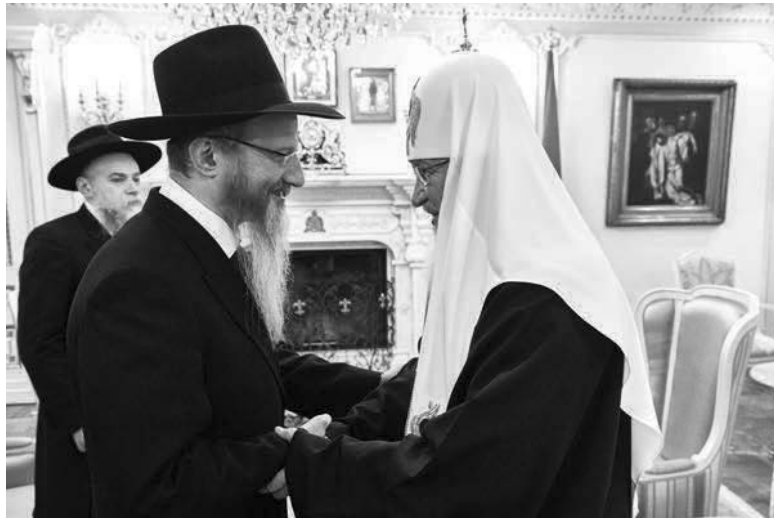
Головний рабин ФЕГР Берл Лазар і патріарх РПЦ Кирилл

Ксенофобські заяви представників влади Росії нерідко поєднують українофобію та антисемітизм. У таких випадках ФЕГР вимушена критикувати авторів найбільш одіозних тверджень. Так було, наприклад, у травні 2022 р. зі скандалом з міністром закордонних справ РФ С. Лавровим, який, прагнучи дискредитувати президента України В.