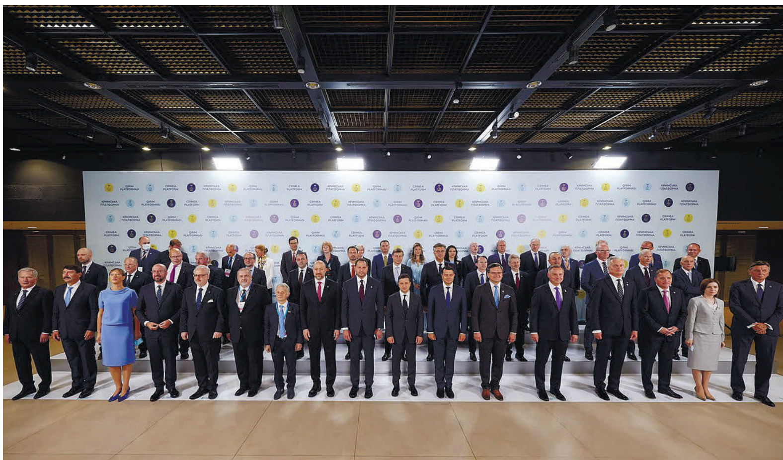
Учасники Першого саміту Кримської платформи, 2021 рік

Сьогодні це питання активно обговорюють дипломати, політики та військові. Але найрозуміліше за всіх говорять наші Збройні сили України, від яких залежить майбутня доля деокупації Криму.