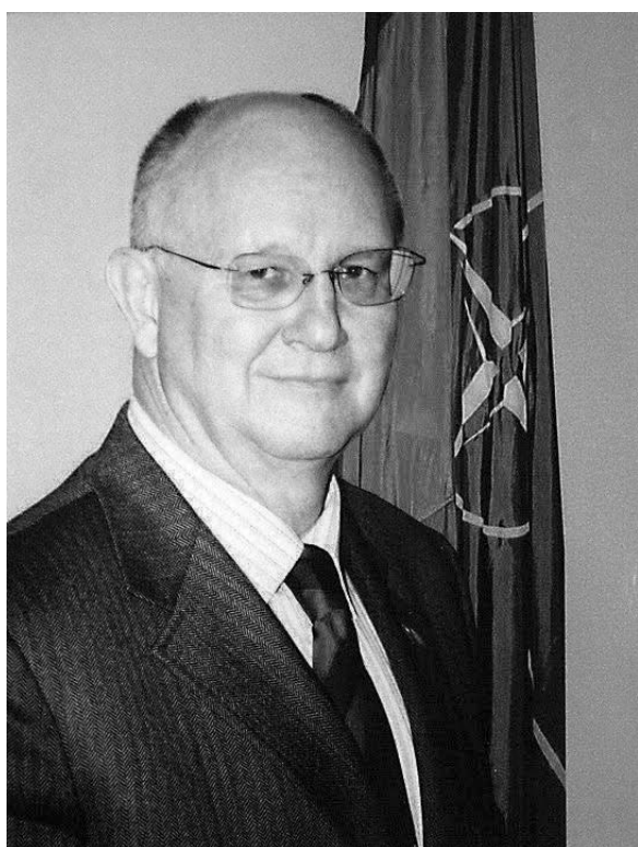
Віцепрезидент Європейського парламенту Іон Мірча Пашку

І знову повертаюся в 1990-ті роки. Тоді вихідці з Середньої Азії перед розвалом Радянського Союзу дослужували в радянській армії, а потім уже після розвалу – в російській. Пригадайте, що відбулося в м. Ходжали (Азербайджан) у лютому 1992 року. Це місто було оточено 366-м російським полком, з місцем дислокації в Степанкерті (Ханкенді). Російський полк у повному складі, з технікою, озброєнням брав безпосередню участь у Ходжалинському геноциді, де було вирізано близько тисячі мирних мешканців. Якщо участь у якихось діях бере техніка та озброєння, а також командування полку, то про це знає командування дивізії, штаб армії, округа і, звісно, Москва. Це означає, що ця операція із залякування Азербайджану відбувалася з відома Москви. Хочу звернути вашу увагу, що на той період механіками, водіями військової техніки в основному були вихідці