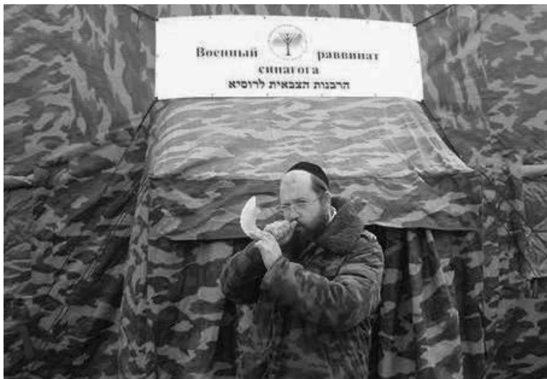
Головний військовий рабин Росії Аарон Гуревич

Зеленського, припустив, що у Гітлера була єврейська кров і приписав євреям твердження, що «найзатятіші антисеміти, як правило, євреї». Берл Лазар назвав шокуючими заяви Лаврова й у м'якій формі закликав його вибачитися перед євреями. Головний рабин Росії також наголосив на недоречності пов'язування історії Голокосту, який був частиною нацистської ідеології і політики, «до теперішнього конфлікту».