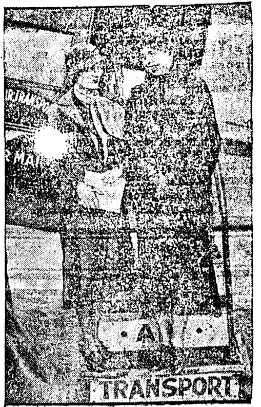
Krong Noosevelt asub ookeanilennukisje.

Fogu maa on rahuga wastu wõtnud walituse korraldused. See rahu jäägu pii sima ka edaspidi. Iga itamaaline koda nik aidatu niid walituseõimudele nende töös ja teguwuses kaasa, sest kiik walituse jannud on niid sihitud ühe eesmärgi poole — riigi ja rahwa julgeoleku kindlustamises.