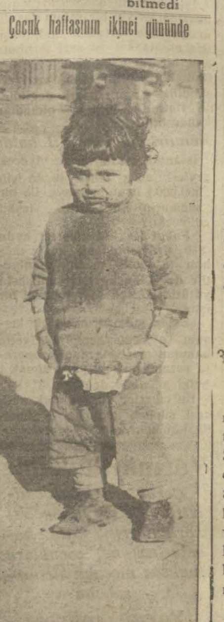
Bu çocuğa acıyınız. Ona elinizi uzatınız. Kim derki bu çocuk garının bir büyüğü ve Türk milletinin bir yıldızı değildir?

Arkadaki kıtaatı bu vaziyette bir ok bile atamadı. Umutsuz bir vaziyete düşmüşlerdi. Asyanın koca şatranç oyuncusunun hareketi karşısında padişah için kurtuluş ümidi yoktu.