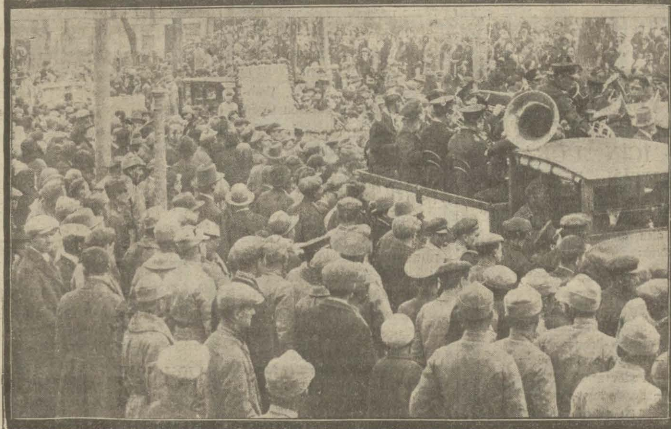
Dün Milli Hakimiyet bayramı ve çocuk bayramı idi. Bugünü halk ve çocuklar hararetle tes'it ettiler.