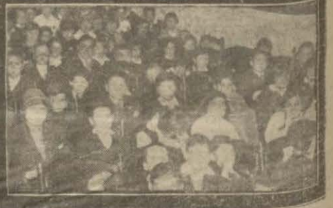
Dün çocuklar resmi geçit esnasında Vilayette ve Şehremanetinde selâmlandılar. Türkocasına vaz'iyet ettiler.