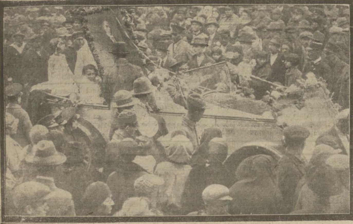
Dün çocuklar Taksimden Fatih'e kadar bir geçit resmi yaptılar ve çok alkışlandılar.