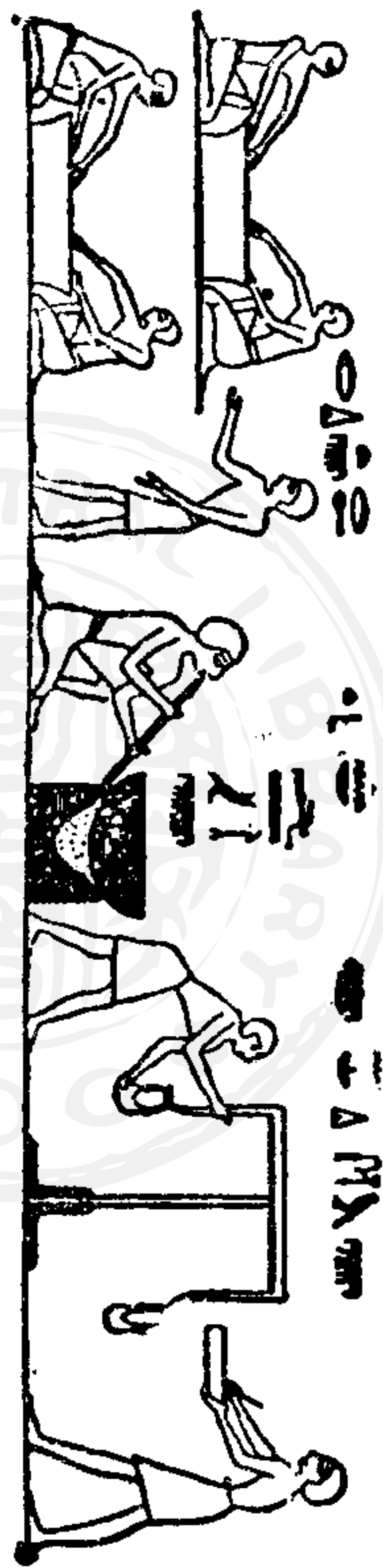
圖 1. 古代埃及金的精煉(壁畫): 洗取砂金, 鑄制金屬, 秤量金屬。

金的原名，在希伯來語或埃及語是表示有光輝的東西。古代的化學家稱金為太陽（gold the