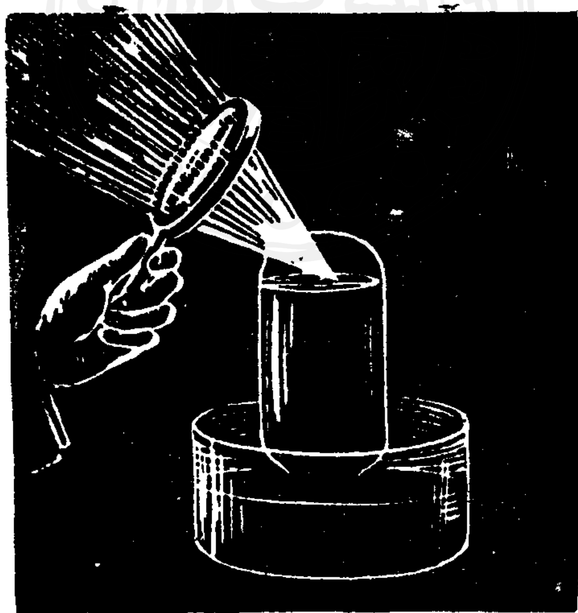
圖 2. 普氏的養氣實驗