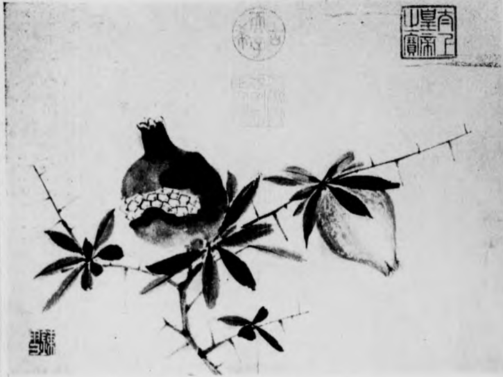
說明本刊第三八三期