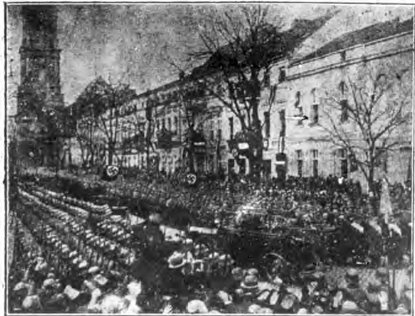
新 德 國 的 群 衆 運 動