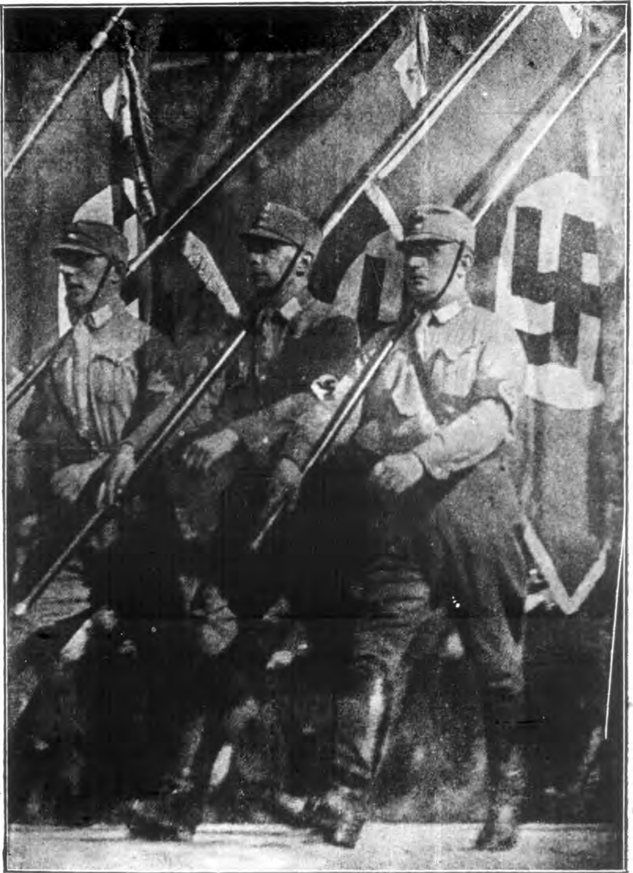
前 進 中 的 新 德 國 青 年