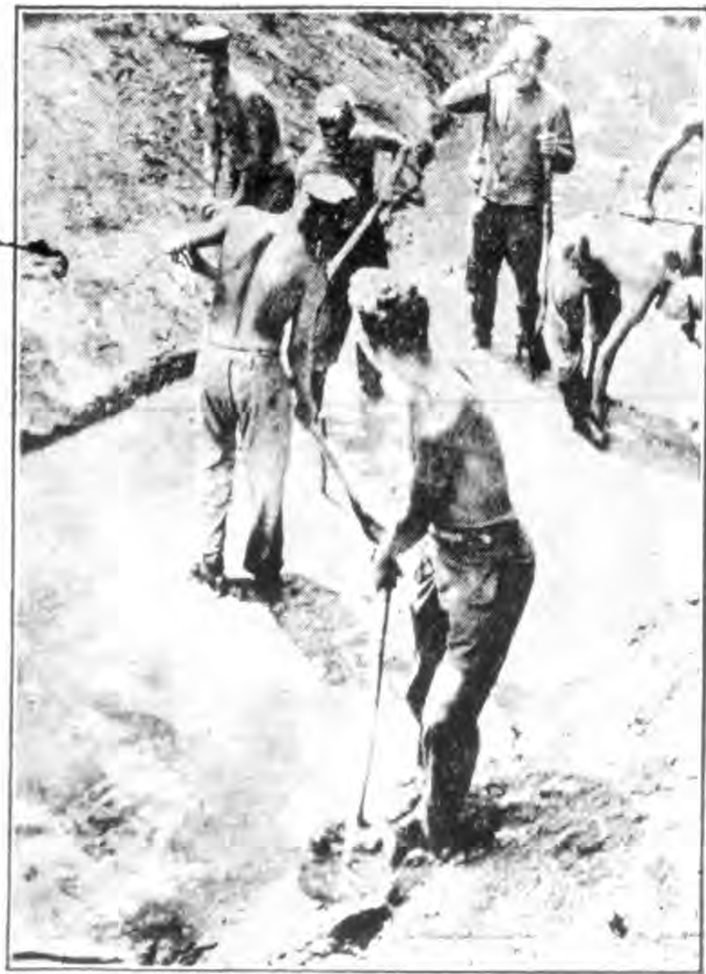
勞作是全體民衆的任務