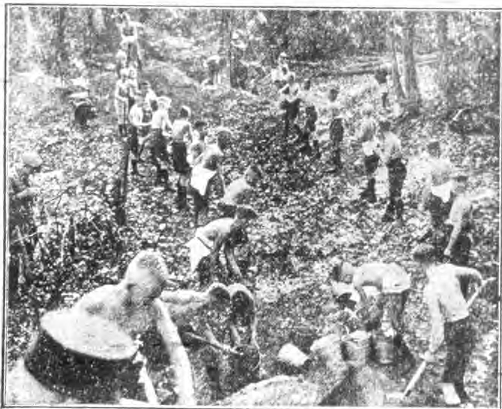
新 德 國 的 體 育 運 動