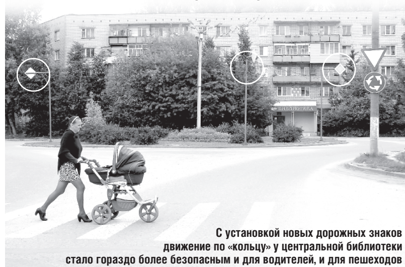
С установкой новых дорожных знаков движение по «кольцу» у центральной библиотеки стало гораздо более безопасным и для водителей, и для пешеходов

И вот недавно по периметру клумбы появились хорошо заметные знаки «Главная дорога». Соответствующие знаки появились и на въезде на развязку... В итоге сделан еще один шаг на пути к комфортному и безопасному городу!