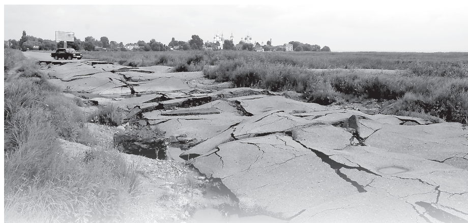
У наших соседей