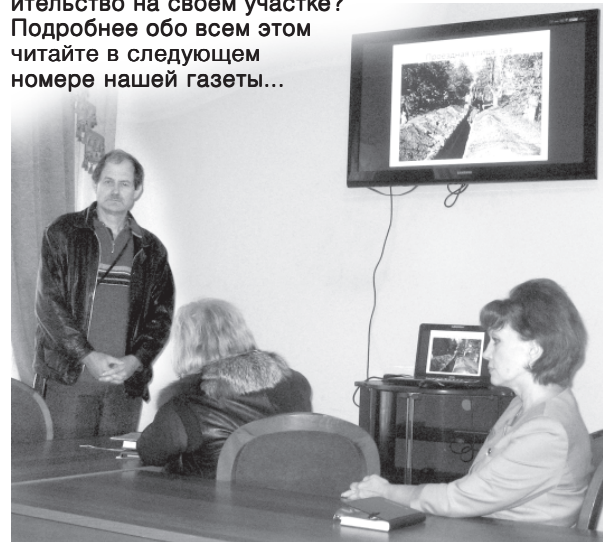
Руководитель переславской археологической экспедиции (слева) рассказывает о находках, сделанных в ходе недавних раскопок в исторической части Переславля