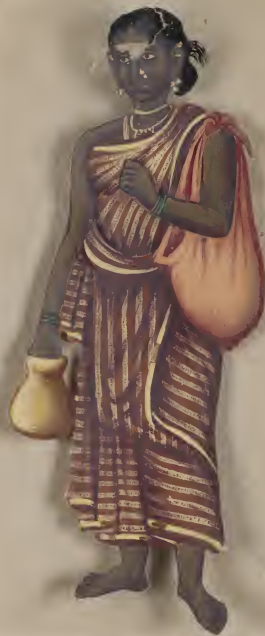
Kerala കുറുപ്പു കയ്യേ