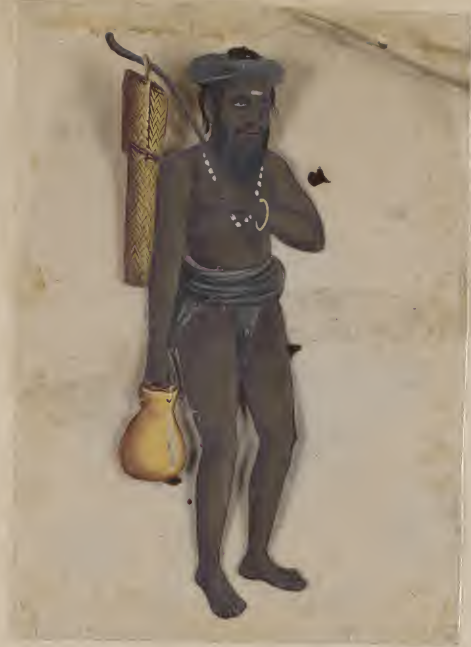
Salt-Seller. Gentoos! 2 44 2587 2007 2007