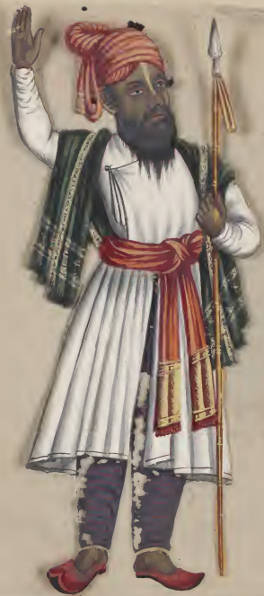
Hindoo Herald ஹனுமன் கருவியுள்ளவர்