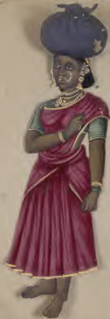
Kumak 6 11 2 19 11 10 11 11