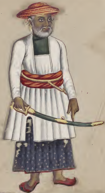
Musliman Merchant ਮੁਸਲਮਾਨ ਭਾਈ