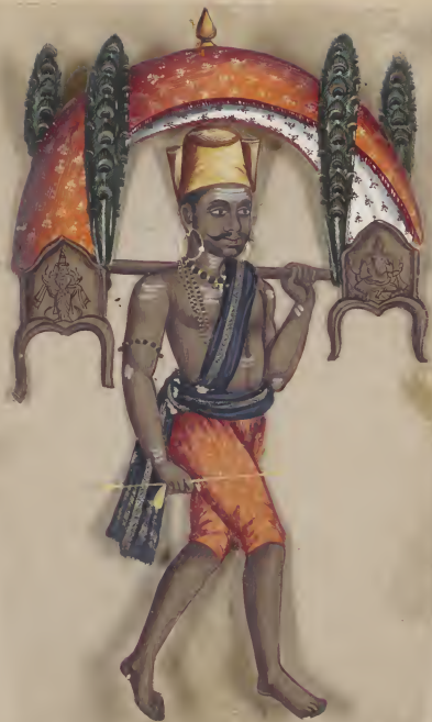
Malabar Pilgrim பழனிக்குகை கருவடி சிவசுந்தரி சிவசுந்தரி