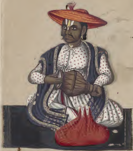
Hindoo Musician ২১ ৫১ ২১ ০৭