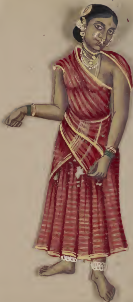
Jewels ಶ ೧೮೦೭ ಶ ೪ ೧ ೦೭