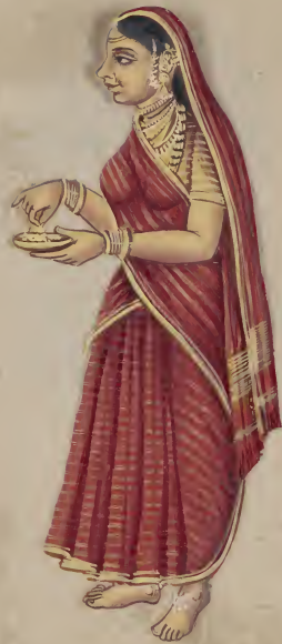
Shri ॐ नमो भगवते वासुदेवाय