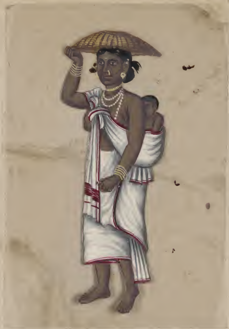
Female & her Child No 51