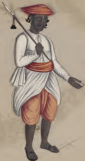
Hindu Palanquin Bearer. வடுபலனாககு போகி