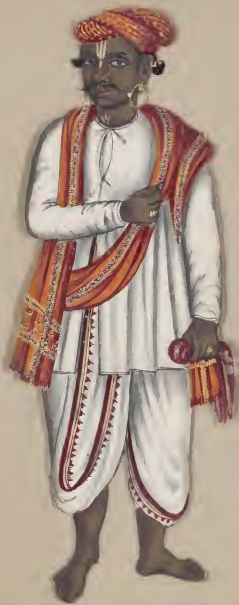
Hindoo Brahmīn C 67 18 49