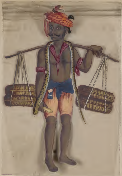
Musliman Snake Catcher