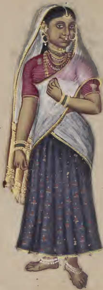
Surat L. M. S. K. S.