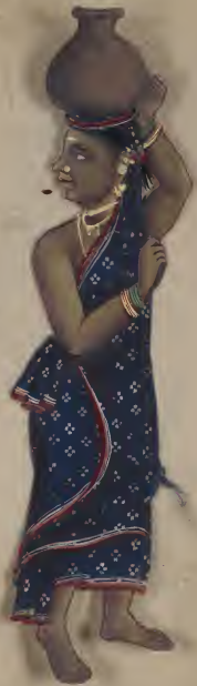
Female. No 119