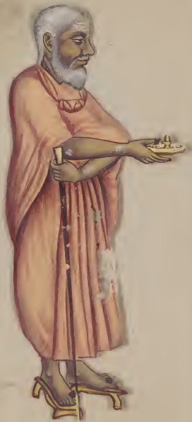
Amarendra's Bhakti ॐ नमो भगवते वासुदेवाय