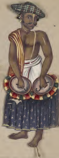
Rajapoot-Musician 7/4/19 10/19/19