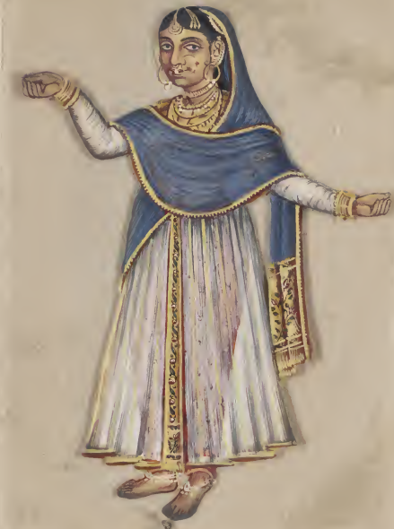
Musliman Dancing Girl 5) 1866 174 17 17 17