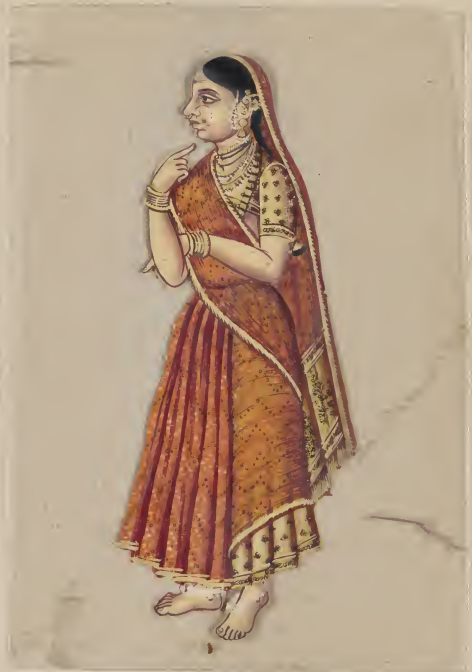
Female — श्री गणेशाय नमः —