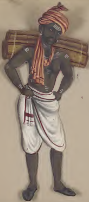
Hindu Mat Maker ഹിന്ദു മട്ടുപണി പണിക്കർ