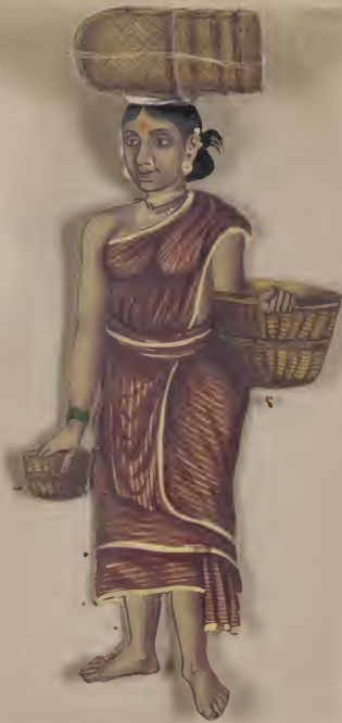
Female പ്രാഥമിക പണി പണിക്കർ