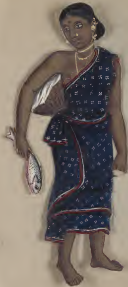
Female to Mr. [unclear]