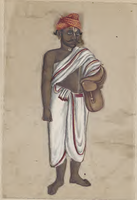
Hindoo Sadakler १ १३ १५ १७ १९ २१ २३ २५ २७ २९ ३१ ३३ ३५ ३७ ३९ ४१ ४३ ४५ ४७ ४९ ५१ ५३ ५५ ५७ ५९ ६१ ६३ ६५ ६७ ६९ ७१ ७३ ७५ ७७ ७९ ८१ ८३ ८५ ८७ ८९ ९१ ९३ ९५ ९७ ९९