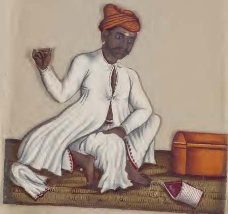
Malabar Tailor of LS of the Malabar