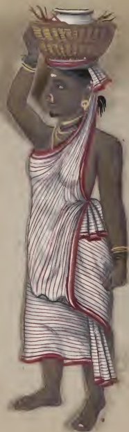
Andor Torch Bearer. It was on 104 to 7 B B 607