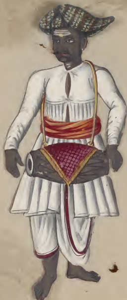
Hindu Musicians. १. २. ३. ४. ५. ६. ७. ८. ९. १०. ११. १२.