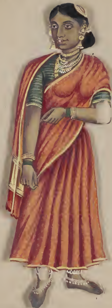
Female C 67 18 49