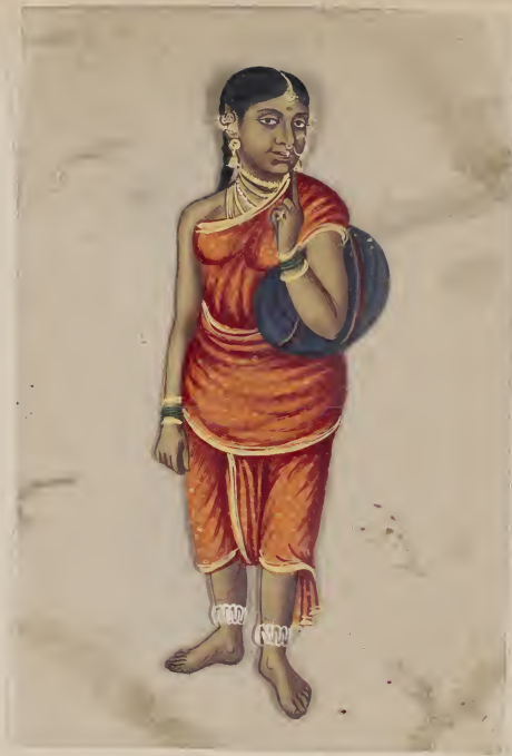
Lakshmi சுமார் 11 பத்திரம் 1000