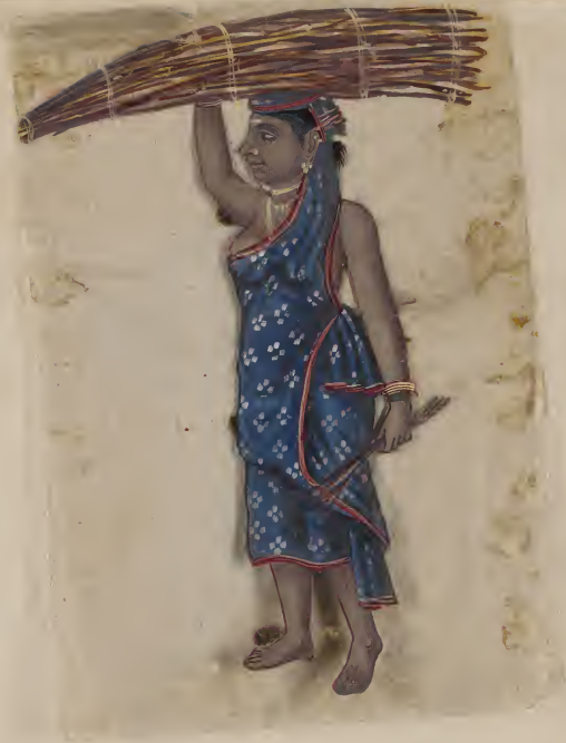
Female വെട്ടി കണ്ടി വന്ന