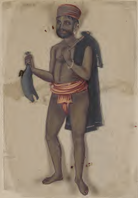
Fish Digger (Gentoo) No 50