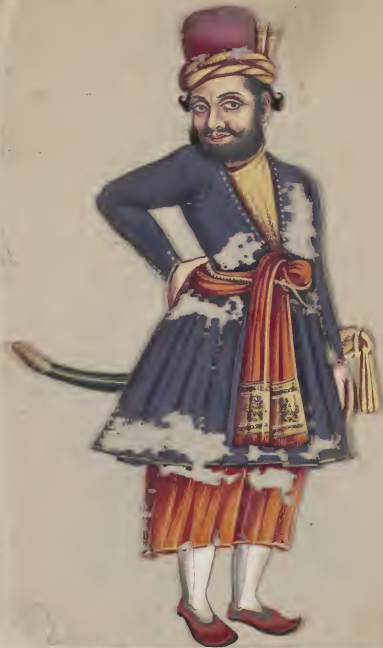
Muslimman King முகல