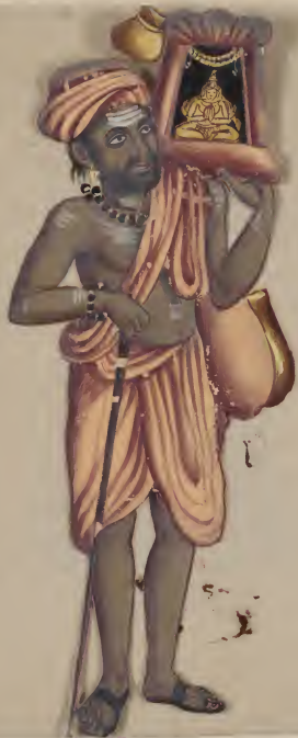
Rajapoot Chief १७५५५५५५