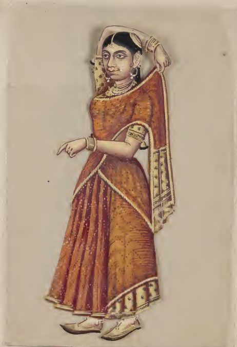
Arab Female — ۱۱ ۱۹ ۱۰۸۲۵۱۹