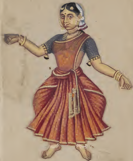
Hindu Dancing Girl - கலாநாயகி லு லா லா