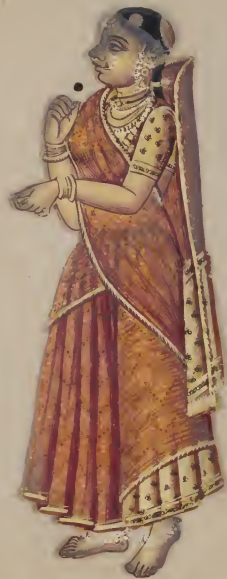
Mahratta Female. ॐ नमो भगवते वासुदेवाय