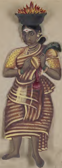
Religious Offering (Mudoo) Lan... .. Lan... ..