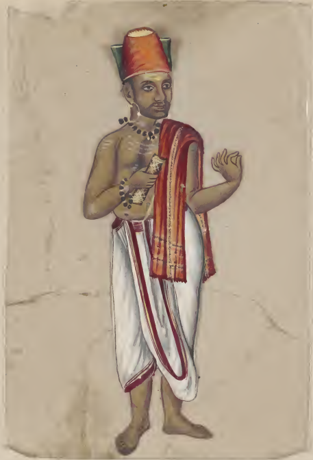
Hindoo Athorometer சுமார் 11 பத்திரம் 1000