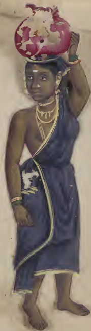
Temple பழனிக்குகை கருவடி சிவசுந்தரி சிவசுந்தரி