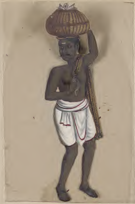
Fishmonger (Malabar) 1877