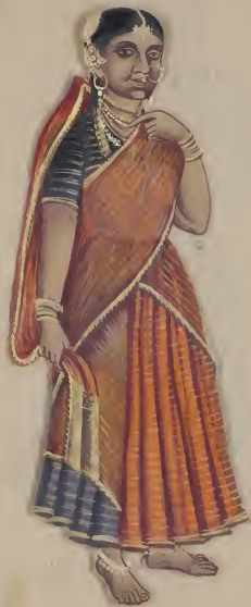
Tamab கி. பி. 1874