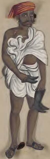
Cobbler - (Kulabaru) சுகந்தியன்