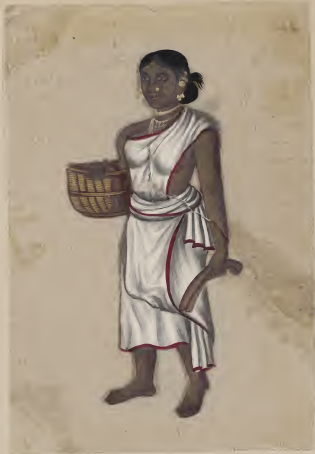
Female B 111 111 111