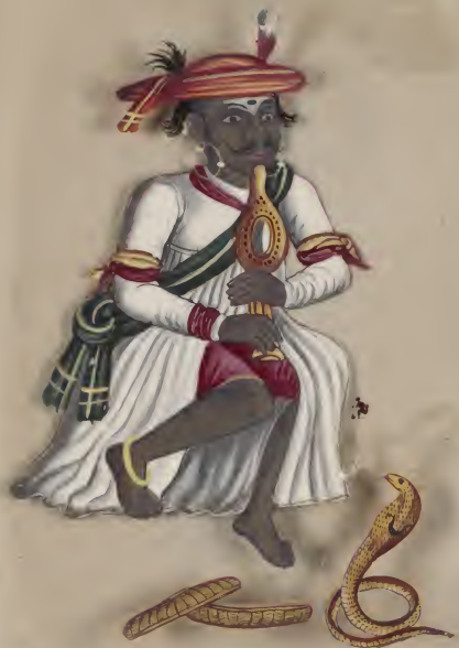
Snake Catcher (Velliyar) புளியாறு பிடிப்பவர்