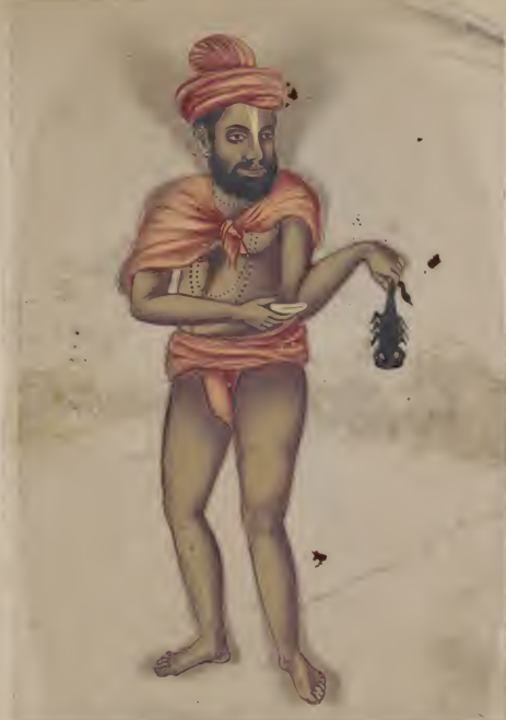
Rajapoot Conjurer ॥ ४ ५ ६ ७ ८ ९ १० ११ १२ १३ १४ १५ १६ १७ १८ १९ २० २१ २२ २३ २४ २५ २६ २७ २८ २९ ३० ३१ ३२ ३३ ३४ ३५ ३६ ३७ ३८ ३९ ४० ४१ ४२ ४३ ४४ ४५ ४६ ४७ ४८ ४९ ५० ५१ ५२ ५३ ५४ ५५ ५६ ५७ ५८ ५९ ६० ६१ ६२ ६३ ६४ ६५ ६६ ६७ ६८ ६९ ७० ७१ ७२ ७३ ७४ ७५ ७६ ७७ ७८ ७९ ८० ८१ ८२ ८३ ८४ ८५ ८६ ८७ ८८ ८९ ९० ९१ ९२ ९३ ९४ ९५ ९६ ९७ ९८ ९९ १००