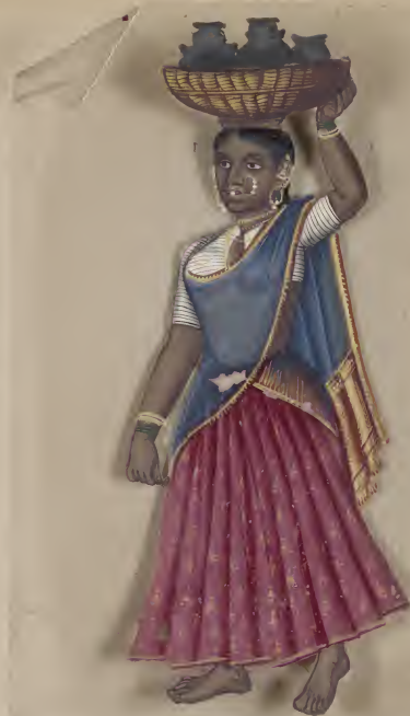
Female 2 10 11 19