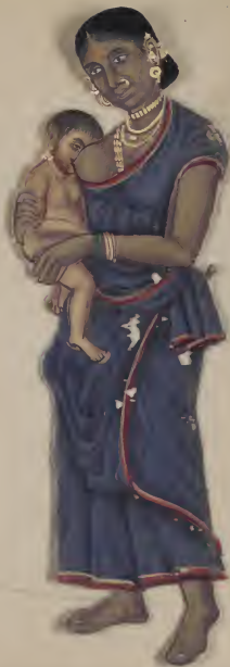
Female & her Child. பெண்மணி & குழந்தை