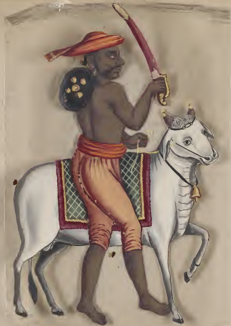
Lambaudy 2 10 11 19