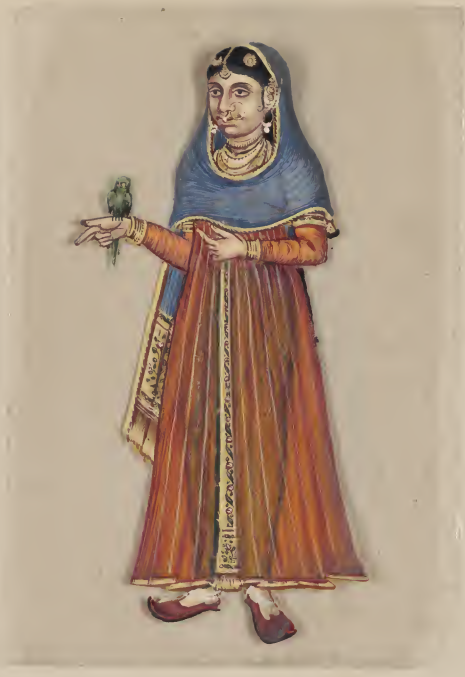
Female ਫਿਰੋਜ਼ ਸ਼ਾਹ ਦੁਰਾਣੀ