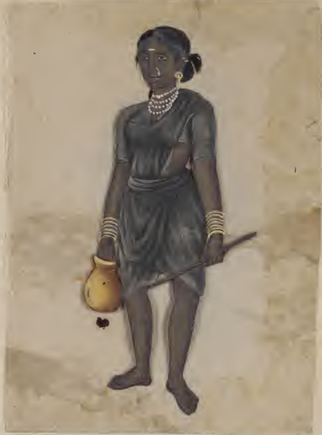
Female. 2 44 2587 2007 2007