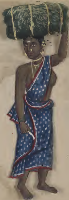
Female കുറുപ്പു കായ