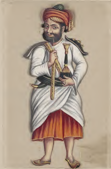
Arab Soldier — ۱۱ ۱۹