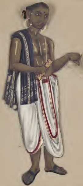
Kalhoravather Brahminy கலைவாதிபரசுகடையுள்ள