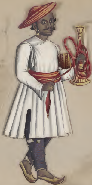
Mussilman Kookahbedar. 625628811 1785