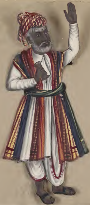
Fortuneteller — (Malabar) കുറുപ്പു കയ്യേ