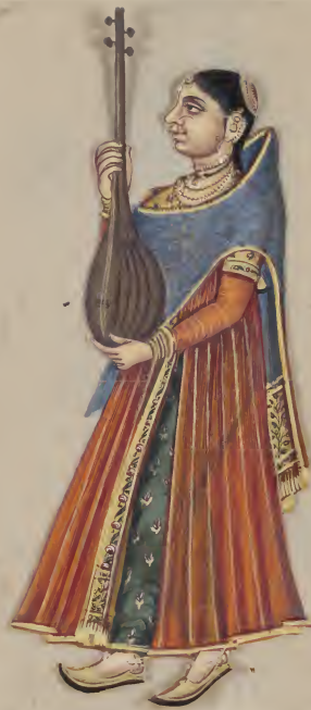
Venak, பட்டா சீப் மனகுமாரி