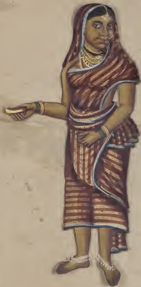
Jewak முத்து விகிதம் உடம்ப