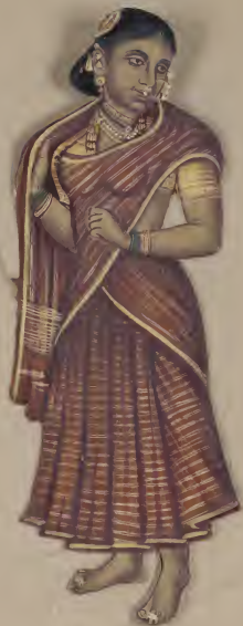
Female வடுக போகி லோ மயலே