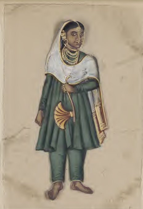
Female துலகக தீடு லொதுசாகு