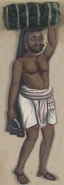
Grass butter (Malabar) കുറുപ്പു കായ