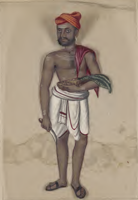
Gardener (Malabar) By H. H. King