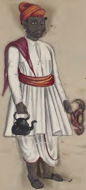
Cook - (Pariah) to Mr. [unclear]