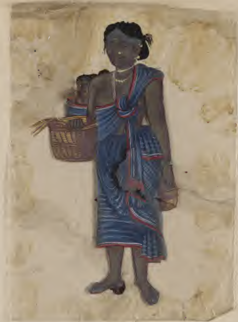
Basket maker (Malabar) Female & her child 6477 21 007 Q 20 19 8