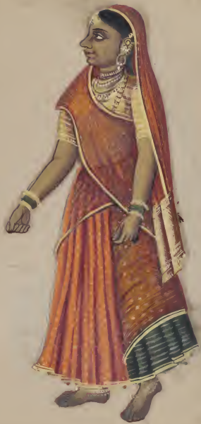
Female 625628811 1785