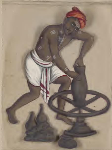
Hindoo Potter 6th 4 25 57