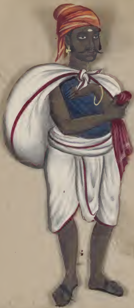
Shiido Washerman No. 100