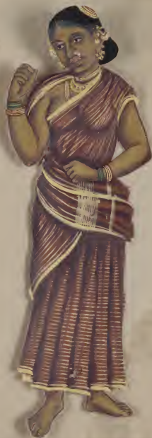
Woman by L. D. M. G. L. M. G.