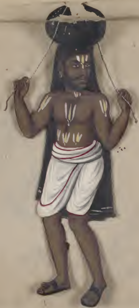
Milk Man L 112 107 04 L 107