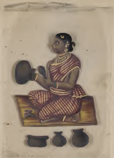
Hindu 6th 4 25 57