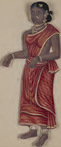
Female of LS of the Malabar