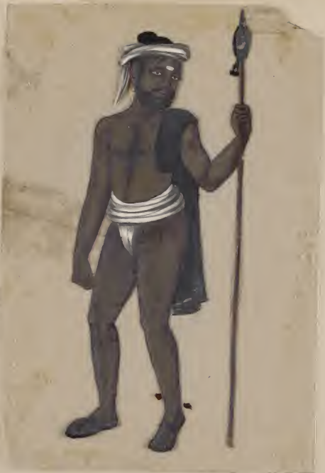
Hindu Thief Tribe B 111 111 111