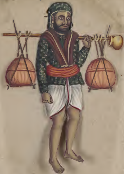
Causer Brahminy 6 11 2 19 11 10 11 11