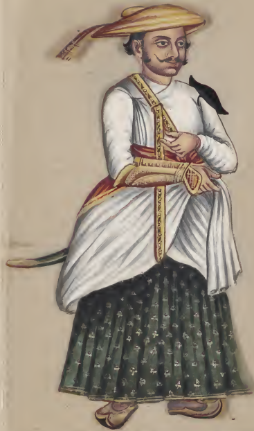
Sataw Chief பட்டா சீப்