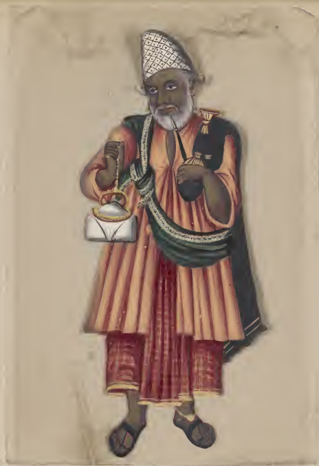
Musliman Pilgrim, துலகக பக தீடு