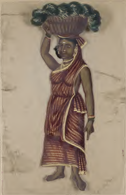
Female By H. H. King