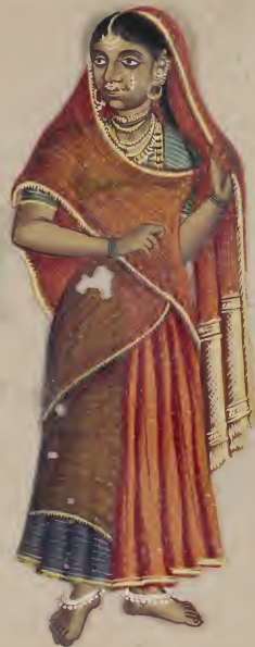
Hindu ਮੁਸਲਮਾਨ ਭਾਈ