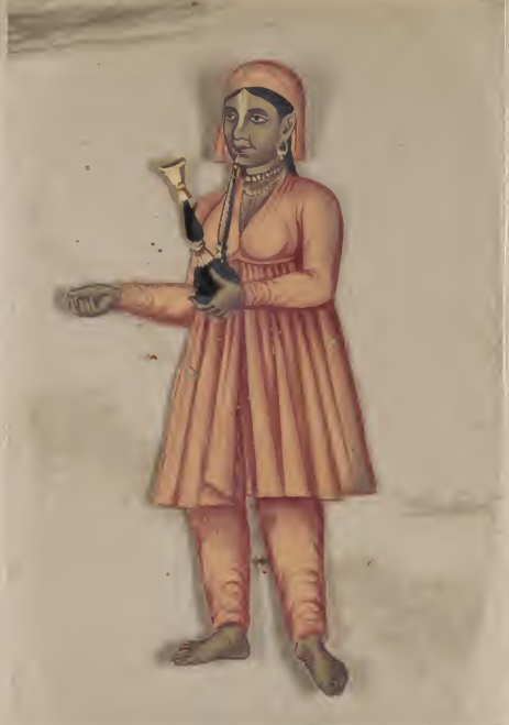
Female ॥ ४ ५ ६ ७ ८ ९ १० ११ १२ १३ १४ १५ १६ १७ १८ १९ २० २१ २२ २३ २४ २५ २६ २७ २८ २९ ३० ३१ ३२ ३३ ३४ ३५ ३६ ३७ ३८ ३९ ४० ४१ ४२ ४३ ४४ ४५ ४६ ४७ ४८ ४९ ५० ५१ ५२ ५३ ५४ ५५ ५६ ५७ ५८ ५९ ६० ६१ ६२ ६३ ६४ ६५ ६६ ६७ ६८ ६९ ७० ७१ ७२ ७३ ७४ ७५ ७६ ७७ ७८ ७९ ८० ८१ ८२ ८३ ८४ ८५ ८६ ८७ ८८ ८९ ९० ९१ ९२ ९३ ९४ ९५ ९६ ९७ ९८ ९९ १००