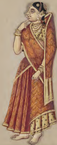
Female ଘଣ୍ଟାଠା ଓ ଧନ ଓ ଲାଭ