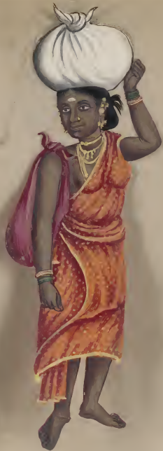
Shiido-Washerwoman No. 101