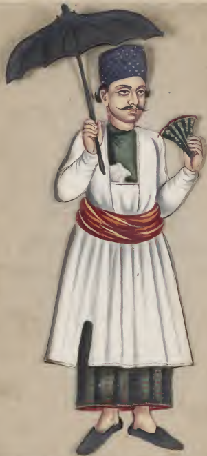
Surat L. M. S. K. S.