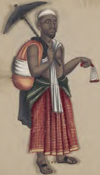
Sapidary (Musliman) முத்து விகிதம் உடம்ப