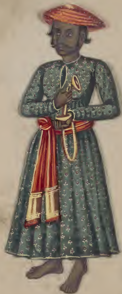
Musliman Dancing. Muskr 5) 1866 174 17 17 17