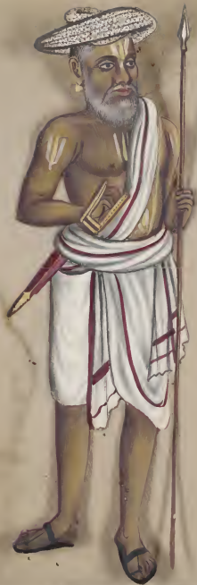
Hindoo Deities in the Court of the King