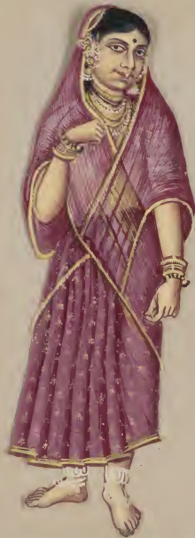
Fauzle கு சிவிய லாரா லுயி சி