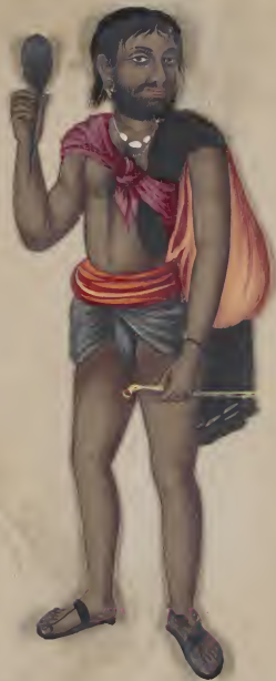
Musliman Beggar மஸ்லிம் பிள்ளை