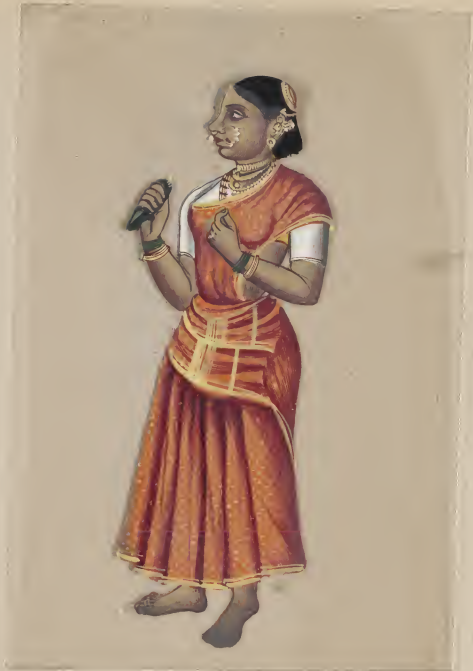
Jinnak १ १३ १५ १७ १९ २१ २३ २५ २७ २९ ३१ ३३ ३५ ३७ ३९ ४१ ४३ ४५ ४७ ४९ ५१ ५३ ५५ ५७ ५९ ६१ ६३ ६५ ६७ ६९ ७१ ७३ ७५ ७७ ७९ ८१ ८३ ८५ ८७ ८९ ९१ ९३ ९५ ९७ ९९