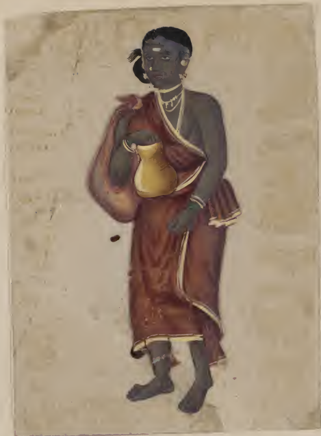
Tamil கல்காசு கட்டி