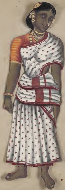
Female in the Court of the King