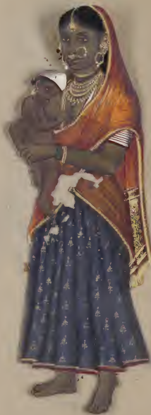
Female. & her child

பி. பி. 111 101149 1111111111111111 111111