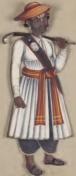
Hindoo Man வடுகேசியன்