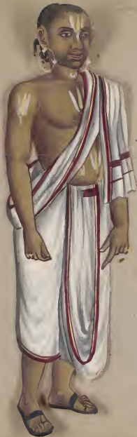
Strigum Brahmin 1711 1712 1713 1714 1715 1716 1717 1718 1719 1720 1721 1722 1723 1724 1725 1726 1727 1728 1729 1730 1731 1732 1733 1734 1735 1736 1737 1738 1739 1740 1741 1742 1743 1744 1745 1746 1747 1748 1749 1750 1751 1752 1753 1754 1755 1756 1757 1758 1759 1760 1761 1762 1763 1764 1765 1766 1767 1768 1769 1770 1771 1772 1773 1774 1775 1776 1777 1778 1779 1780 1781 1782 1783 1784 1785 1786 1787 1788 1789 1790 1791 1792 1793 1794 1795 1796 1797 1798 1799 1800