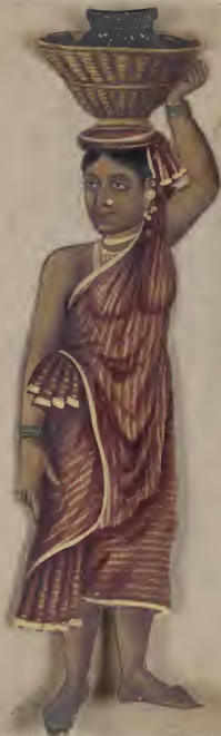
Female L 112 107 04 L 107