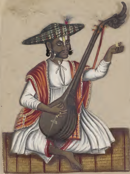
Hindoo Musician ২১ ৫১ ২১ ০৭