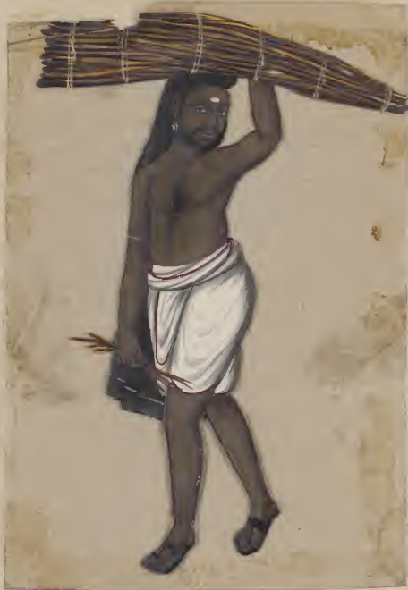
Wood Cutter - (Malabar) വെട്ടി കണ്ടി വന്ന