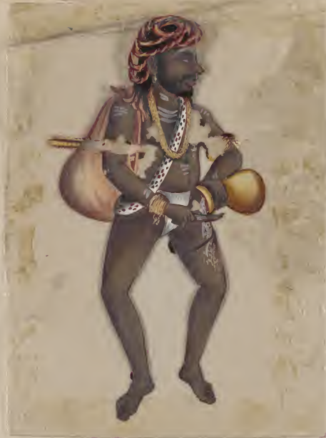
Hindoo Beggar - கல்காசு கட்டி