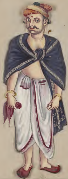
Guzerath Prakhariy. கு சிவிய லாரா லுயி சி