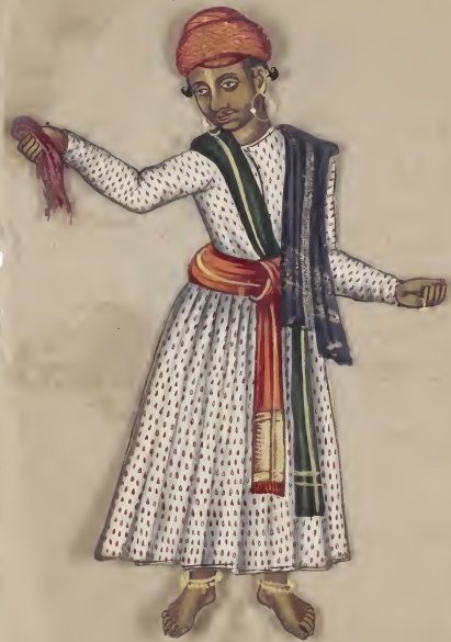
Rajapoot-Singer 7/4/19 7 10/19/19