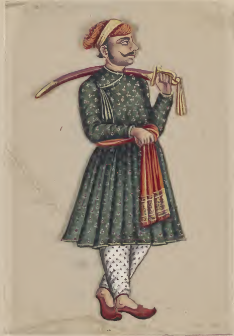
Arise Brahminy — श्री गणेशाय नमः —