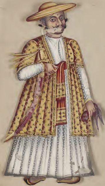
Mahratta Chief. ॐ नमो भगवते वासुदेवाय