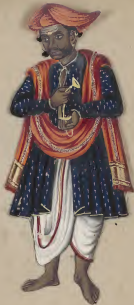
Hindu Dancing Master க லாநாயகி லு லா லா