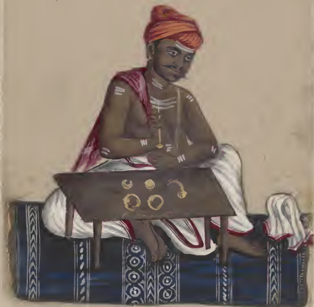
Malabar Goldsmith ಶ ೧೮೦೭ ಶ ೪ ೧ ೦೭