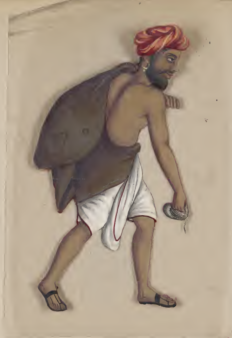
Musliman Water Carrier. சுல்தான் காரைக்கலைப் பற்றிய டாக்டர்