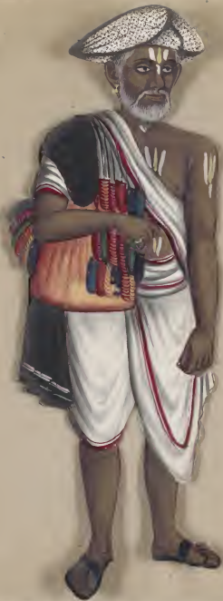
Shudoo-Range Matter. வரலாறு நிகழ்ச்சி வரலாறு