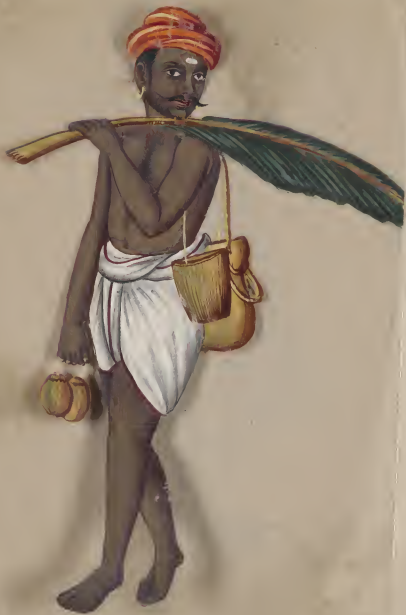
Toddyman, (Malabar) No 118