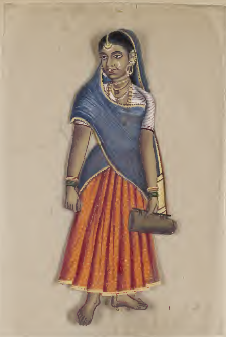
Female சுல்தான் காரைக்கலைப் பற்றிய டாக்டர்