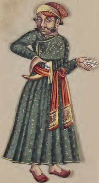
Mahratta Accountant ଘଣ୍ଟାଠା ଓ ଧନ ଓ ଲାଭ