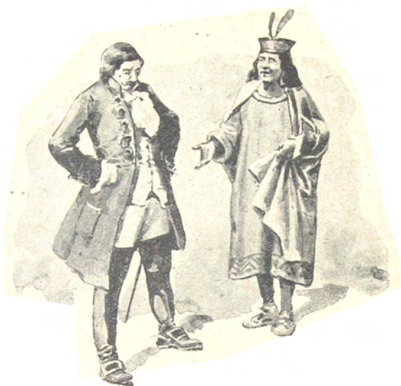
...Un caballero joven, no mal parecido

cio algo mayor y mejor construído que los demás, á cuya puerta se paseaba un soldado, al parecer de centinela.