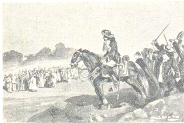
Mercado salió al encuentro del falso Inca.

sumisos, se dejaron cortar las largas melenas, —acto que en otros tiempos bastara por sí solo para provocar una sangrienta y larga insurrección, y que en aquel momento era un