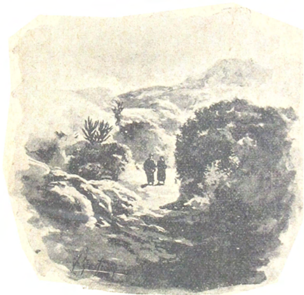
Subieron largo rato por una senda

—¡Ahí está el hijo del sol, Huallpa Inca!— dijo Luis en voz baja á su acompañante, que,