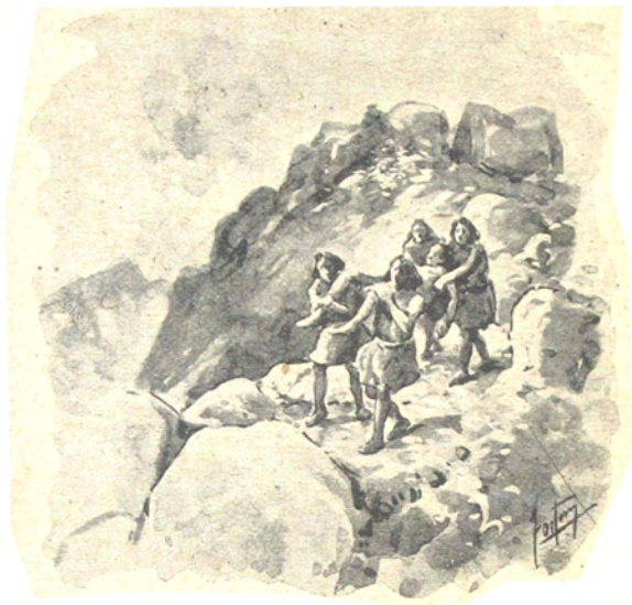
Los indios bajaban con el cadáver

bre iban destruyendo las piedras salientes y las asperezas que les servían de escala, de modo que no podían volver á subir. Llega-