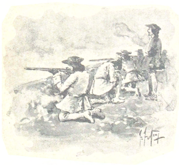
Comenzó el combate al amanecer.

los indios. Pero Bohórquez estaba lejos de ser un general que abarcara una situación compleja, é impulsado por las circunstancias aparentemente favorables y por la es-