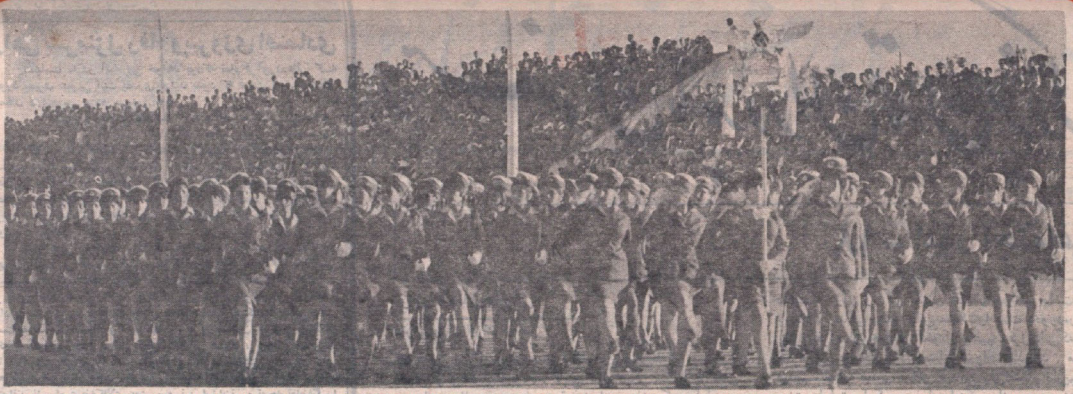
دختران نیروی هوایی شاهنشاهی