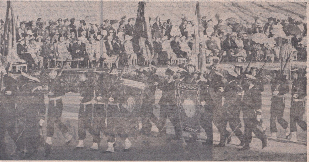
بیران نیروی دریایی شاهنشاهی