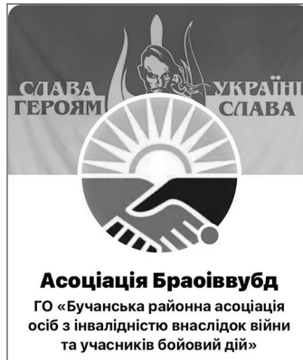
Асоціація Браоіввубд ГО «Бучанська районна асоціація осіб з інвалідністю внаслідок війни та учасників бойових дій»