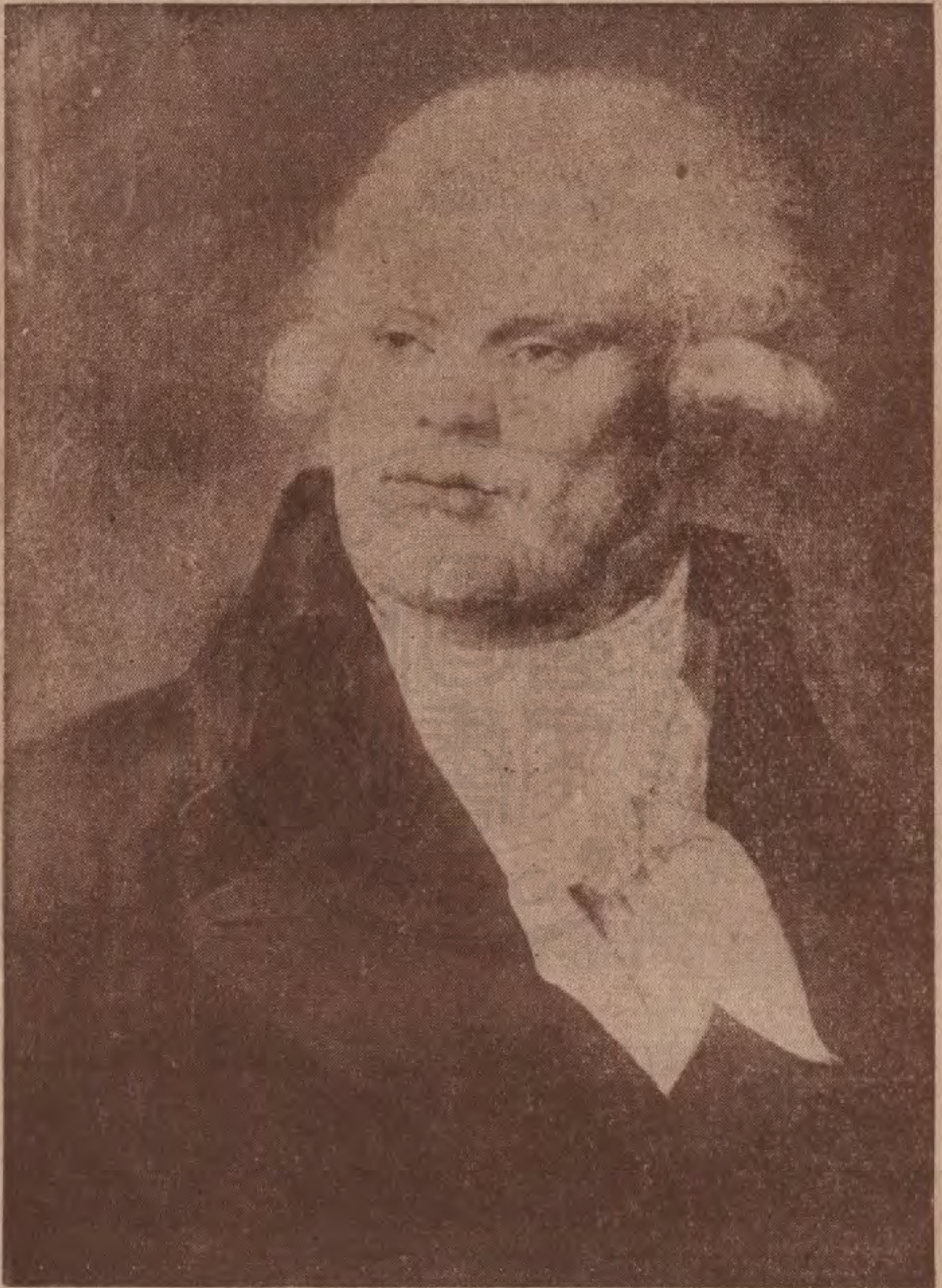
Georges-Jacques Danton (1759-1794)