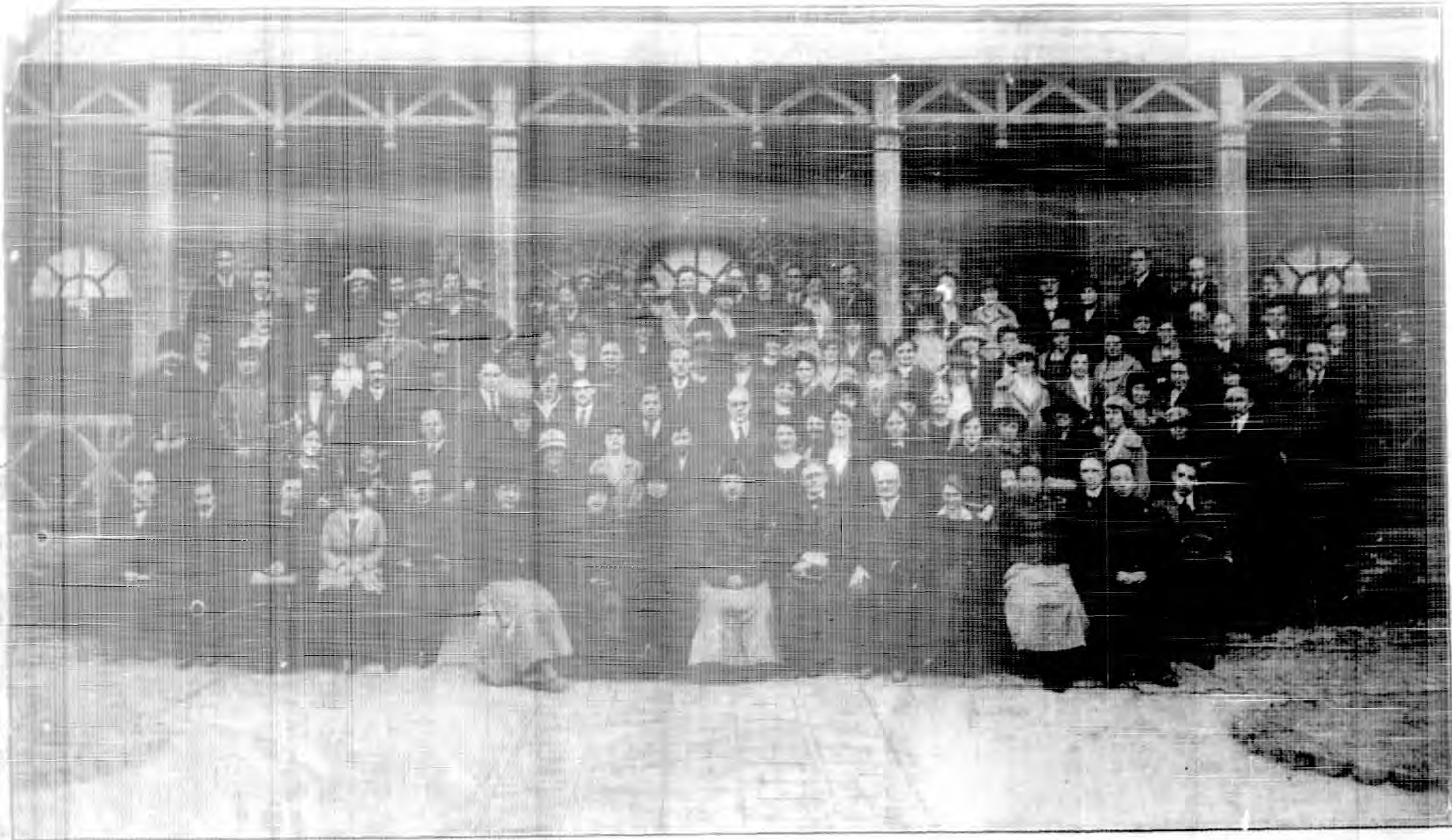
中 華 民 國 十 年 北 華 協 和 華 語 學 校 職 員 學 員 全 體 攝 影